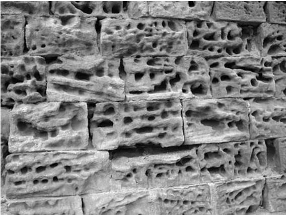
Figura 3. Arenización de sillares en “nido de abeja”. Castillo de Montearagón.