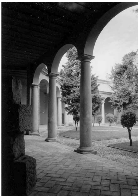
Figura 7. Columnas de areniscas en la antigua Universidad de Huesca.