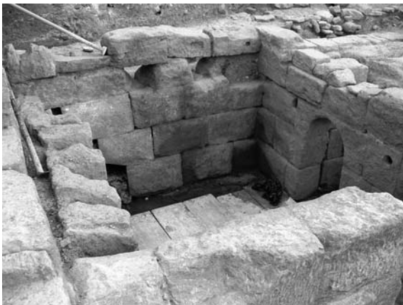
Figura 17. Pozo-fuente en solar de la calle Dormer.