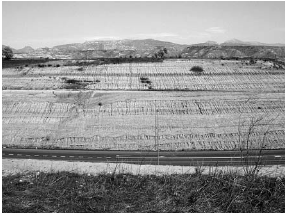
Figura 1. Variante norte de Huesca: corte geológico.