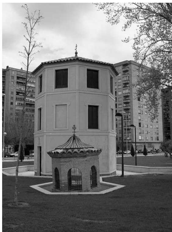
Figura 13. Huesca, Polígono 24: pozo en zona verde.