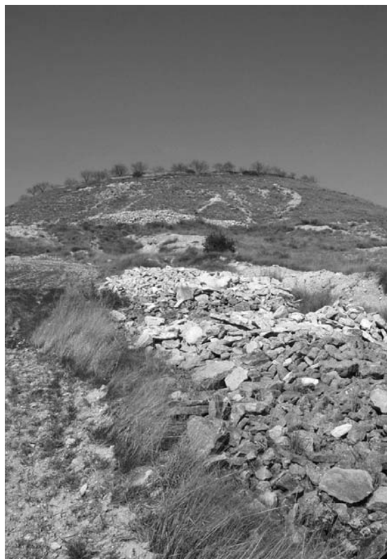
Figura 8. Losas de caliza en las cercanías de la ermita de Santo Domingo (Almudévar).