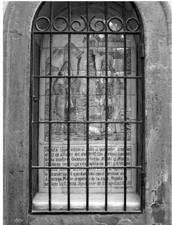
Figura 18. Pozo de Nunilo y Alodia. Calle San Salvador.