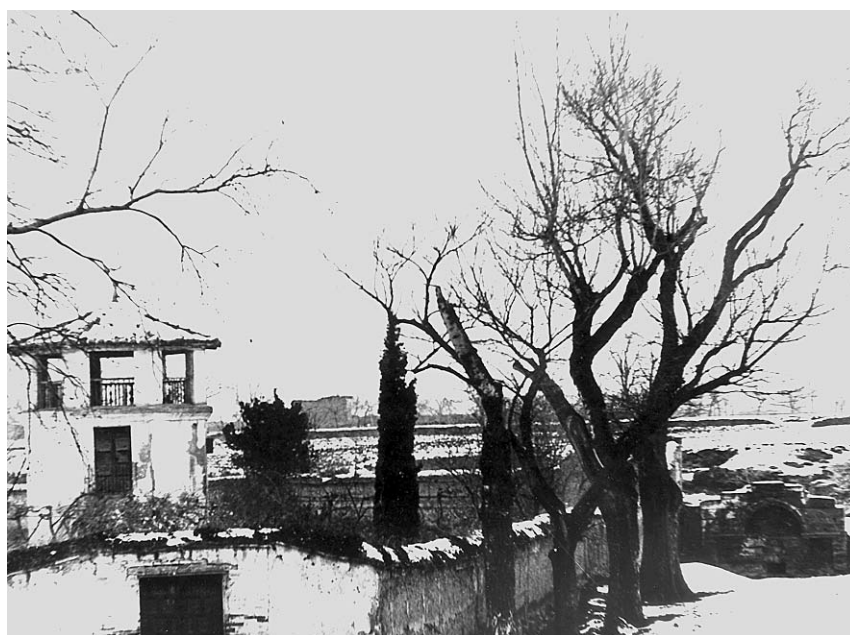
Figura 14. Ubicación de la desaparecida fuente de San Miguel.