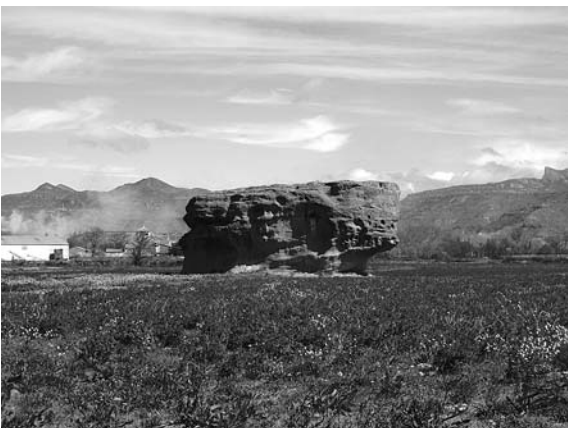
Figura 5. Torre de La Piedra: restos de un paleocanal de areniscas canteado.