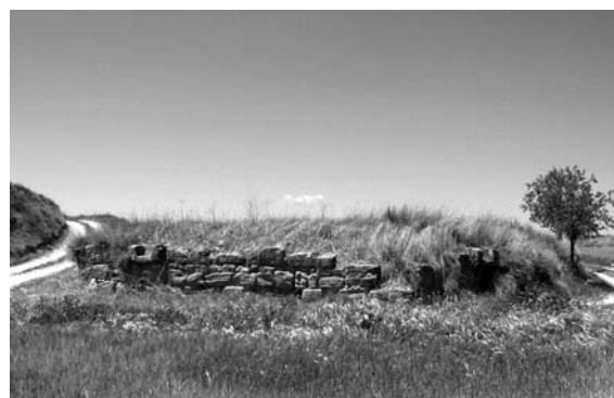
Figura 10. Torre San Clemente: alberca distribuidora de agua.