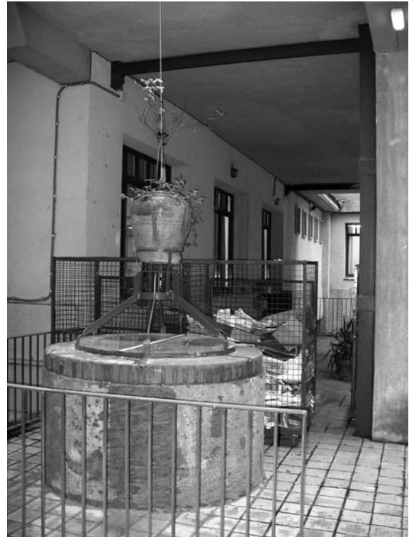
Figura 16. Pozo del antiguo Colegio Universitario.