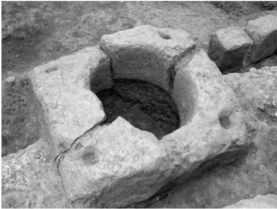
Figura 19. Brocal de época islámica en el solar de la calle Dormer.