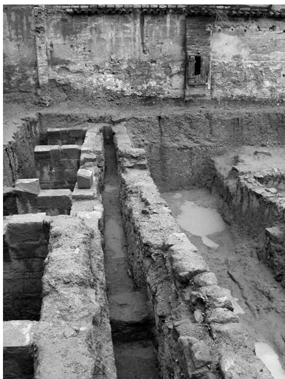
Figura 12. Acequia en solar de Coso Alto, 40. Al fondo, en el muro, un pozo de época incierta.