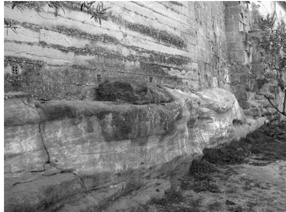
Figura 4. Huesca, transmuro: estratos de arenisca tallados.