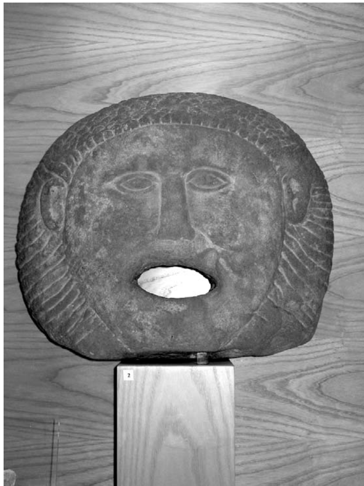
Figura 21. Museo de Huesca: Fuente Iberorromana.