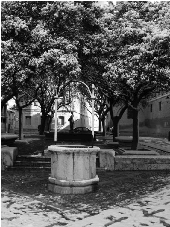
Figura 15. Pozo en la Plaza de Catedral.