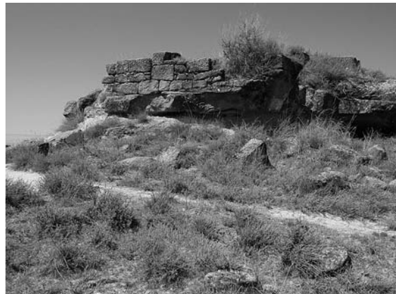
Figura 6. Restos de cantera en la ermita de San Pedro Mártir (Quicena).