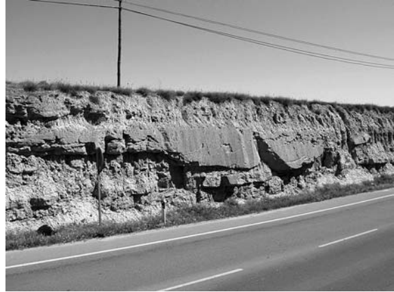
Figura 2. Paleocanal de arenisca en el límite municipal Huesca-Quicena (N-240).