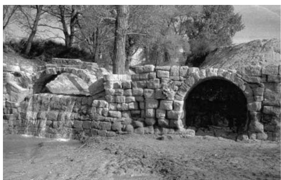
Figura 9. Acueducto romano de Quicena.