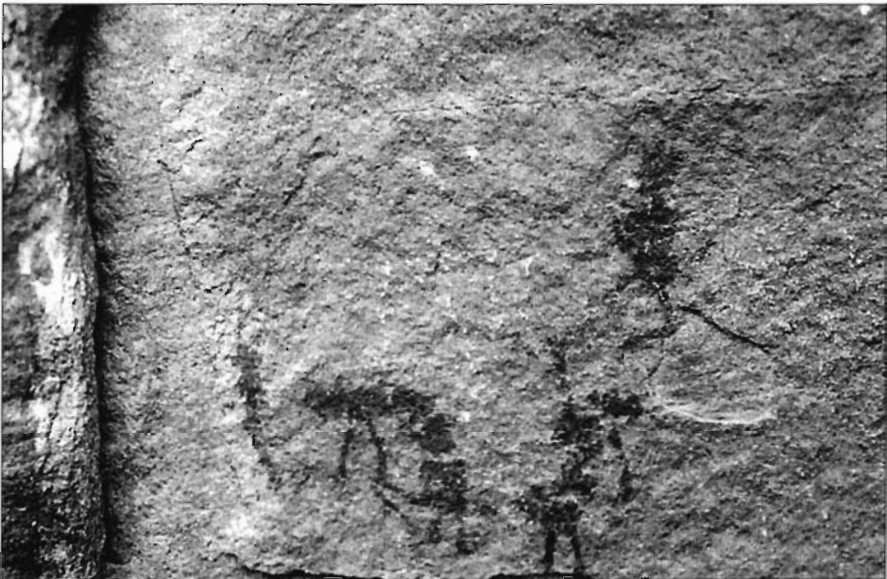
Figura 2. Barranco de Pajarejo (Albarracín, Teruel).

La presencia de los personajes acompañantes de los recolectores y sus ademanes, como si de un ritual u ofrenda al cielo se tratara, otorga a estas composiciones un valor excepcional que supera ampliamente su dimensión etnográfica en sentido estricto. No obstante, debemos reconocer que esta