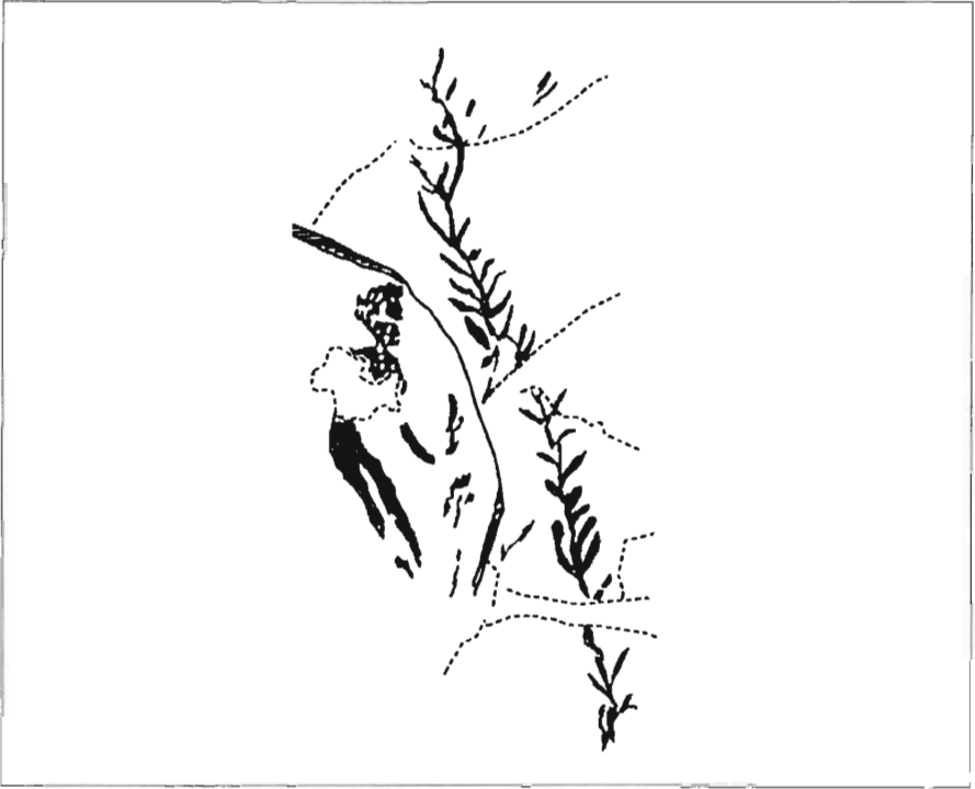
Figura 5. Covacho Ahumado (Alacón, Teruel). Dibujo de A. Beltrán y J. Royo.