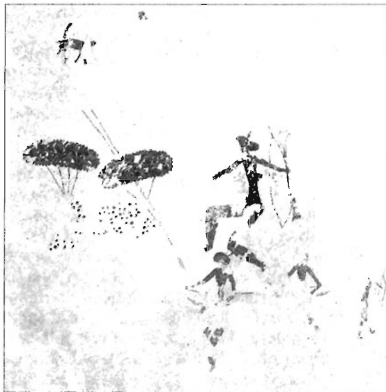
Figura 7. Abrigo de la Sarga I (Alcoy, Alicante). Dibujo de F. Fortea y J. E. Aura.

(Albacete) (Fig. 8). Para algunos autores, a estos conjuntos mencionados habría que anexar la escena que hemos visto en el Abrigo de los Trepadores de Alacón (Teruel) 15 .