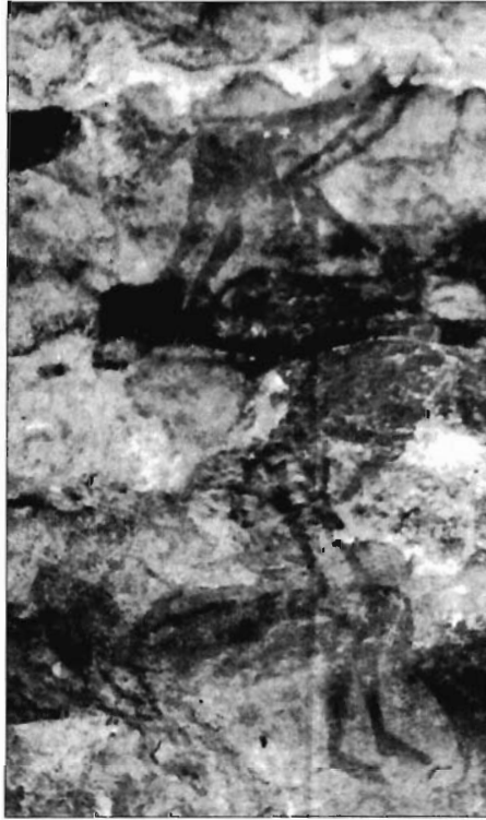
Figura 3. Cueva del Engarbo I (Santiago de la Espada, Jaén).

dimensión trascendental es común al resto de representaciones levantinas, estén o no inmersas en escenas como las que comentamos, o también de caza o guerra, entre otras. En este sentido, el arte levantino no es un simple anecdótico de hechos relevantes de la sociedad que lo creó, sino que todo su contenido está revestido de un profundo simbolismo que lo convierte en una manifestación externa de un mitologuema propio de sociedades de cazadores y recolectores, y de su visión del mundo y su actitud frente a él.