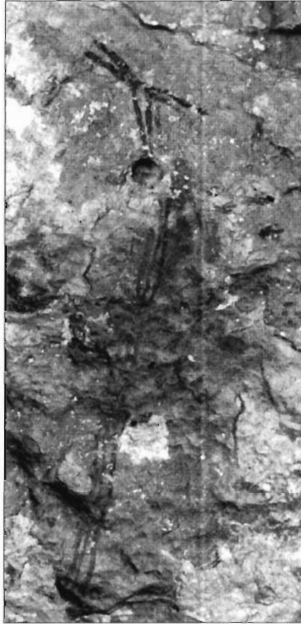
Figura 8. Cueva de la Araña (Bicorp, Valencia).

En alguna ocasión hemos manifestado que el conjunto de temas y escenas que documentamos en los varios centenares de abrigos rocosos levantinos nos muestran la actitud religiosa de sus autores frente al mundo y su pensamiento trascendente 16 , de tal forma que, una escena de caza como la que hemos visto en la Cova dels Cavalls de Castellón, entre otras muchas, trasciende su mero valor etnográfico como ejemplo de la actividad cinegética de sus creadores, para hablarnos de su visión de lo sagrado y de la relación hombre-naturaleza.