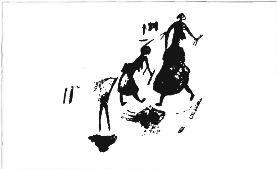
Figura 4. Abrigo del Ciervo (Dos Aguas, Valencia). Dibujo de F. Jordá.

Por los datos que la literatura etnográfica nos proporciona sobre las bandas de cazadores y recolectores sabemos que, aunque la mujer no participa en la cacería de las grandes piezas, su papel en los ámbitos económico y social es destacado. En general, en lo que a las formas de vida económica del grupo se refiere, la mujer se encarga, básicamente, de las labores de recolección de productos vegetales, frutas, tubérculos o raíces, entre otros, así como de la captura ocasional de pequeños animales, aves y roedores sobre todo.