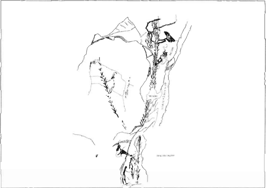
Figura 6. Abrigo de los Trepadores (Alacón, Teruel). Dibujo de A. Beltrán y J. Royo.