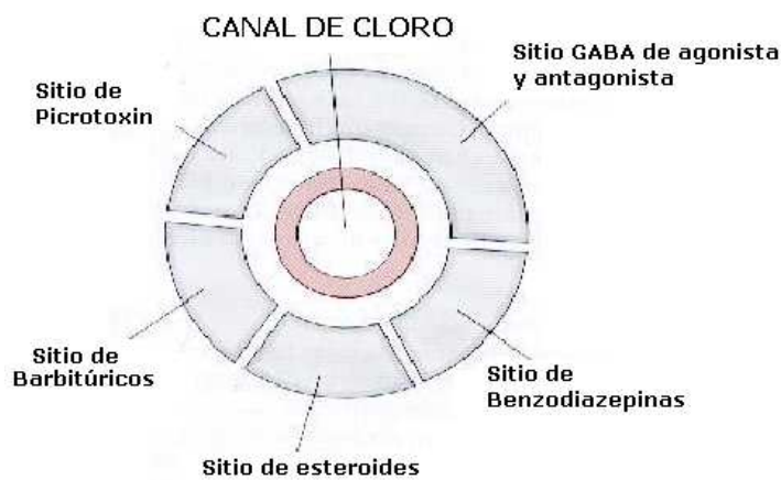
Figura 2: Complejo receptor GABA A

GABA es el principal neurotransmisor inhibitorio del SNC en mamíferos y tiene tres tipos de receptores. El receptor GABA A es un canal de Cl - que sólo permite la entrada de aniones y especies poliatómicas, como formaldehído, acetato y bicarbonato (figura 1); también contiene cuatro familias de subunidades que han sido identificadas y designadas \alpha , \beta , \delta y \gamma . El receptor GABA A presenta una simetría de cinco dobleces sugiriendo una estructura pentamérica, la cual posee varios sitios de modulación farmacológica como se observa en la figura (2). La estructura pentamérica está formada por hélices que revisten