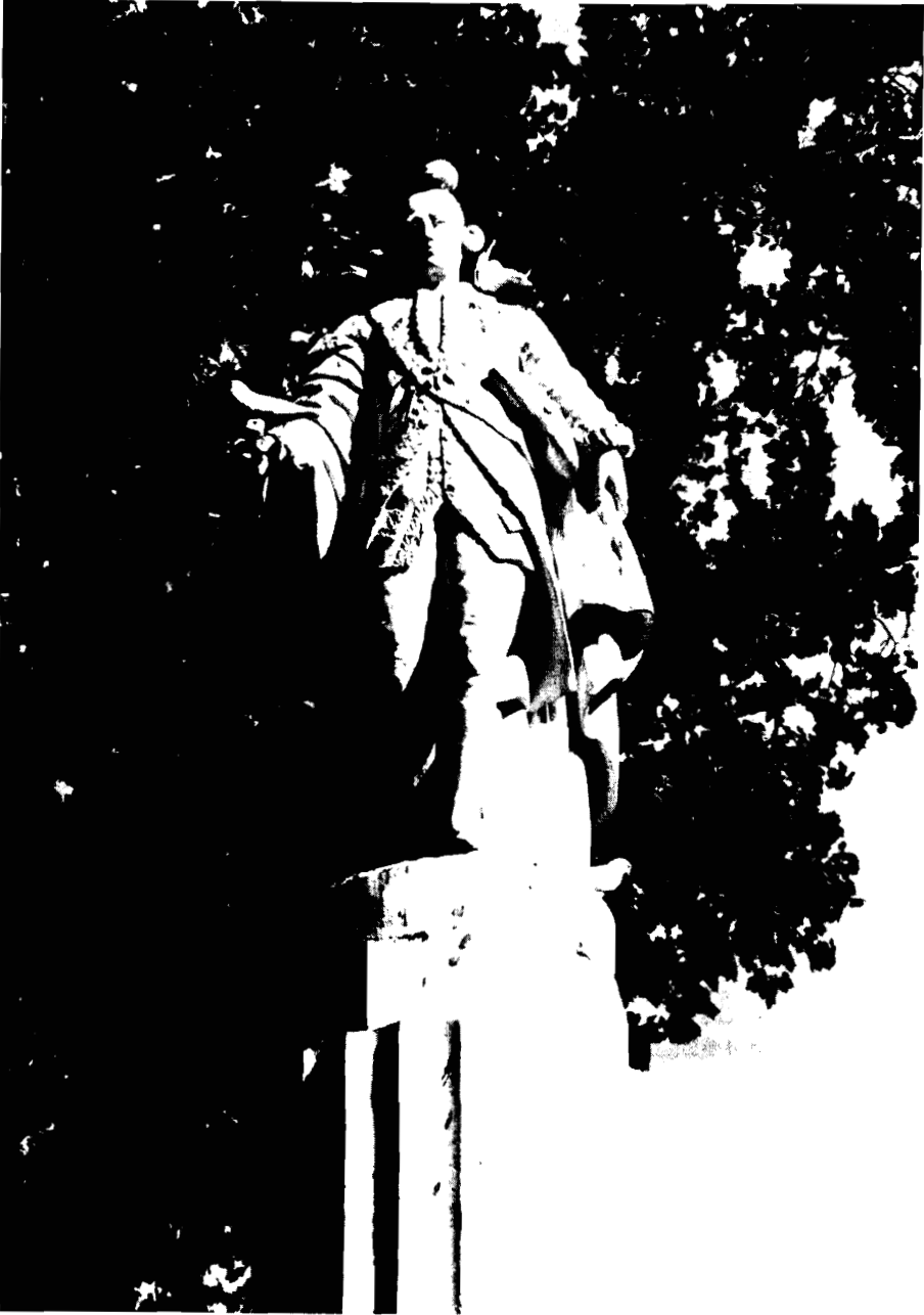
Santiago Baglietto: Estatua del Conde de Floridablanca. Jardín que lleva su nombre. Murcia.