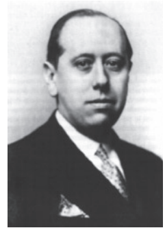
▲ José María Gil Robles y Quiñones. Diputado y jefe nacional de la CEDA.

“Te lo digo con toda claridad, no sólo por ti aún cuando ya sabes cuan grande y cuan sincero es el afecto que te tengo, te lo digo porque con ello quizá vaya a malograrse totalmente una