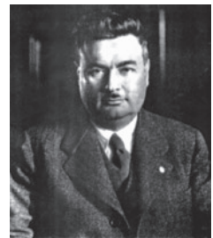
▲ Manuel Giménez Fernández. Diputado y Ministro de Agricultura de la CEDA.