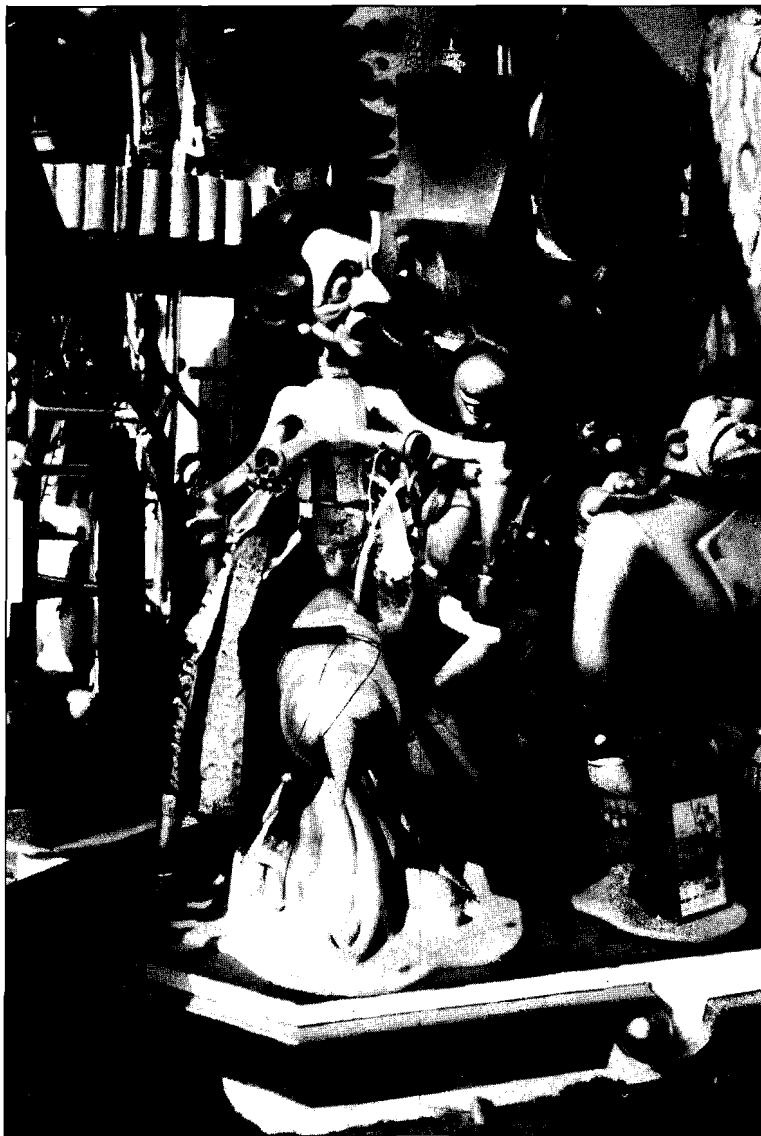
Figura 3. Carolinas Altas . «Apocalipsis». Paco Juan .

Resumiendo, la base se configura con imágenes puestas al servicio de una veloz y fácil percepción que hagan cómoda la toma de postura intelectual y emocional, aportando un mensaje de recepción instantánea, poco complejo, con una expresión de rasgos y gestos claros y revestido de unas formas atrayentes 12 .