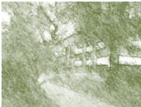
Universidad de Nariño, Colombia.

En Colombia el ingreso oficial de las mujeres a la universidad fue posible a partir del decreto 227 de 1933 (Anexo No.1) expedido durante el gobierno de Enrique Olaya Herrera como resultado de la insistencia y presión que venían desplegando maestras, estudiantes y líderes feministas 3 desde mediados de la década del 20 y que se concretó en el IV Congreso Internacional Femenino realizado en Bogotá en el mes de diciembre de 1930. 4