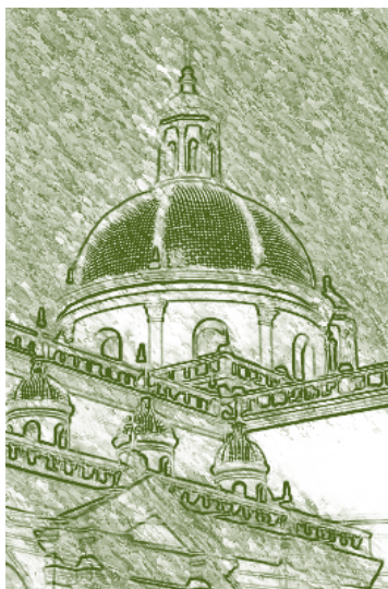
Iglesia de San Felipe en Pasto, Nariño.

A pesar de ser pensada para que fuera ocupada por personas y saberes en el orden de lo masculino, la institución no estableció ningún impedimento para que ingresaran las mujeres, situación va a ser aprovechada por el grupo de jovencitas que decidió realizar algunos estudios en la Universidad.