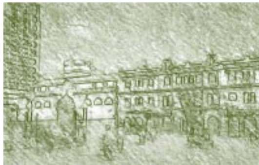
Panorámica de la Ciudad de Pasto, Nariño. Colombia.