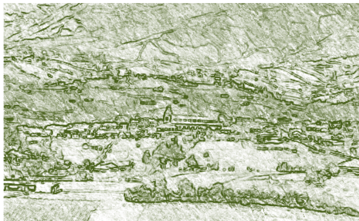
Panorámica de la Ciudad de Pasto, Nariño. Colombia.

De una universidad que en las tres primeras décadas del Siglo se perfilaba como exclusivamente masculina, los sucesos del año de 1935 fueron la compuerta para llegar hoy a una universidad con una fuerte tendencia en su proceso de feminización, por la relación en el ingreso de las mujeres