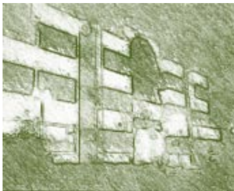
Universidad de Nariño

La universidad y el congreso pasaron a ser los dos espacios que definieron, incluidos los obstáculos que debieron superar, el sentido del movimiento por la equidad de las colombianas en la primera mitad del siglo XX. Pensar en ellos era ir en contra de la tradición que, como muy bien lo definió el estudiante, “Eduquemos a la mujer, pero para el hogar, para el bien de la sociedad.” 9