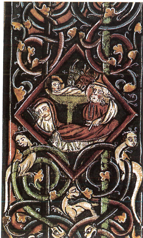
Foto 1. Martirólogo Huelgas. Inicial. Detalle de la inicial "I". Natividad.

En el siglo X en Burgos, dos centros importantes de producción de libros son: San Pedro de Cardeña y Santo Domingo de Silos.