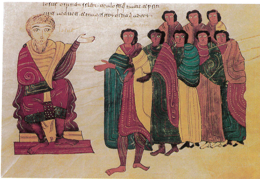
Foto 5. Biblia de León.