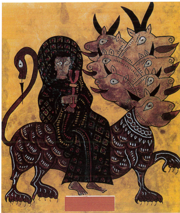
Foto 2. La mujer con la copa sobre la bestia de las siete cabezas.

Cuando preparamos este curso, en el verano del año 2000, fue noticia la recuperación, por el Monasterio de la Vid, del libro N.º 3 de su biblioteca, que contiene aspectos de la orden, privilegios y donaciones de los siglos XII, XIII y XIV.