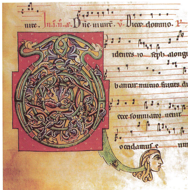
Foto 13. Antifonario. Huelgas.