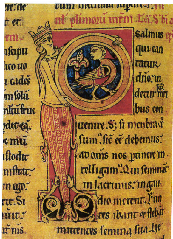
Foto 12. Sirena. Leccionario.

De un color intenso, que parece recién pintado, es el Martirologio de las Huelgas, la profusión decorativa (estilo Chanel) recuerda a la iluminación que se desarrolla en Francia entre los siglos XII y XIII. ¿Cómo llegó este códice aquí?. Aparecen antropomorfos con cuerpo de león o dragón, de ojos expresivos y con una musculatura muy detallada dentro de fondo de vegetales, pequeños dragoncillos y tallos en espiral. (foto 1).