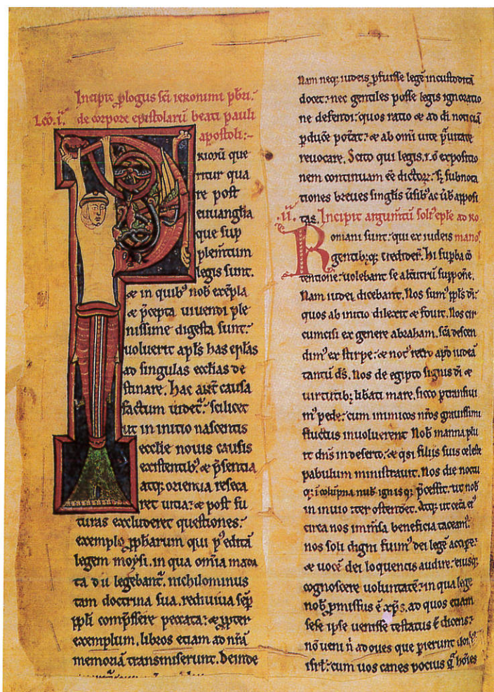
Foto 8. Miniatura de la Biblia de Burgos cosida en otra de Huelgas.

El infierno es un tetralóbulo y en su interior están los diablos y sus atormentados. Fuera está San Miguel. Dentro, el demonio de la izquierda lucha con él y participa en el pesaje de las almas. Su cabellera es llameante y sus patas parecen "garras", es Barrabás. Al lado contrario el demonio Radamás, de pelo rizado. Abajo Beelzebú con cabeza con cuernos. El cuarto demonio es Atimos, de grandes genitales. Una de sus piernas es una pinza de cangrejo que se dirige contra los amantes