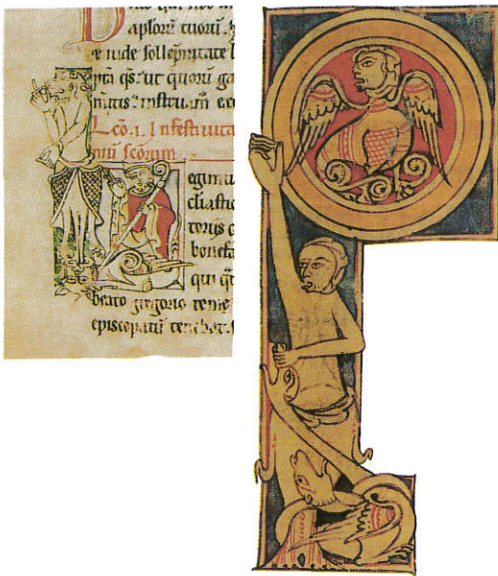
Foto 10. Leccionario. Huelgas.

Las otras miniaturas son grandes iniciales, como la que encontramos cosida en los códices de Las Huelgas. (foto 8).