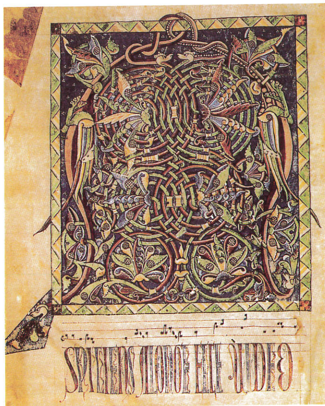
Foto 14. Antifonario. Huelgas.