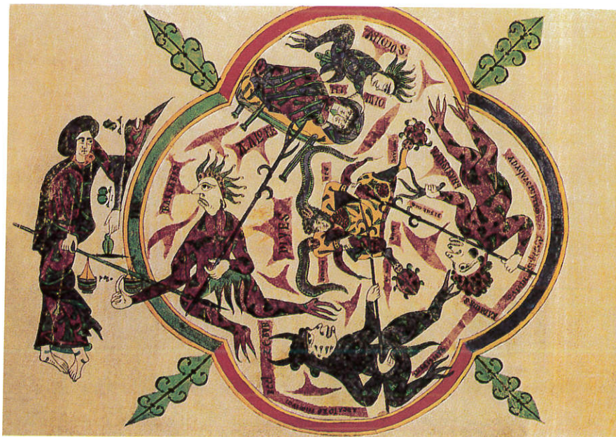
Foto 6. El infierno. Beato de Silos.