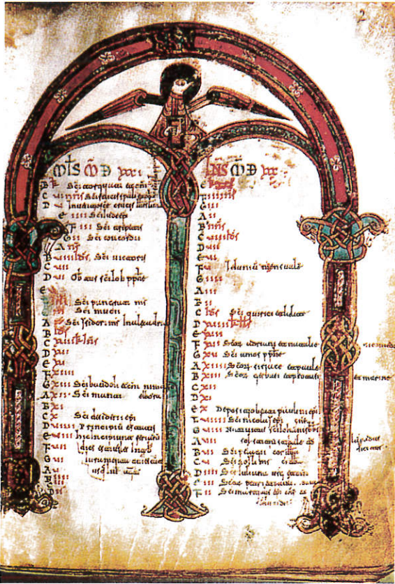
Foto 4. Liber Ordinum. Silos.

de colores fuertes, expresivos ojos y gestos limitados, organizados en bandas horizontales.