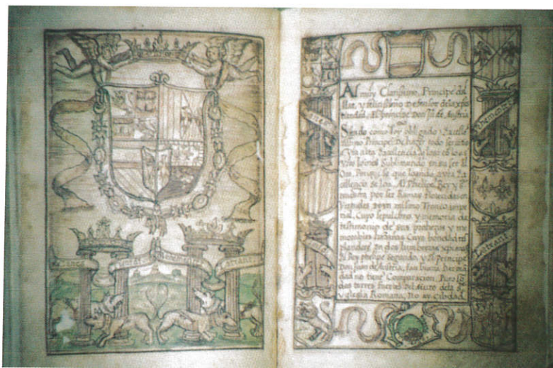
Bestiario de D. Juan de Austria, ca. 1570. (Foto Javier Gil).

el 30 de mayo de 1617, fecha de la primera carta registrada (fol. 1r), al 5 de abril de 1618, fecha de la última (fol. 245r).