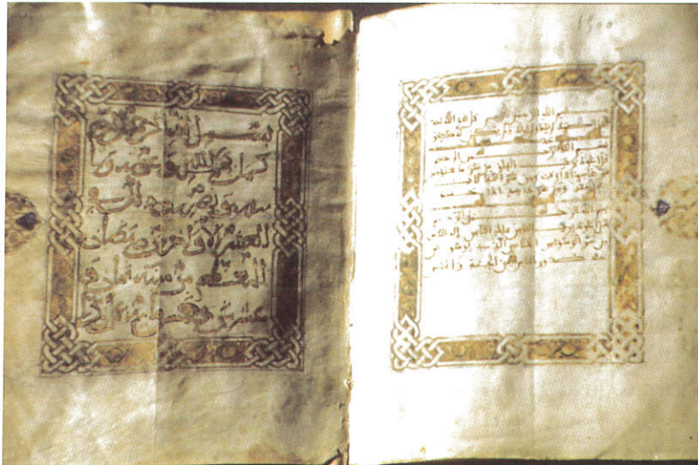
Corán, ms., año 1134.

palmas; en el centro, sobre fondo de rayos, el Espíritu Santo en forma de paloma simboliza la sabiduría divina a la cual está dedicada la biblioteca. Al fondo, presidiendo el conjunto, un lienzo de la Inmaculada flanqueado por pilastras jónicas y rematado por un frontón semicircular. Rodeando el salón se distribuye una rica estantería neoclásica que se adapta a la estructura arquitectónica y se distribuye en dos niveles a los que se accede por medio de cuatro escaleras interiores. Cuando el asombrado visitante da la vuelta para abandonar la biblioteca percibe que el lugar por donde hizo su entrada no se parece en nada al vestíbulo anterior; el frontón semicircular se ha transformado en un vano palladiano sustentado por pilastras jónicas pareadas y adornado con jarrones que se cubre con un arco casi triunfal. Con ello se ha revitalizado el interior en contraste con la sencillez exterior, se ha primado el ámbito privado al que acceden los iniciados a la sabiduría 18 .