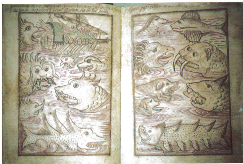
Bestiario de D. Juan de Austria, ca. 1570.