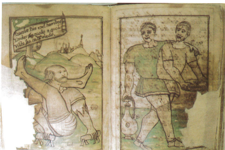
Bestiario de D. Juan de Austria, ca. 1570. (Foto Javier Gil).

Digno de tenerse en cuenta es el magnífico ejemplar de la Chronica troyana de Guido de Columna, (135/ms/2), manuscrito sobre pergamino y papel realizado en torno al año 1.370 40 . El autor escribió su obra en latín y pronto fue traducida a las lenguas romances, convirtiéndose en un auténtico “best seller” de la época. El manuscrito