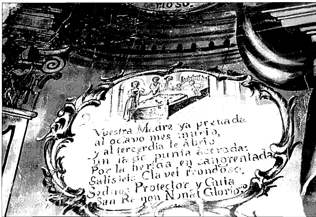
Lám. 2.- Cartela número 2. Nacimiento de S. Ramón.

des 22 . En la actualidad se conservan ocho de las diez cartelas que originariamente componían el retablo, ya que las dos que corresponden con el banco están ocultas por una reciente capa de pintura. En todas ellas aparece un texto que relata el hecho representado y que termina con una petición al Santo 23 , ya que esta composición se cantaba cada día al terminar la novena, pidiéndole al Santo su protección.