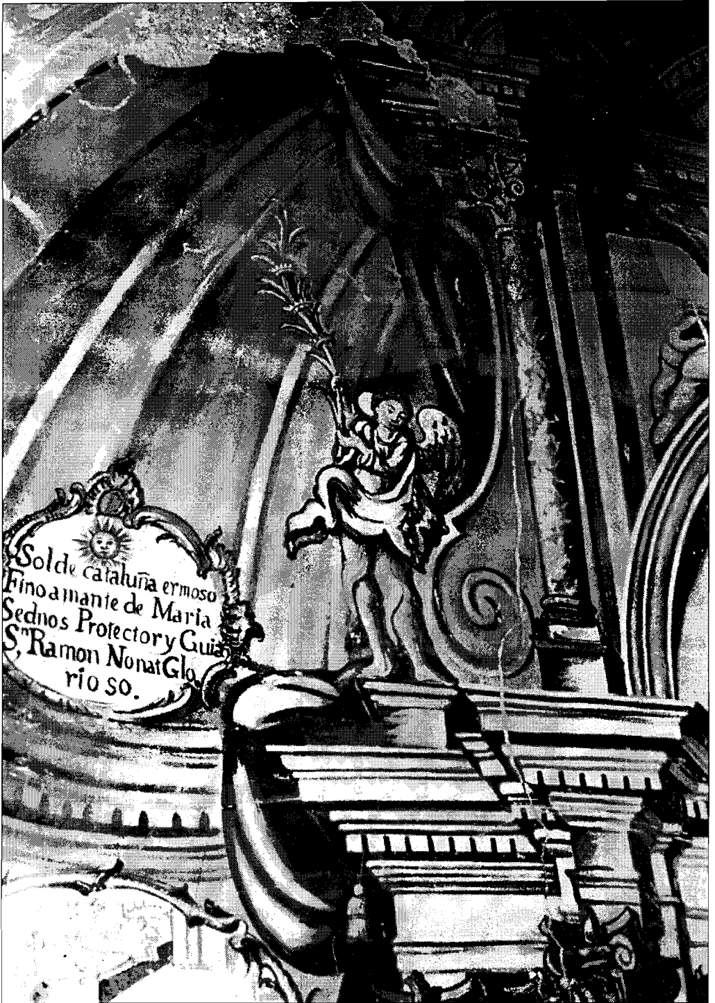
Lam. 4.- Parte superior del retablo.