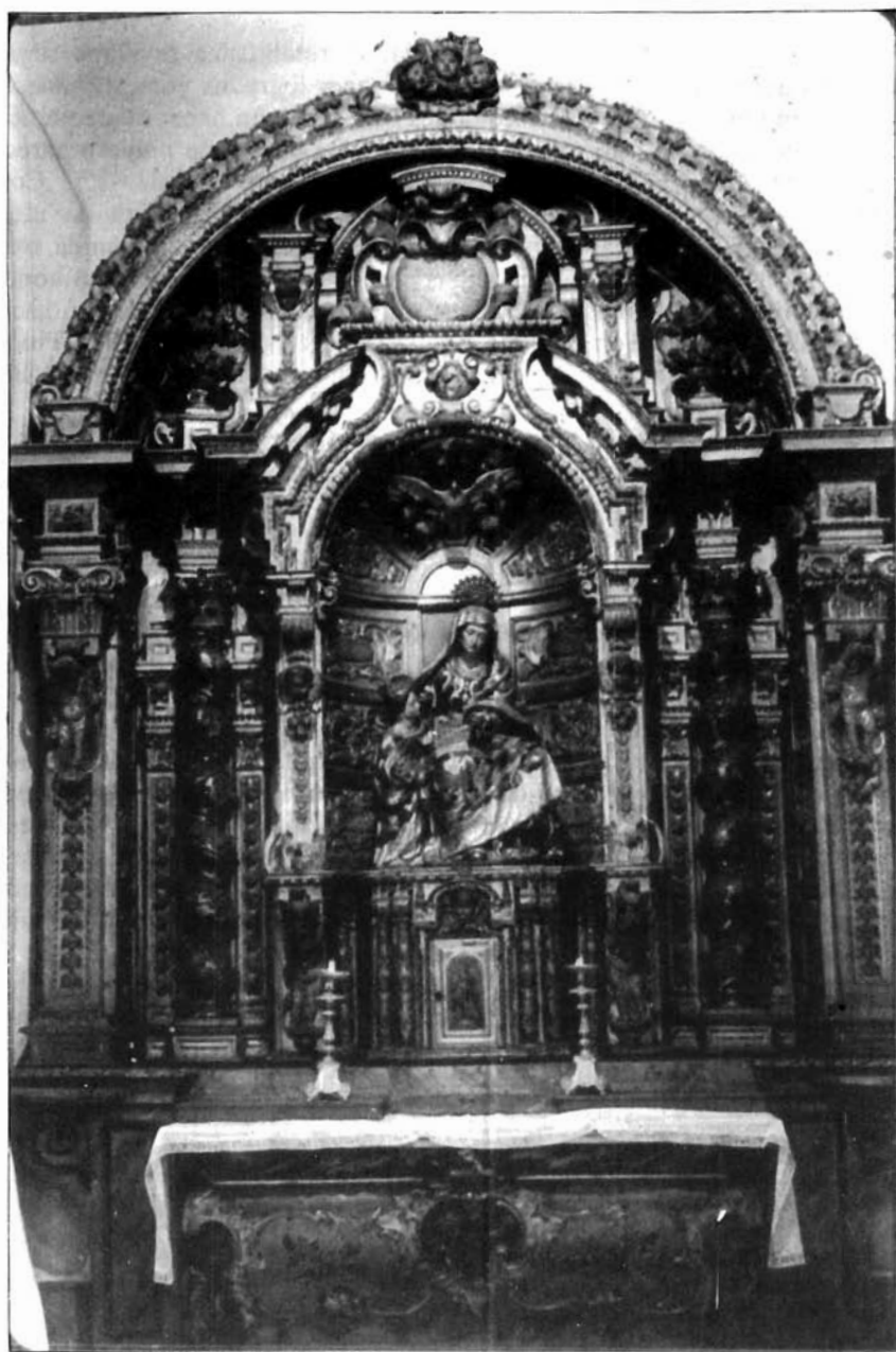
Figura 6. Bernardo Simón de Pineda. Retablo de Santa Ana. (1670). Parroquia de Santa Cruz.