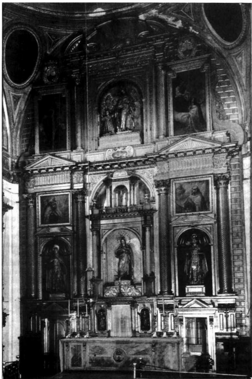
Figura 1. Jerónimo Velázquez, Retablo Mayor, Convento de las Teresas (1630), Sevilla.