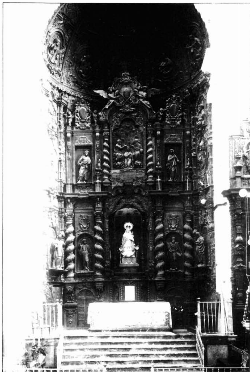
Figura 5. Francisco Dionisio de Ribas. Retablo Mayor. Parroquia de Villamartin (1678). Cádiz.