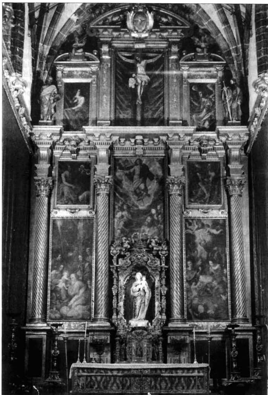
Figura 2. Alonso Cano. Retablo Mayor. Parroquia de Ntra. Sra. de la Oliva (1629) Lebrija (Sevilla).