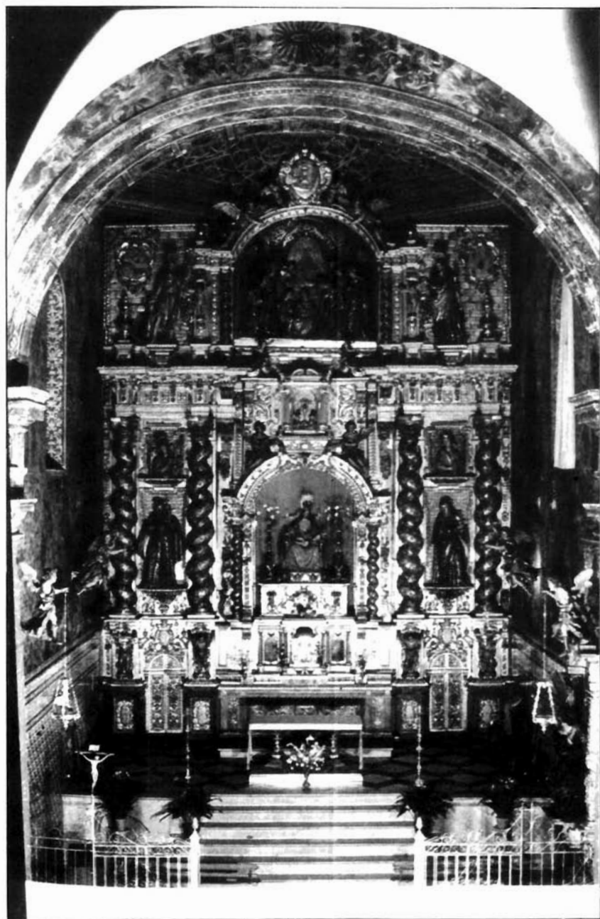
Figura 7. Cristóbal de Guadix-Pedro Roldán. Retablo Mayor. Convento de Santa María de Jesús. (1690). Sevilla.