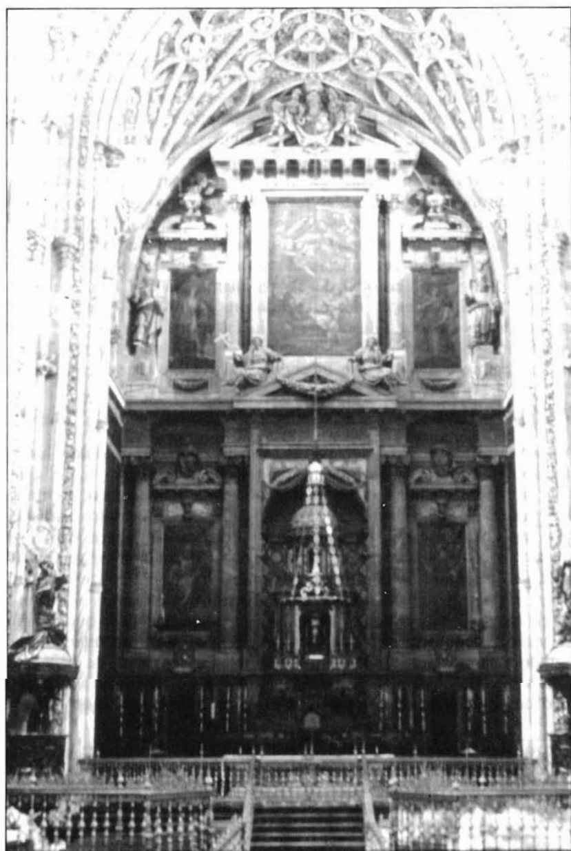
Figura 1. Alonso Matías. Retablo mayor de la Catedral de Córdoba.