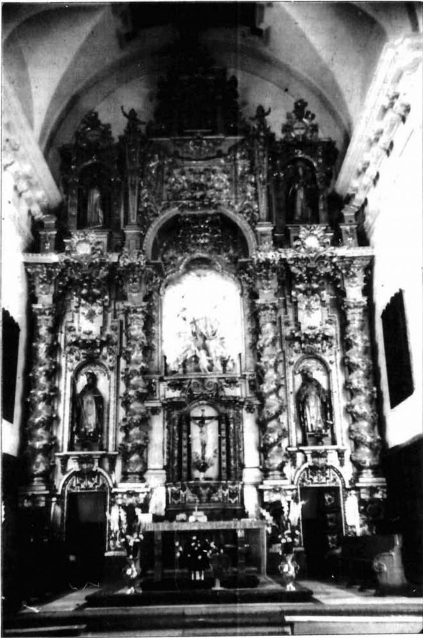
Figura 8. Francisco Hurtado Izquierdo, Jerónimo Sánchez de Rueda y Jerónimo Caballero. Retablo mayor del convento de Santa María de Gracia de Córdoba.