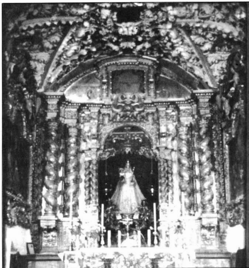
Figura 7. Leonardo Antonio de Castro y Acisclo José Gigante. Retablo mayor de la ermita de Ntra. Sra. de Araceli de Lucena.

mediados de los años cuarenta 28 , aunque su generalización no se dará hasta mediados los años setenta.