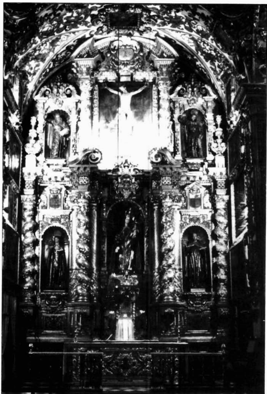
Figura 6. Anónimo. Retablo mayor del convento de San José y San Roque de Aguilar de la Frontera.