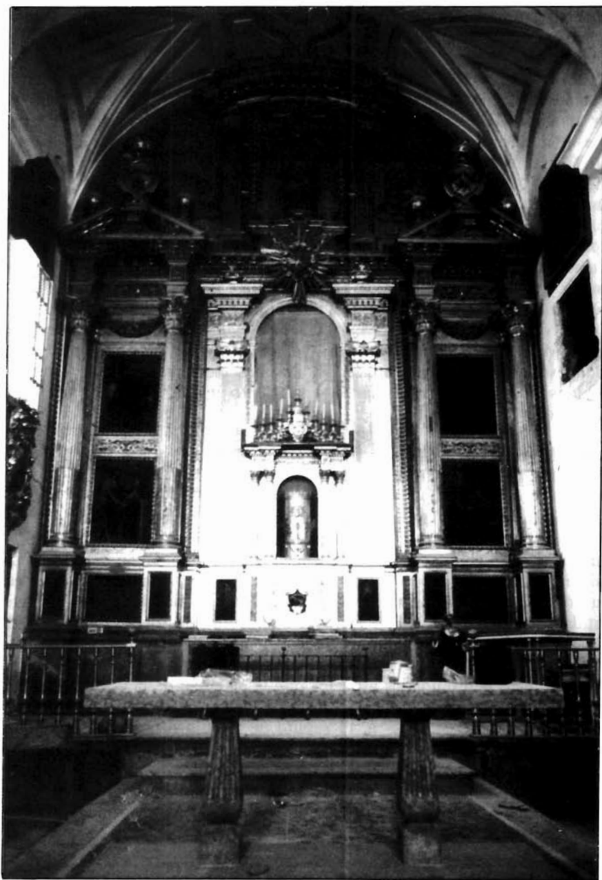
Figura 4. Anónimo. Retablo mayor del convento de San José de Lucena.