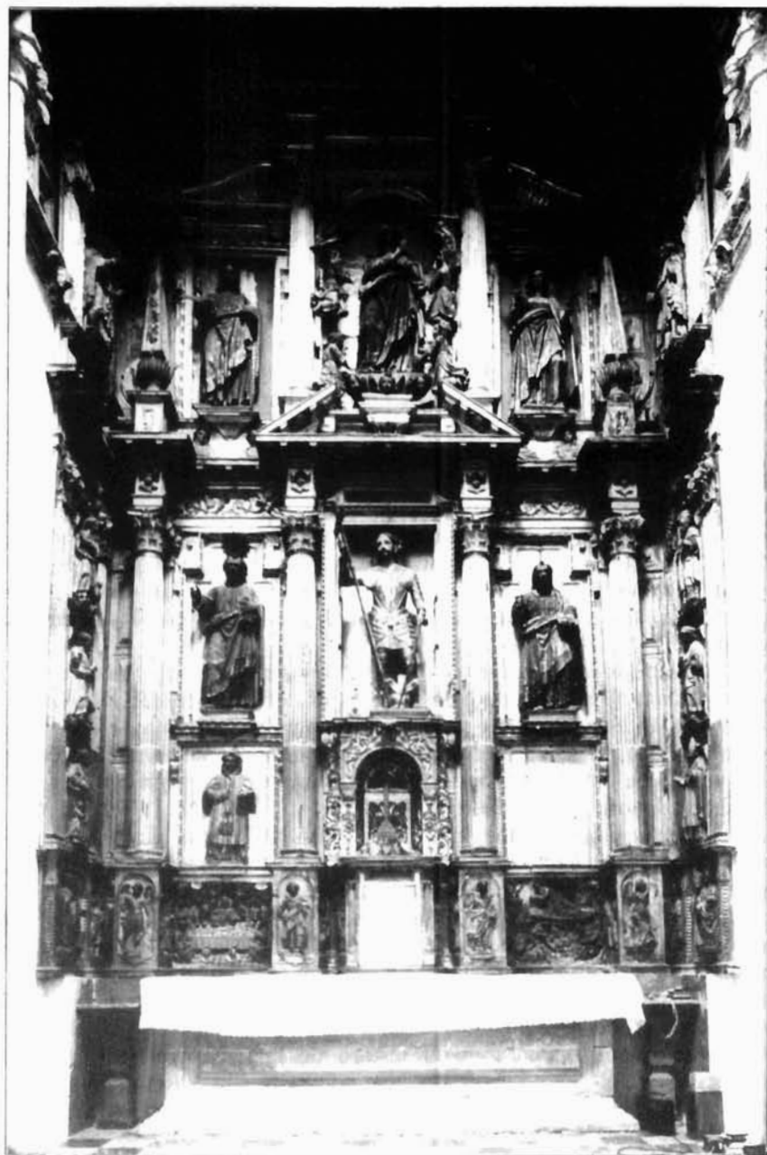
Figura 3. Pedro Freile de Guevara. Retablo mayor de la parroquia de la Asunción de Montemayor.