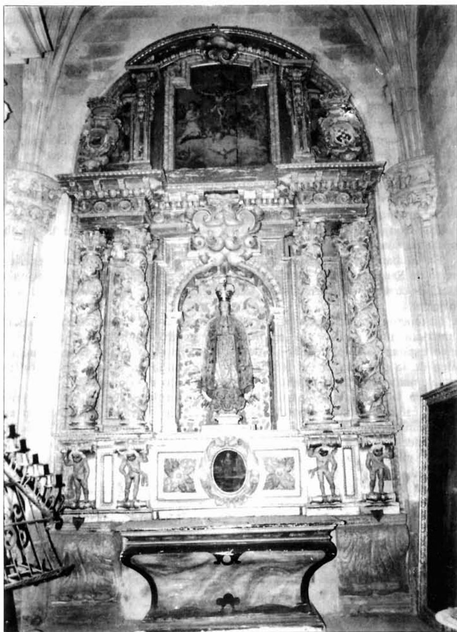
Figura 1. Catedral de León. Retablo de la Inmaculada en la capilla del Conde de Rebolledo, en el claustro.