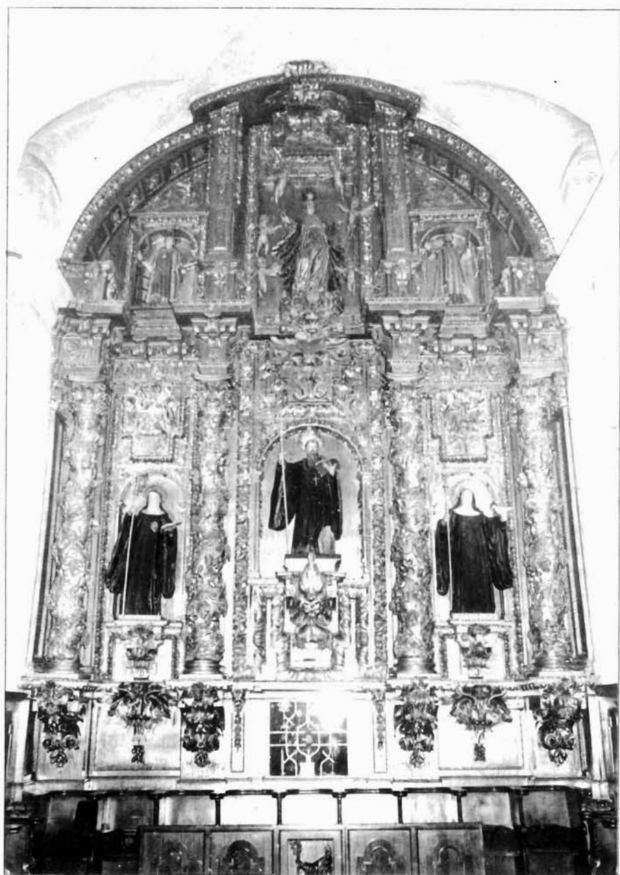
Figura 5. Monasterio de Santa María de Carbajal. Retablo mayor.