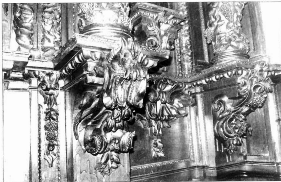
Figura 6. Monasterio de Santa María de Carbajal. Detalles del banco.

guarnicion lo mejor que pudiera dar de si su cornisamento, encima todo bien obrado sigun y como lo pide el arte»; esta preocupación por las luces se hace ya presente en las condiciones del primer cuerpo en la disposición de las columnas: «seis columnas por planta resaltando por la mitad de su colona las dos de adentro; la laida afuera las cuatro de las dos quedando atras, y esto es por razon de las luces de las dos bentanas» 38 .