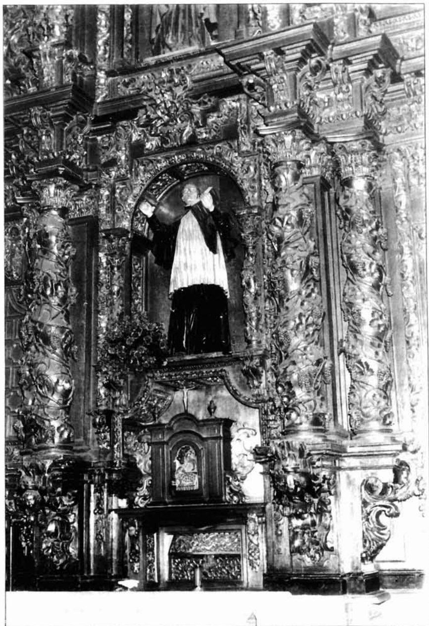
Figura 7. Basilica de San Isidoro. Calle central del retablo de Santo Martino.