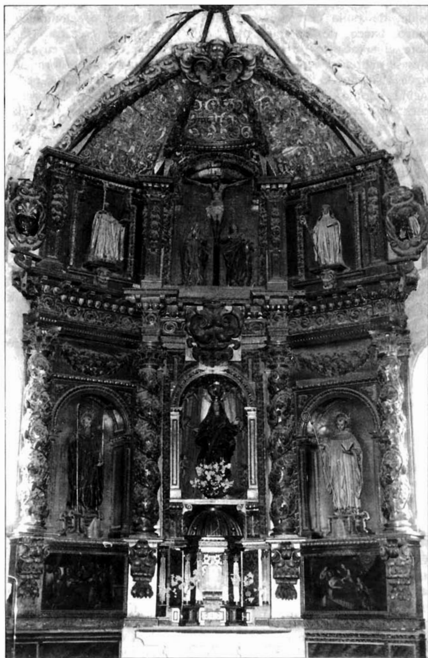
Figura 2. Monasterio de Santa María de Carrizo. Retablo mayor.