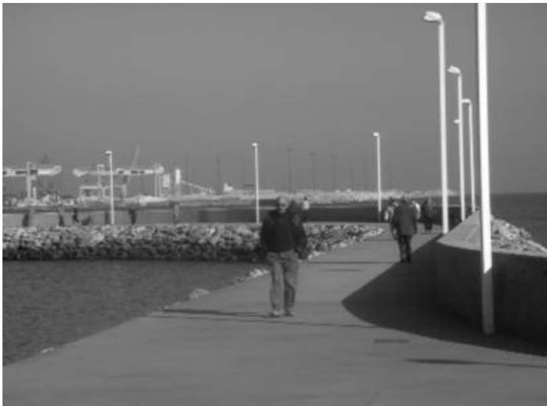
5. Recuperación del litoral en El Arbeyal.

La imagen de la ciudad es mas que la cosmética urbana, pero la incluye; En el renovado de cara están las campañas de arreglo de fachadas, la serie de rehabilitaciones o fachadas de nueva construcción del premio Plomada de plata concedido por la asociación de Promotores ASPROCON desde comienzos de los 90. En la actualidad se perfilan El Plan Especial para la reforma de la fachada del Muro de San Lorenzo y Paseo del Muro , y la propuesta de envolver el estadio del Molinón por parte del artista Joaquín Vaquero Turcios, que son intervenciones artísticas basadas en los efectos visuales de superficies.