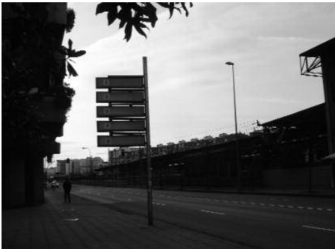
3. Actual situación y división de los barrios occidentales de la ciudad, con la entrada de la autovía Y y el ferrocarril.