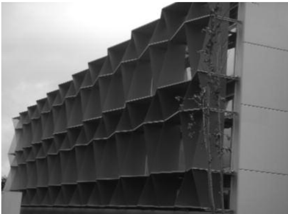
2. Edificio en el parque tecnológico.

barrios, destacan el del Puerto Deportivo (Menendez Moriyón, Nanclares y Ruiz), el PERI del muelle y el PERI de las estaciones.