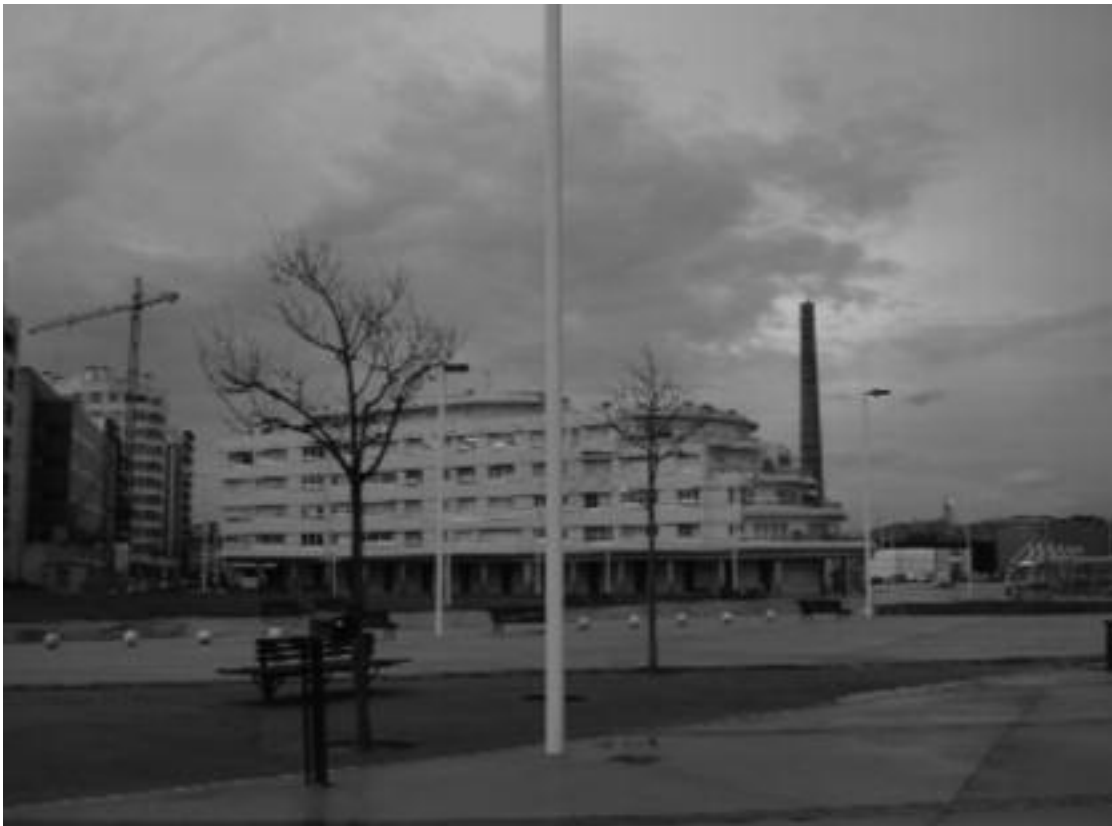
1. Gijón. Nuevas arquitecturas y recuperación de la zona de Poniente.

peraciones de los barrios industriales en los márgenes de la ría del Nervión y un progresivo desarrollo turístico que la fama mundial del arquitecto Ghery y el número de visitantes proporcionaba.