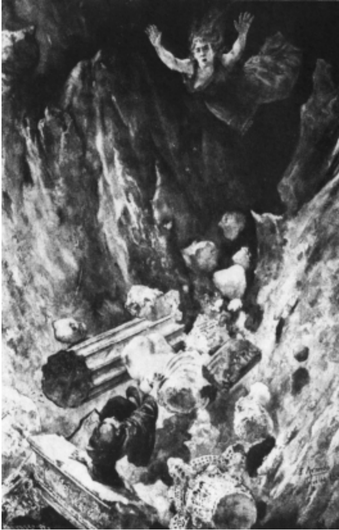
J. Jiménez Aranda. « La visión de fray Martín ». III. (1880)