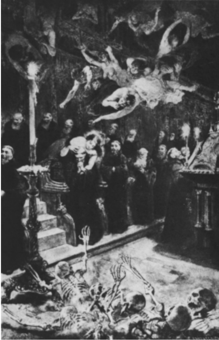
J. Jiménez Aranda. « La visión de fray Martín ». I. (1880)