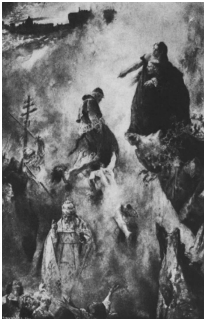
J. Jiménez Aranda. « La visión de fray Martín ». II. (1880)