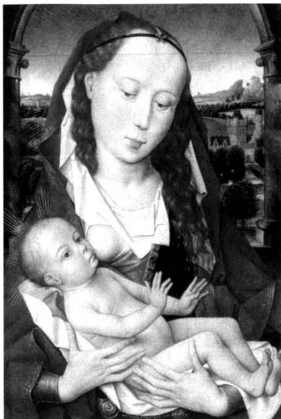
Virgen de la Leche, Hans Memling. Bruselas, Musées Royaux des Beaux-Arts de Belgique.

perante y aún de la complicidad con el mismo por parte de algunas mujeres, y no sólo de antaño. Las mujeres influyentes ejercieron y ejercen “un” poder.