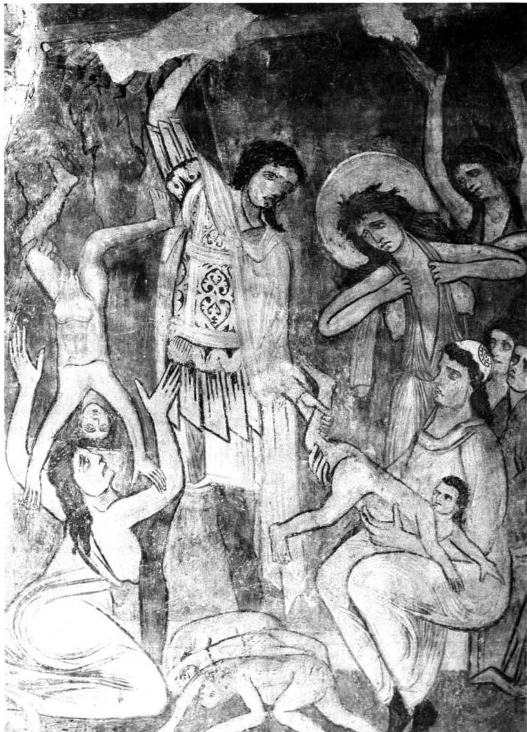
Matanza de los Inocentes, particular. Saboya, Saint Martin de Aime.