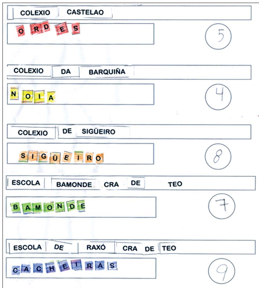
Exemplo de actividades. Mapa para a localización dos lugares dos colexios e escolas. (figura 1) Os alumnos compoñen os nomes con letras móbiles. (figura 2)