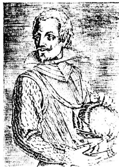
Retrato y firma de Francisco de Villagrà

El 20 de diciembre de 1558 mediante Real Cédula , se nombra Gobernador de Chile al Mariscal Francisco de Villagrà.