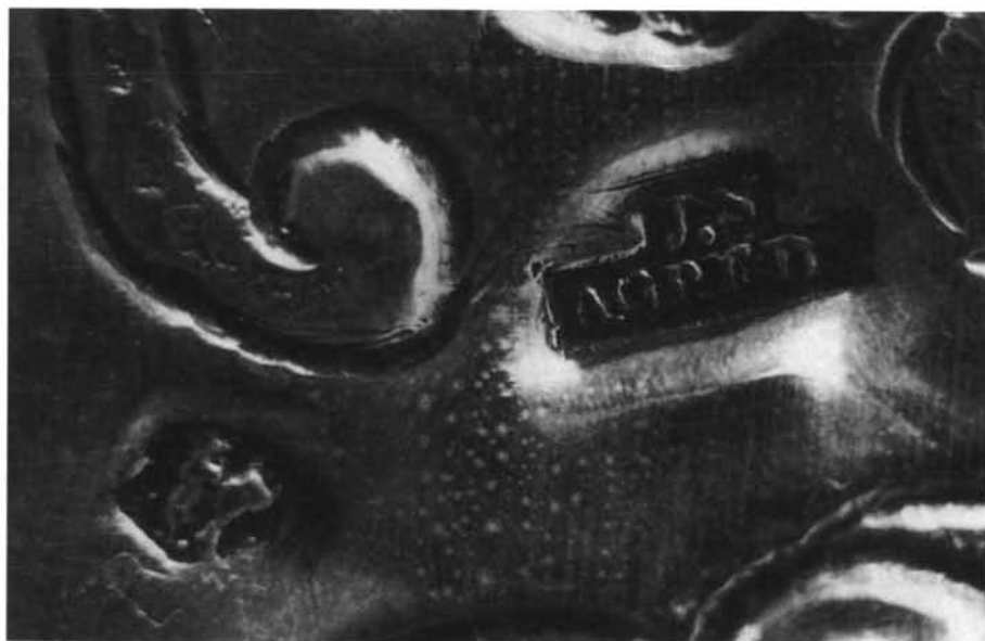
Salamanca. Colección particular. 19 y 20. Bandeja n.º 8 (marcas).