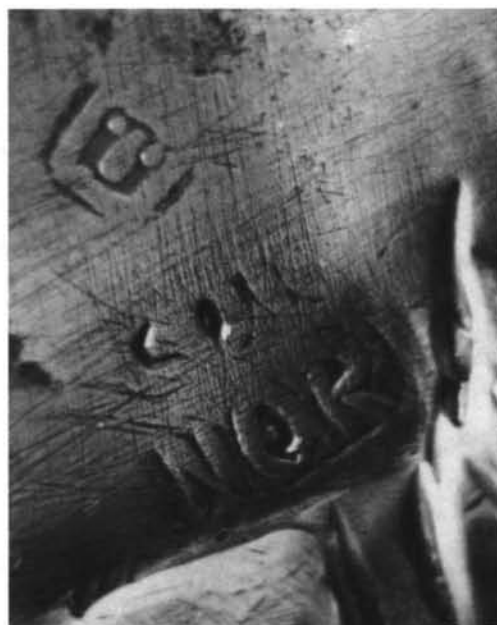
Salamanca. Colección particular. 17. Bandeja n.º 6 (marcas). 18. Bandeja n.º 7 (marcas).