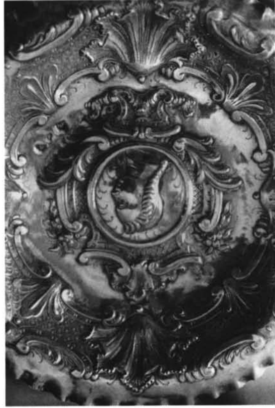
Salamanca. Colección particular. 5. Bandeja n.º 5. 6. Bandeja n.º 6.