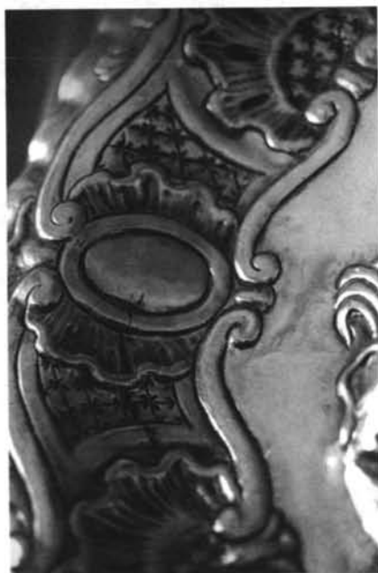
Salamanca. Colección particular. 9. Bandeja n.º 2 (detalle). 10. Bandeja n.º 3 (detalle). 11. Bandeja n.º 4 (detalle). 12. Bandeja n.º 5 (detalle).