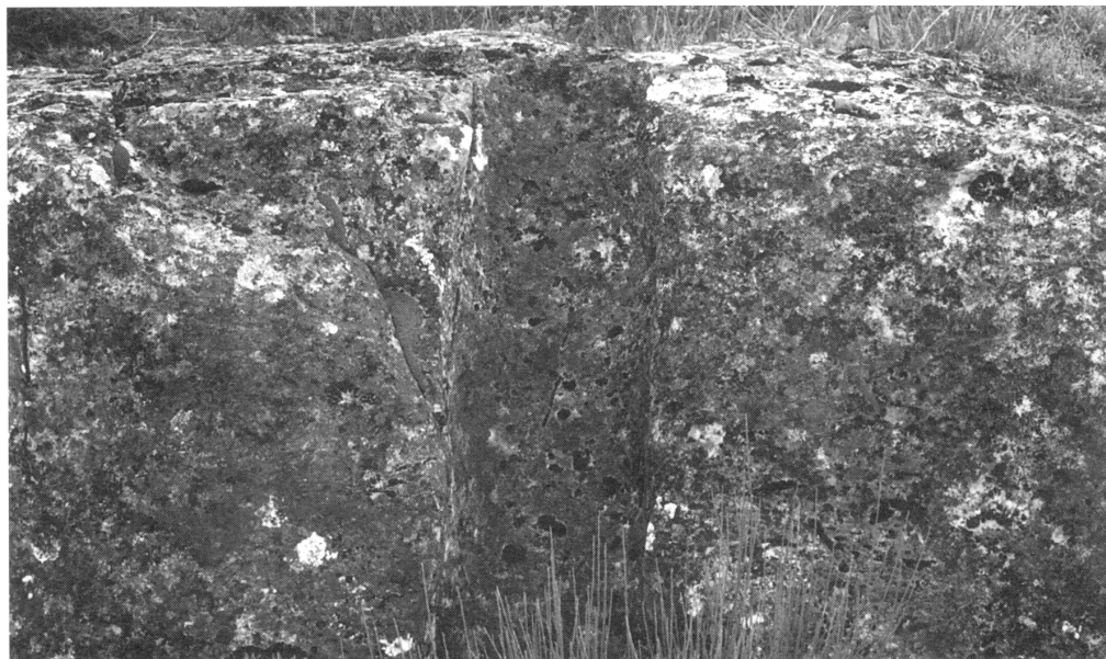
Foto 2. Quicio de la puerta que cerraba el Monte Medulio por el único punto accesible de su flanco septentrional.

Portela de Aguiar, desde la que se divisarían todos los movimientos de los sitiados. Ésta, de Portela, es una fortificación de planta rectangular que se levanta sobre un farallón de caliza y que hasta ahora se venía considerando de origen medieval 23 , únicamente porque es citada en documentos medievales. Sin embargo, han aparecido