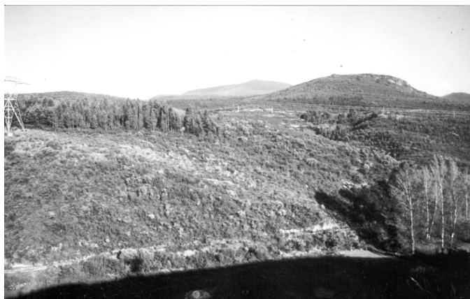
Foto 1. En primer plano, detalle del foso que rodeaba el Monte Medulio, por la zona gallega.

3ª En sus partes más accesibles el Monte Medulio debió de contar con algunas em-