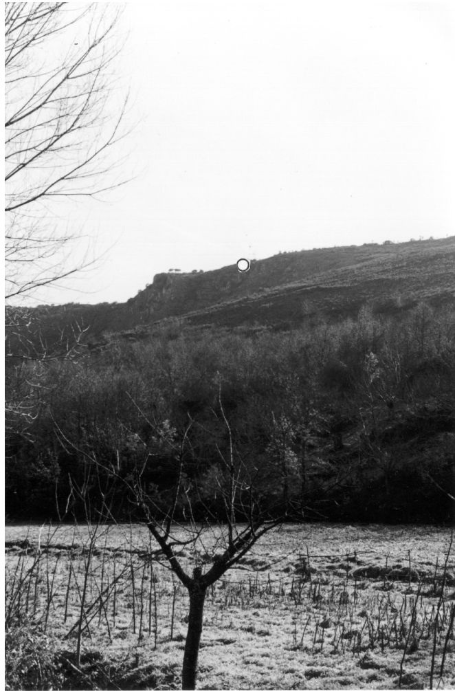
Foto 3.- Vista desde Portela de Aguiar del monte Medulio en la sierra de la Lastra. En el único acceso al monte por el frente septentrional, los astures lo cerraron con una puerta de la que se conservan los quicios horadados en la roca (círculo blanco -o-, situación de la puerta).

La hasta ahora considerada tradicionalmente 25 como la Vía 18, la que se la hacía pasar por Porto Real, Robledo, Oulego, Santo Tirso de Cabarcos, sería la calzada que construyeron los romanos, alrededor