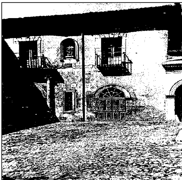
Antiguo Hospital de San Antonio