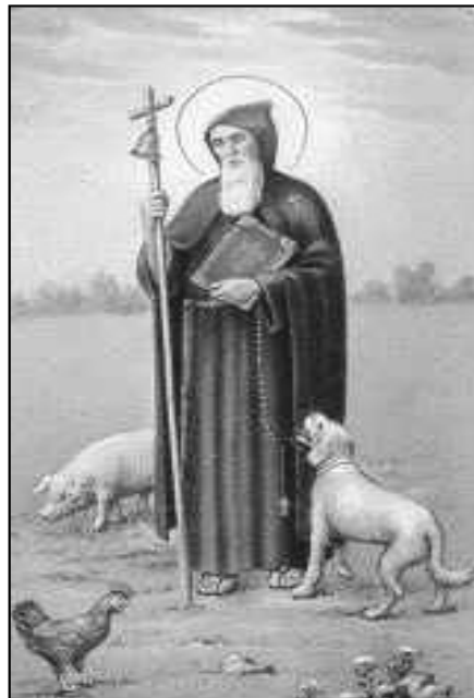
La iconografía representa a san Antonio como un anciano de barba larga y blanca que se apoya en un bastón, en el cual lleva una esquila atada para alejar a los espíritus malignos y con uno o varios cerdos a sus pies

Este hecho hizo que el Santo abandonara su retiro y acudiera en apoyo de éstos, los cuales además de rechazar la violencia, sabían de la necesidad de fomentar las obras sociales para ayudar a los más desfavorecidos, conceptos que chocaban totalmente con la idea imperialista de los romanos. En el año 313, el edicto de Milán promulgado por el emperador Constantino 6 reconocía la religión cristiana al permitir la libertad de culto. Este aperturismo fue tan importante que incluso los emperadores llegarán a bautizarse, aunque no abandonen su paganismo oficial, algo que implicaba el nacimiento de una convivencia y tolerancia entre las dos religio-