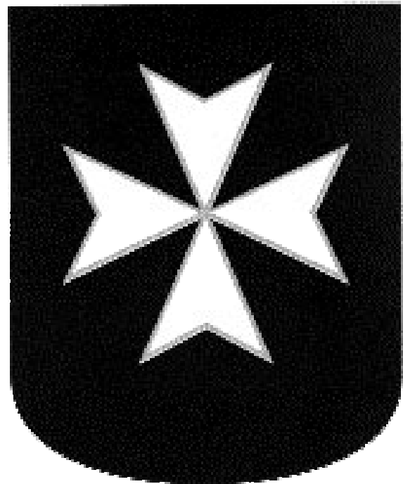
Cruz de la Orden de Malta y de los primitivos Hospitalarios de San Juan de Jerusalén. Su finalidad era piadosa. Muchos cruzados dedicaron su vida en este hospital para atender a los peregrinos y enfermos. Esta insignia fue aprobada por el Papa Inocencio II en el año 1130