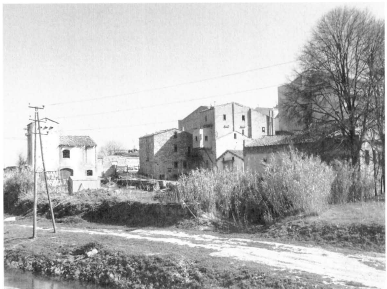
Vista dels actuals Molinets, al peu de l'Ondara al seu pas pel nucli urbà de Tàrraga. El complex conserva un mur i una volta medievals, així com elements constructius i de tecnologia del segle XIX i de tombants del XX. Així mateix, el valor paisatgístic del conjunt, envoltat de grans arbres i de vegetació de ribera, és molt gran. (Fotografia: Oriol Saula).

Com hem vist anteriorment, els arxius formen part del que nosaltres entenem per patrimoni industrial. Des de la convicció de que es poden trobar fonts documentals inèdites, proposem l'elaboració d'un índex dels arxius industrials que es conservin a la ciutat. Aquesta idea es pot considerar com un primer pas per, en un futur, plantejar la ubicació d'aquestes fonts documentals en un espai comú. L'objectiu final es crear les condicions que facilitin l'estudi de la industrialització a Tàrraga. En aquest sentit, cal dir que l'Arxiu Comarcal de Tàrraga té ja en dipòsit l'arxiu de l'antiga fàbrica d'adob i de curtit de pells cedit recentment per la Sra. Rosa M a Trepat, el qual conté informació des de finals del segle XIX.