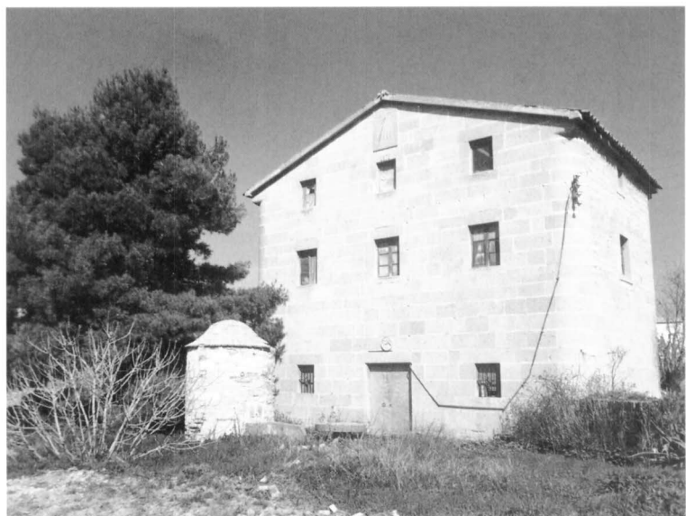
Vista del molí fariner del Verní, situat entre el riu Ondara i les indústries Pont, al peu de l'antiga carretera N-II. Destaca la façana, construïda a base de carreus treballats i amb les obertures disposades simètricament. El fet que a la llinda hi figuri l'any 1875 fa pensar en la possibilitat que existís una construcció anterior que fos arrasada per la robinada de Santa Tecla, ocorreguda un any abans.

També està per fer una valoració sospesada del que va representar aquesta indústria en la història de Tàrraga del segle XX. De moment ja es pot suposar que des del punt de vista social jugà un clar paper transformador. Els homes que hi van treballar durant la seva història (només hi va treballar una dona) van adquirir noves experiències en diferents àmbits: coneixements tècnics, organització del treball, relacions amb els altres obrers, etc. Indubtablement l'aparició de la fàbrica Trepat és el símbol de la gran vitalitat targarina de les tres primeres dècades del present segle, i llur exemple palmari en el camp de la indústria. Imatges relacionades amb la fàbrica, com el so de la seva sirena, o les cues de treballadors vorejant la carretera que hi anaven o en tornaven, formen part de l'imaginari col·lectiu de molts targarins i són ja un senyal d'identitat ciutadà.