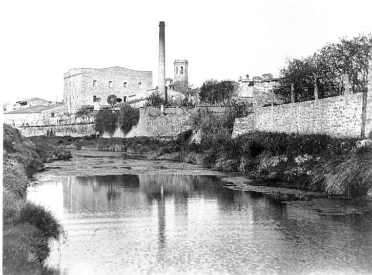
La farinera Vella des de l'Est, en una fotografia dels anys cinquanta. Desapareguda en l'actualitat, l'entrada principal donava a l'actual carrer Joan Maragall. El contrast de l'alta xemeneia amb el campanar al fons, així com l'aspecte del riu Ondara, proporcionen una imatge insòlita de la ciutat.

Quan parlem de patrimoni industrial, però, no ens referim exclusivament als edificis de valor arquitectònic; una fàbrica de factura constructiva vulgar pot tenir un elevat interès des del punt de vista de la història de la industrialització, sigui contemplada aquesta com un fenomen econòmic o social. De la mateixa manera, tant o més importants són les restes de tecnologia d'altres èpoques, així com la informació continguda en els arxius empresarials, aspectes dels quals passem a parlar-ne en el següent apartat.