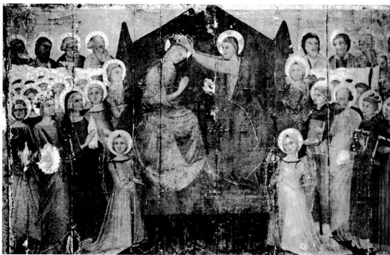
Taula de la coronació de la Verge Maria (segle XV).

Les dades considerades ens permeten parlar de la celebració de la festa a la població en el segle XV, així com de la introducció d'una imatge processional de l'Assumpta i la construcció del bastiment i el lit per a la pre-