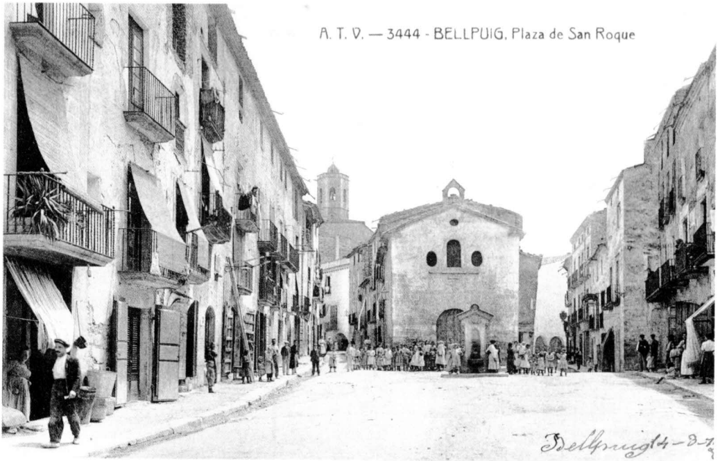
BELLPUIG, Plaza de San Roque