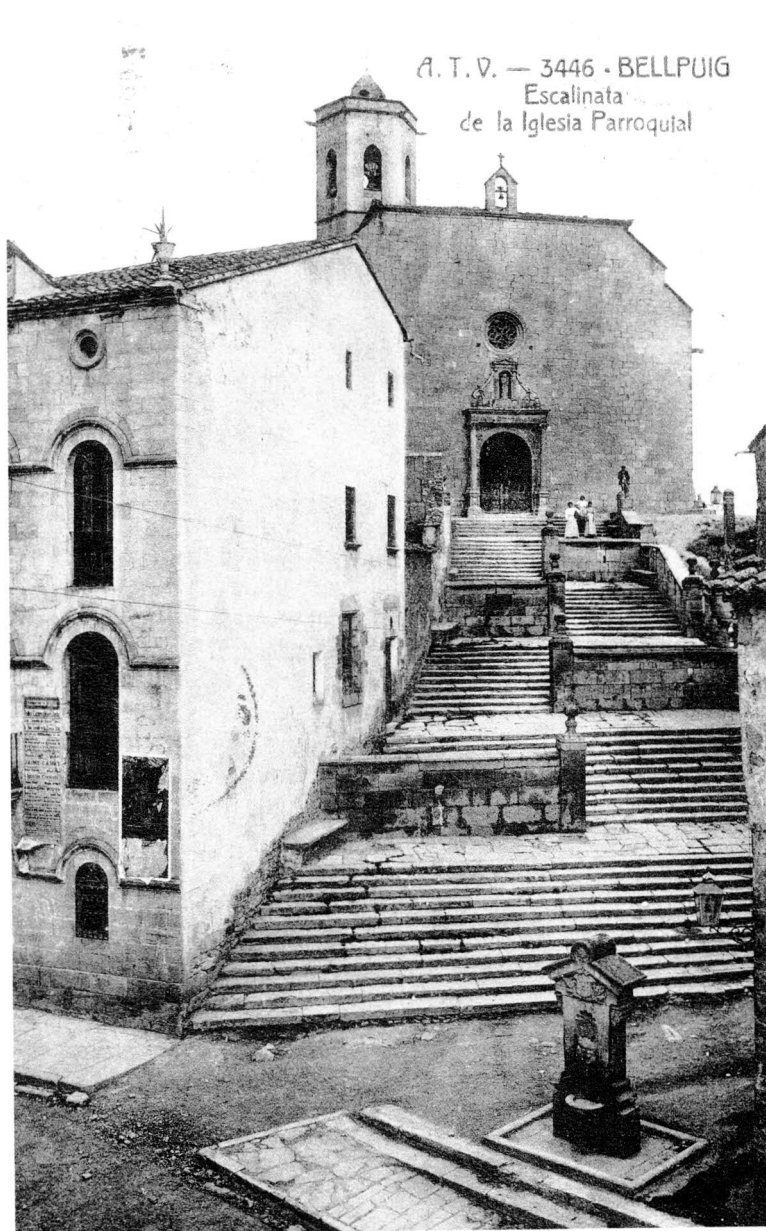
Escalinata de l'església, i la nova església del segle XVI, dedicada a Sant Nicolau i a la Verge Maria Assumpta (tarja postal d'Angel Toldrà Viazo).

potser no hi duien la imatge de la Verge amb el llit. A partir d'aquell any, doncs, la processó de l'enterrament seria força més lluïda i realista.