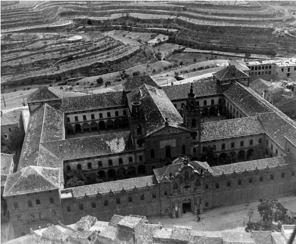
La Universitat de Cervera (anys 30).