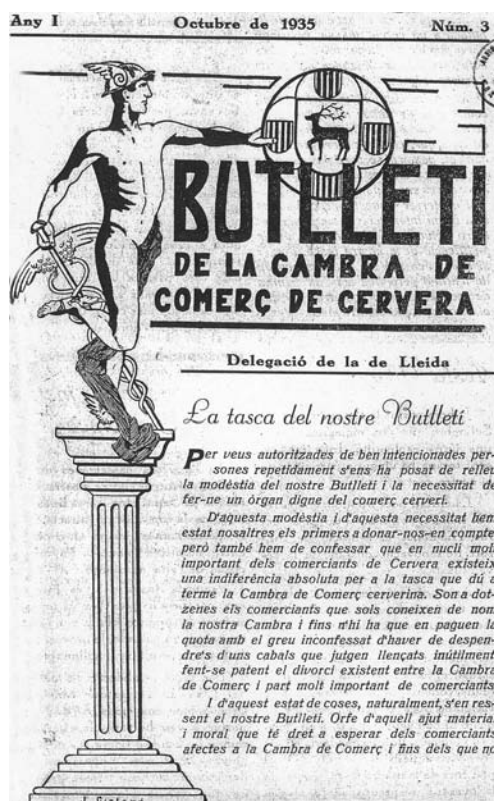
Capçalera del Butlletí de la Cambra de Comerç de Cervera (octubre de 1935).

Perquè em rebutges donzella? Potser penses amb tristesa que si et vull és per ser bella?