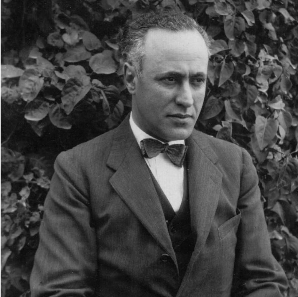
Retrat de l'historiador cerverí Agustí Duran i Sanpere . Arxiu fotogràfic del Museu Comarcal de Cervera.

materialitzarà durant els anys de la Segona República. El replegament de l'acció política que comportà la dictadura no impedí que la vida pública es concentrés en una major activitat cultural. A partir dels anys 20, doncs, apareix una generació d'intel·lectuals i escriptors molt actius, capaços d'articular un seguit de propostes innovadores i de força qualitat i de crear infraestructures literàries que fan possible la revitalització de la cultura local. Lleida i el seu territori s'integraven amb personalitat en el corrent general de la cultura catalana i la capital esdevenia, en diverses ocasions, punt de referència per a tot el país. A prop dels artífexs lleidatans que impulsaven la transformació moderna de la vida cultural de les comarques de Ponent, superant el localisme més encarcerat, hi destacava la generació d'homenots com Sebastià Armenter, Antoni Ollé, Domènec Carrové o Josep Saurer a Balaguer, de Jaume Bosch Barrera a Artesa de Segre, de Josep Güell, Antoni Bonastre o Ramon Novell a Tàrraga, de Ramon Arqués Arrufat, Pere Mias o Ramon de Dalmau i d'Olivart (marquès d'Olivart) a les Borges Blanques, de Ramon Saladrigues o Valeri Serra i Boldú a Bellpuig, de Joan Duch,