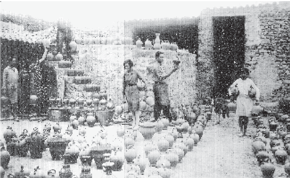
Cantirers de Verdú a començament de segle.