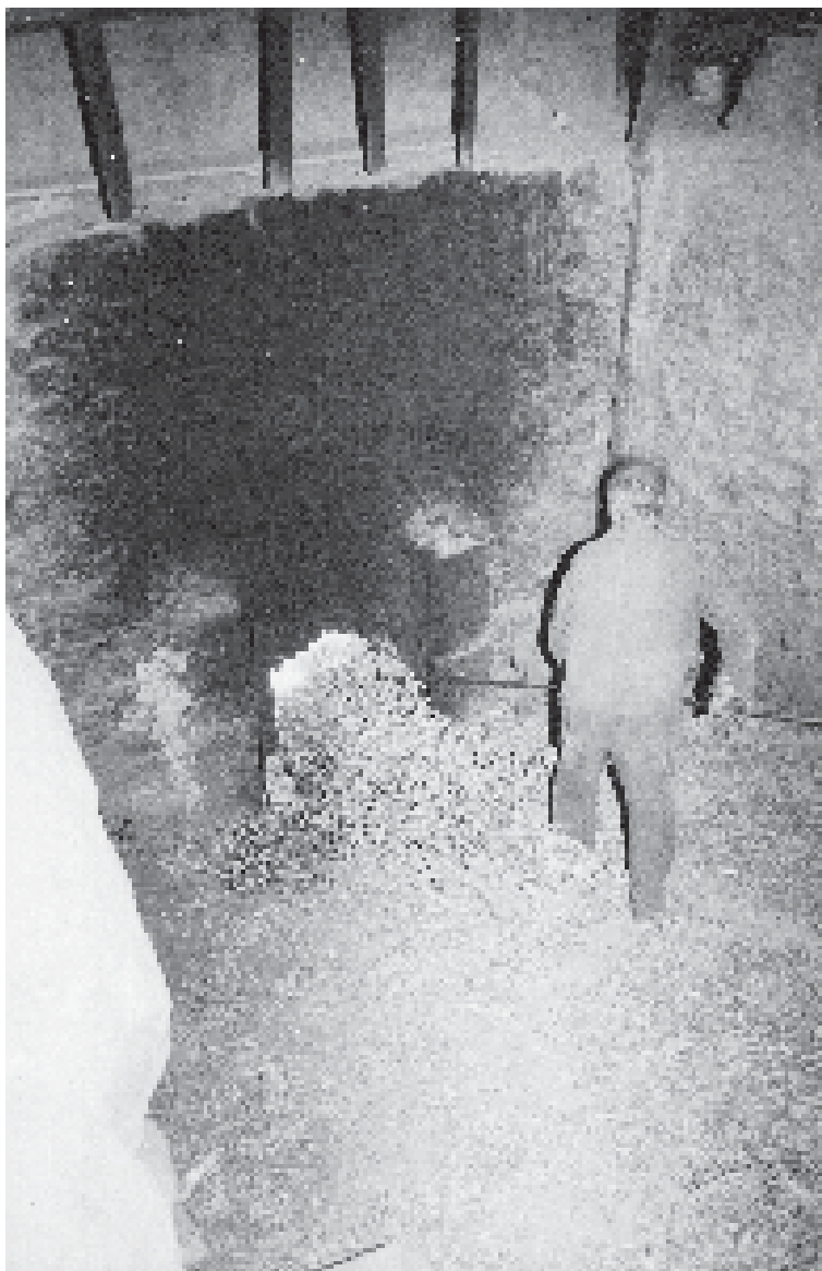
Sillons abans de ser carregats al forn de Josep Font de Verdú per la seva cocció.