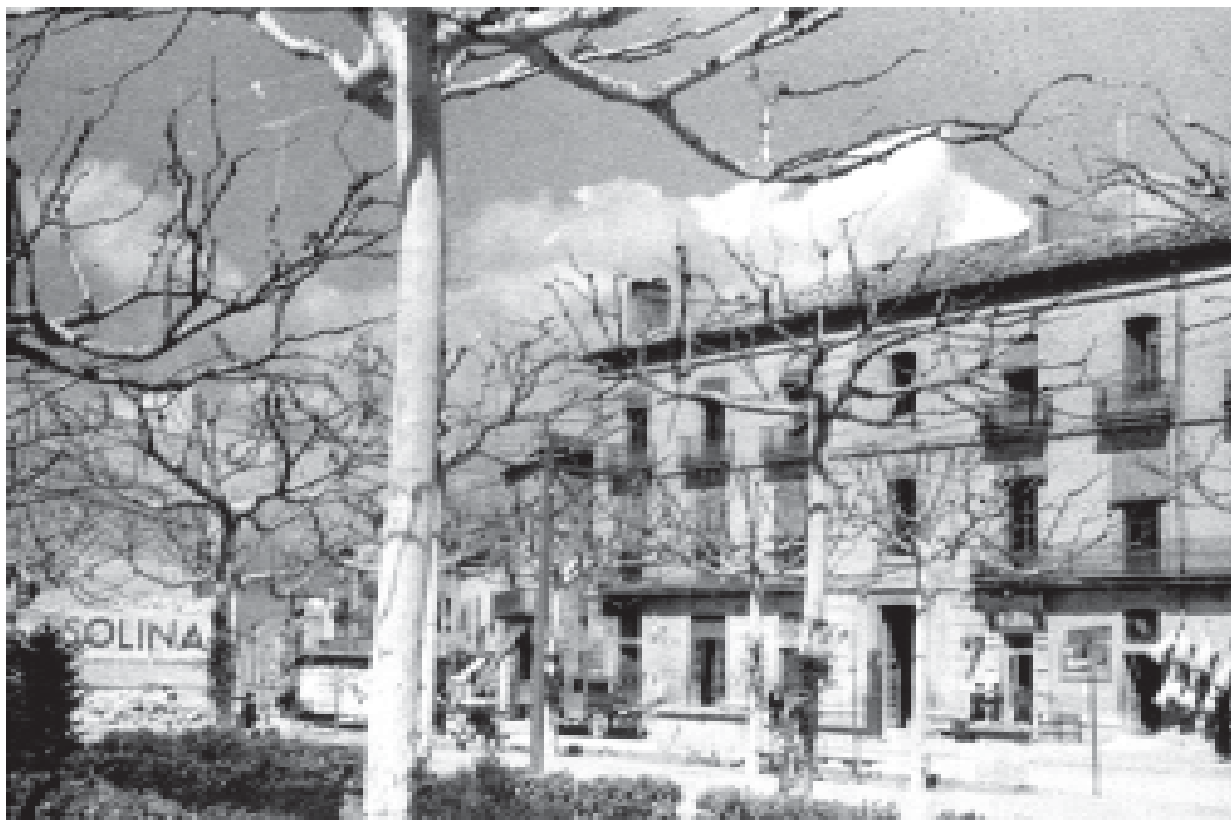
13- Vista de l'església del Carme, des del Pati. (ACTA)