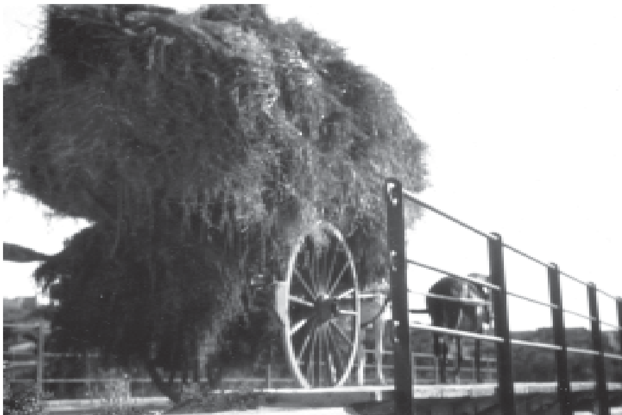
24- Carro carregat de garbes damunt el pont del Reguer a la carretera de Verdú. (ACTA)