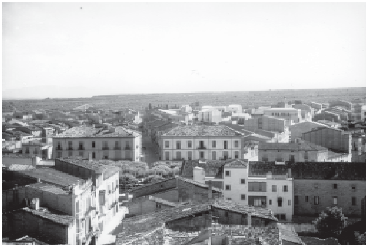
5- Vista del carrer del Carme i el Pati, des del campanar.