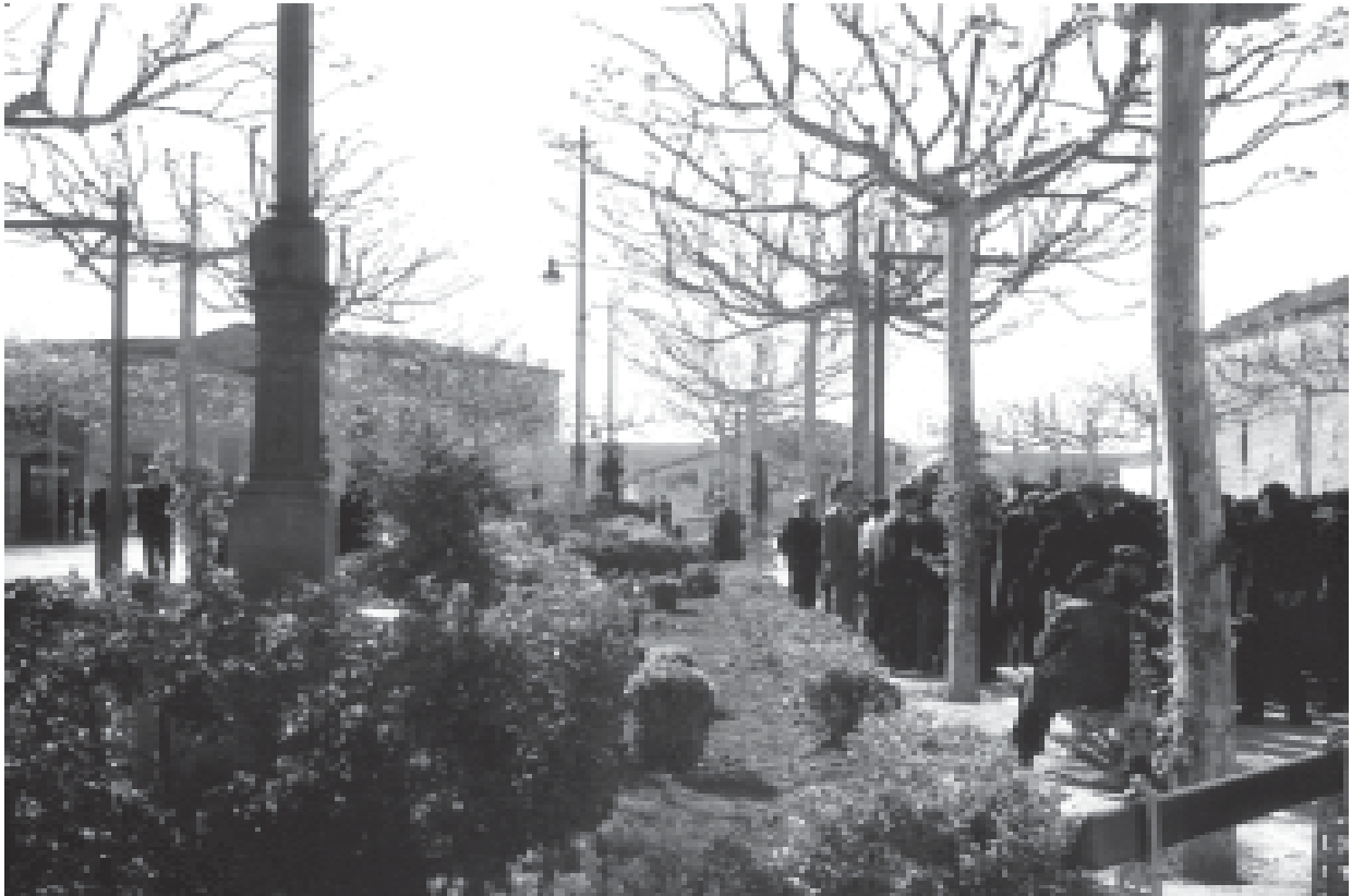
17- Jardins del Pati o plaça del Carme. (ACTA)