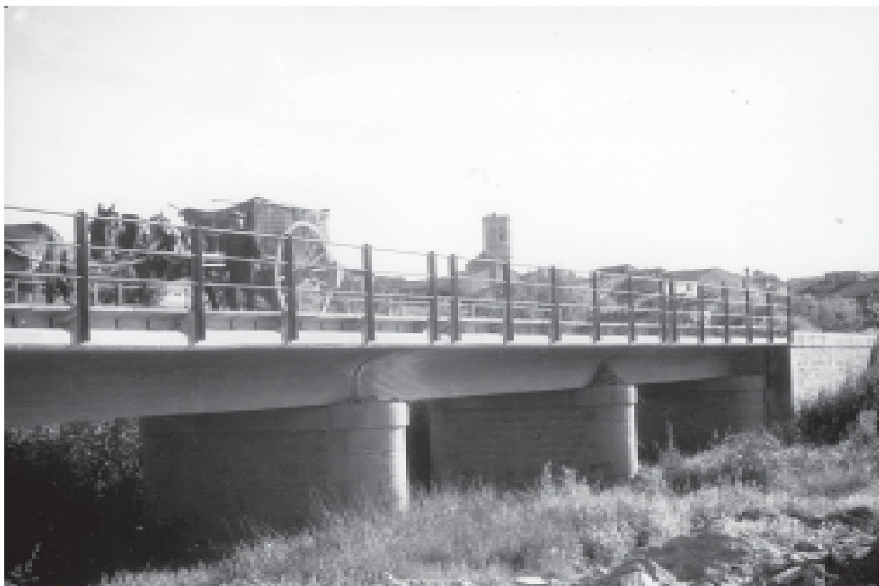
7- Vista del pont sobre el Reguer i la carretera de Tarragona. (ACTA)