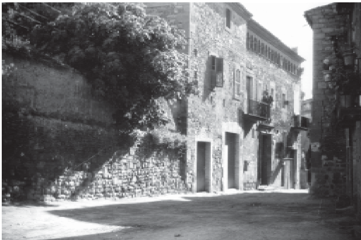
21- El carrer de l'Hospital, amb l'edifici de l'hospital del segle XVIII. (ACTA)