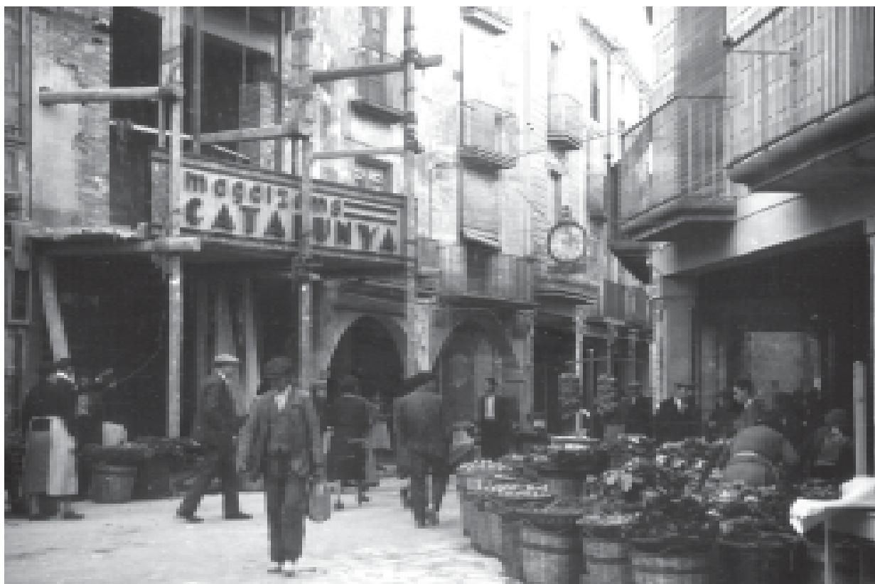
32-Automobilista davant l'edifici modernista de l'Aliança. A l'avinguda de Catalunya. (ACTA)