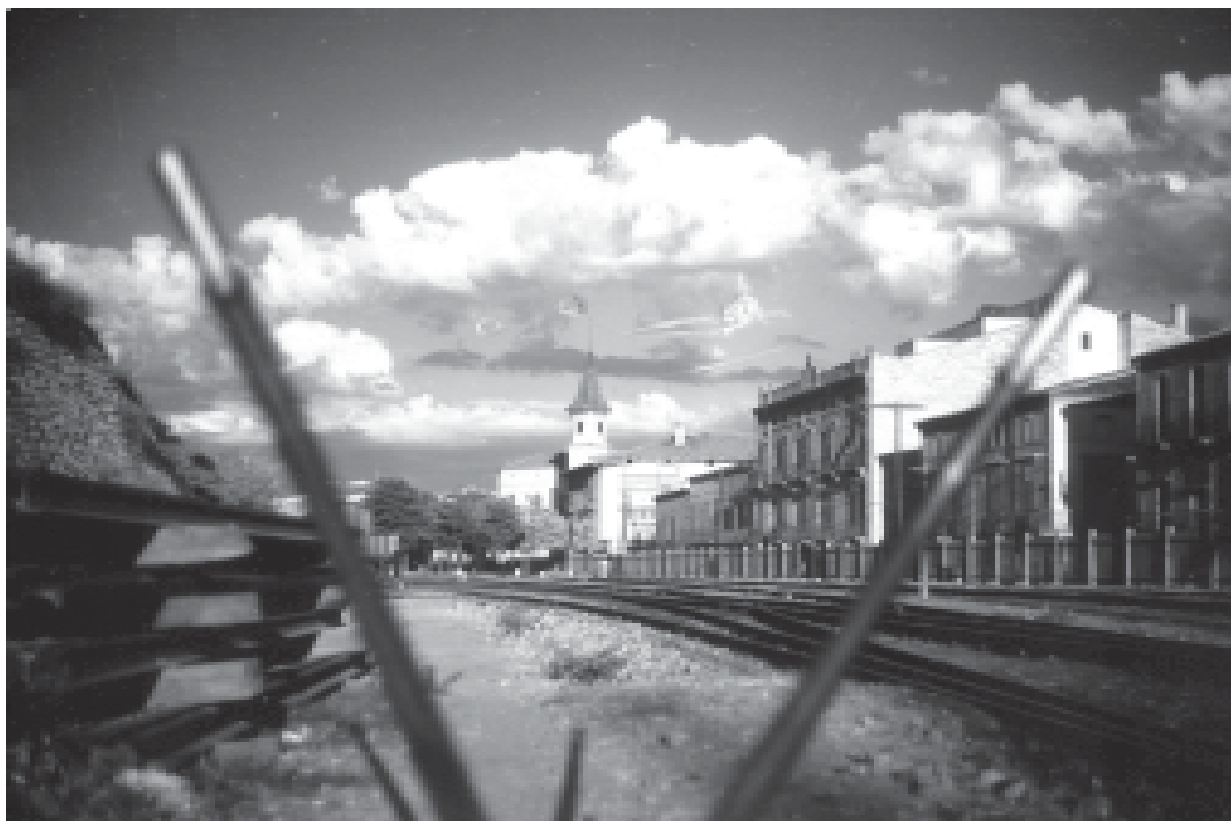
9- Vista de l'estació del ferrocarril del Nord.