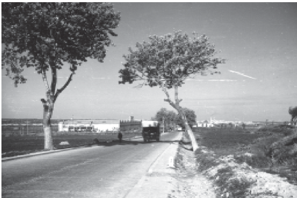
29- El carrer de Cervera, en un dilluns de mercat. (ACTA)