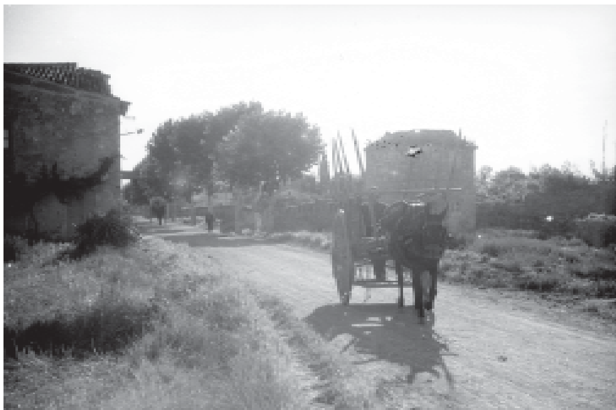
8- Vista de la carretera de Sant Martí al seu pas per la muralla del Reguer. (ACTA)