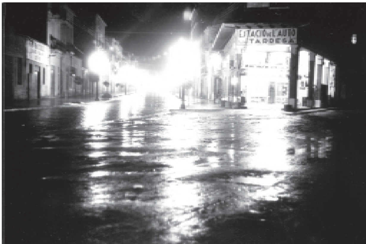
11- Vista nocturna de l'avinguda de Catalunya. (ACTA)