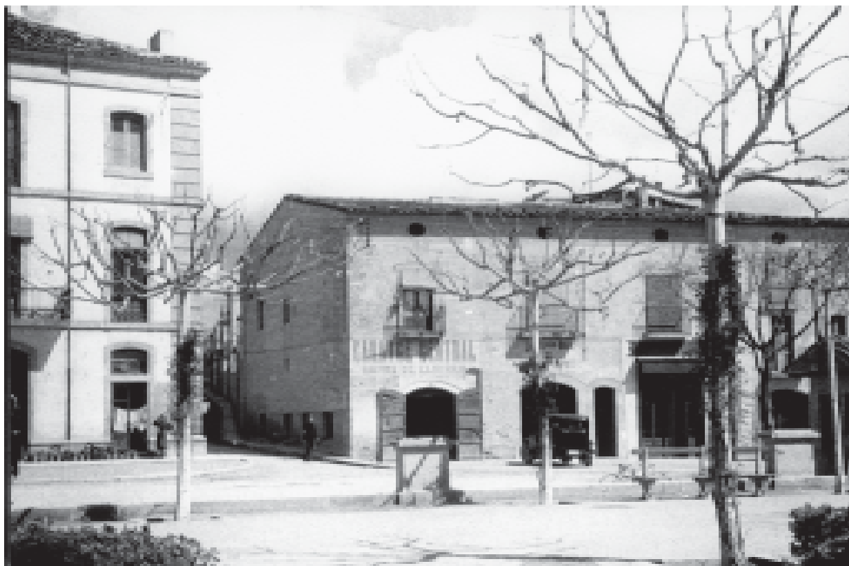
14- El Pati i el començament del carrer de Mestre Güell. (ACTA)