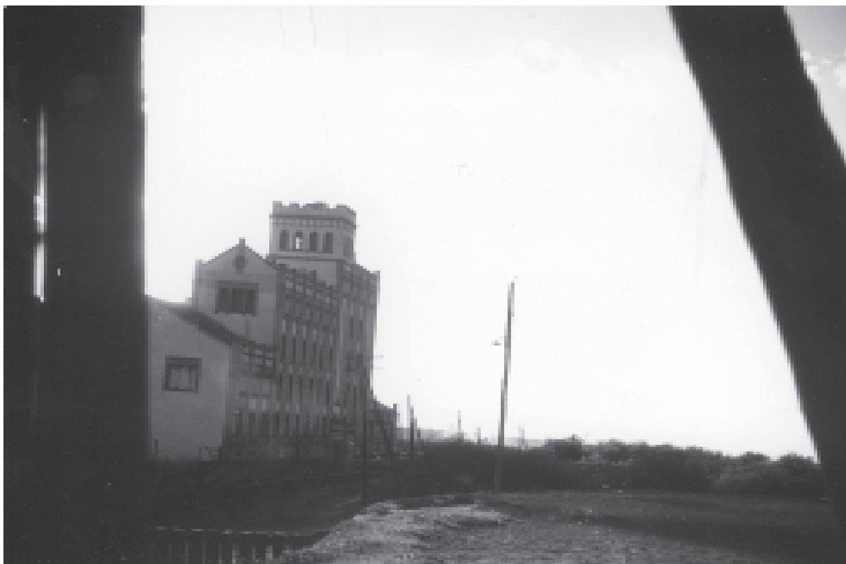
27- Edifici modernista de la farinera Balcells, construïda a començaments dels anys vint. (ACTA)