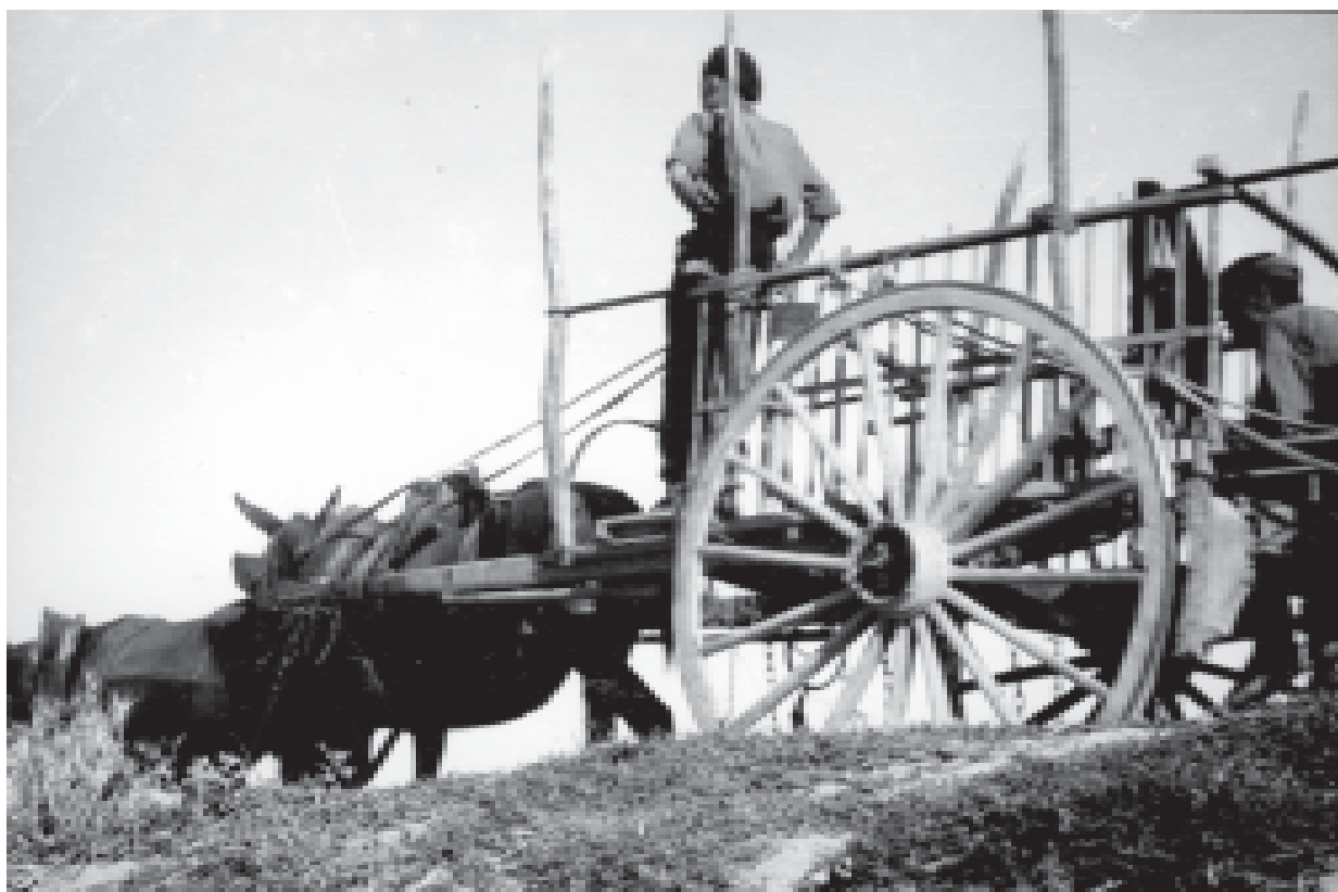
26- El carrer de Sant Joan al nucli antic de la ciutat. (ACTA)