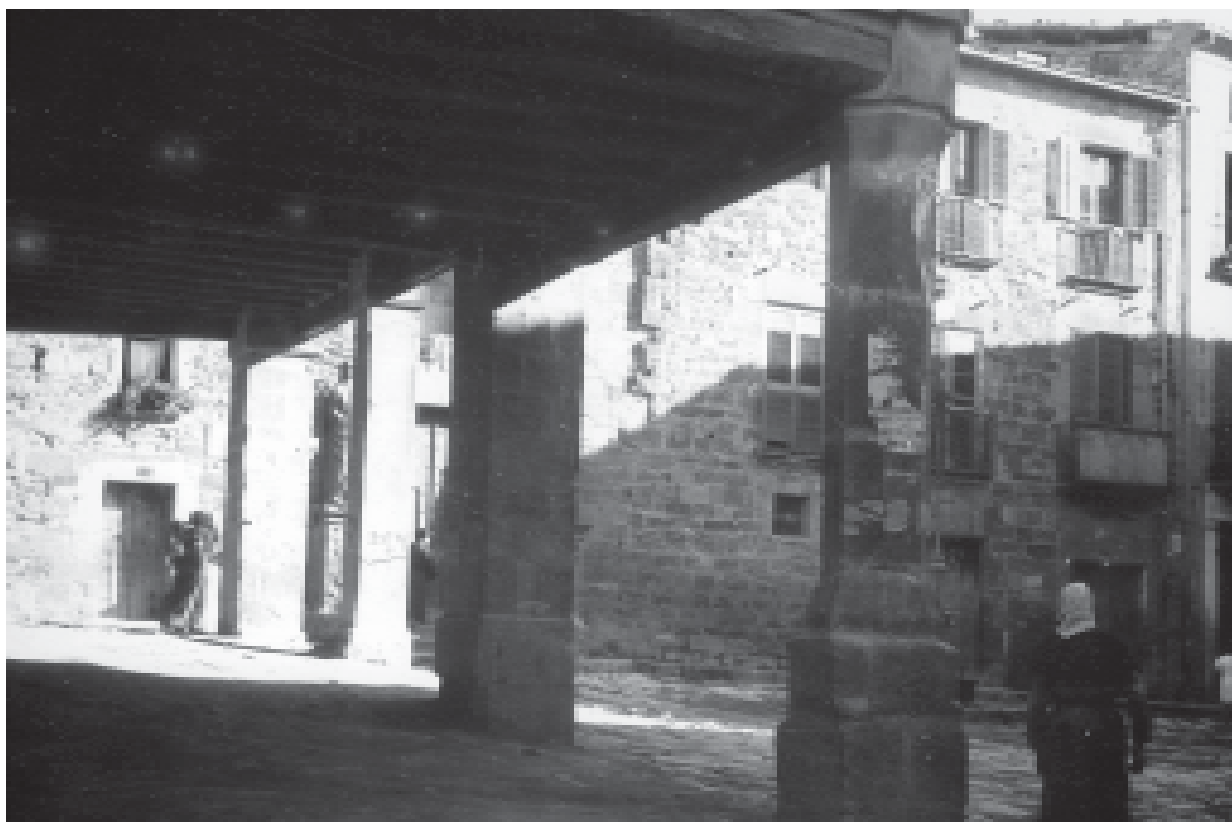
23- Carrer de la pujada al Castell, amb la serra de Sant Eloi al fons. (ACTA)