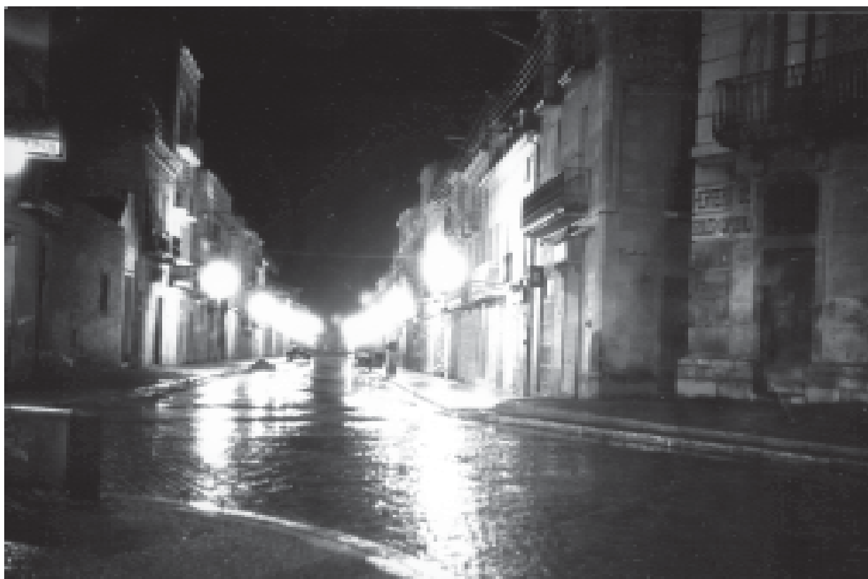
10- Vista nocturna del carrer de Sant Pelegrí, des del Pati. (ACTA)