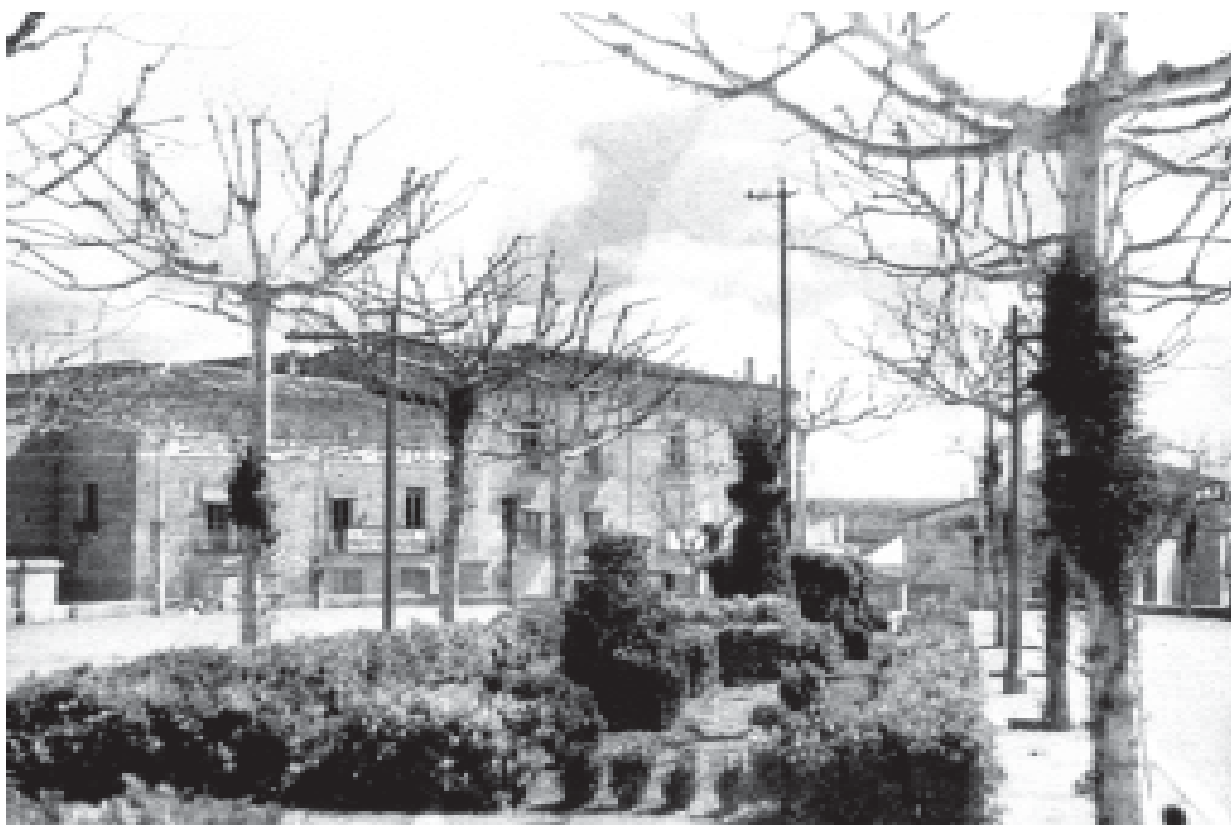
16- Imatge insòlita del campanar parroquial. (ACTA)