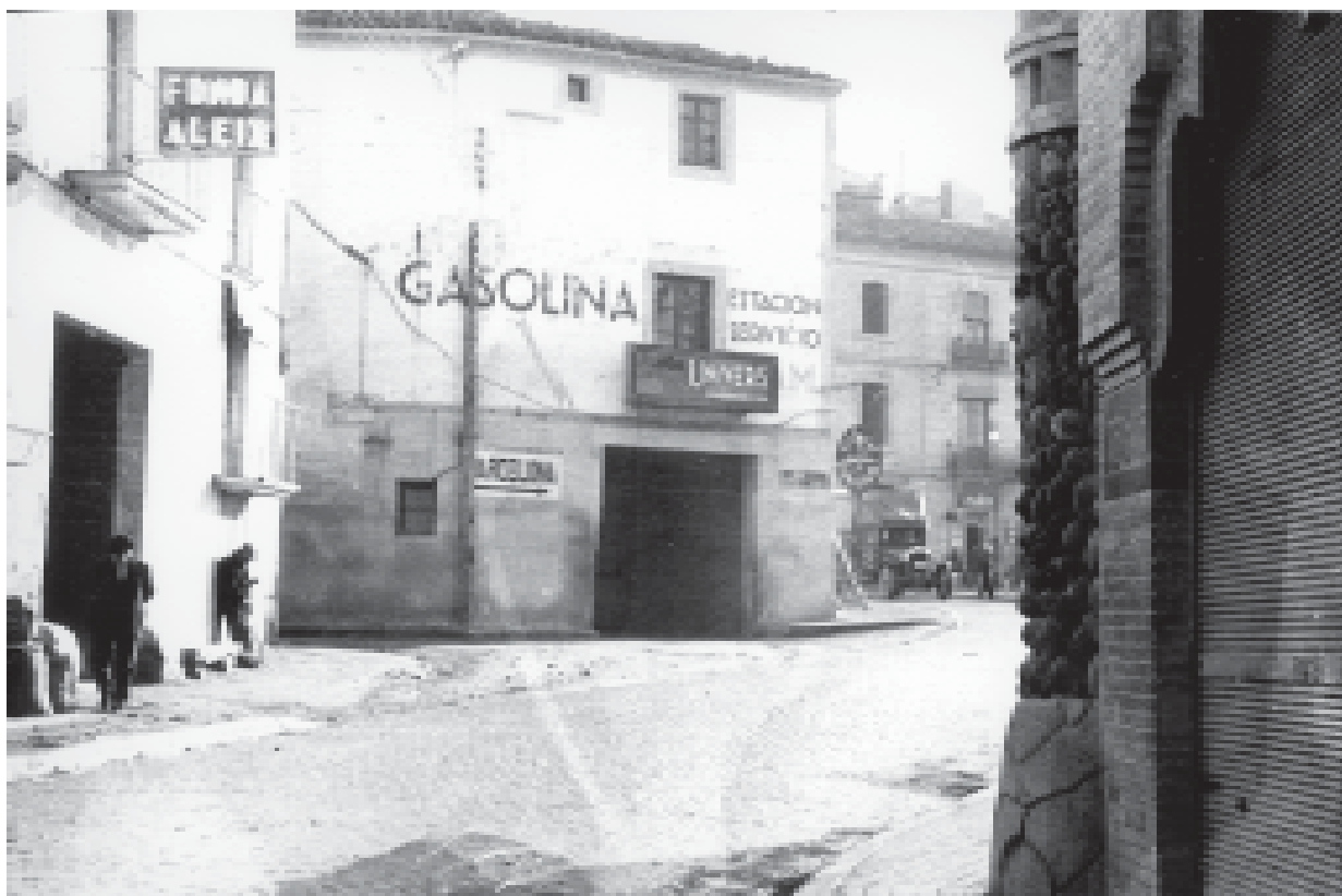
35- Claustre de l'Escola Pia. Els pares escolapis s'instal·laren a Tàrraga l'any 1884. (ACTA)