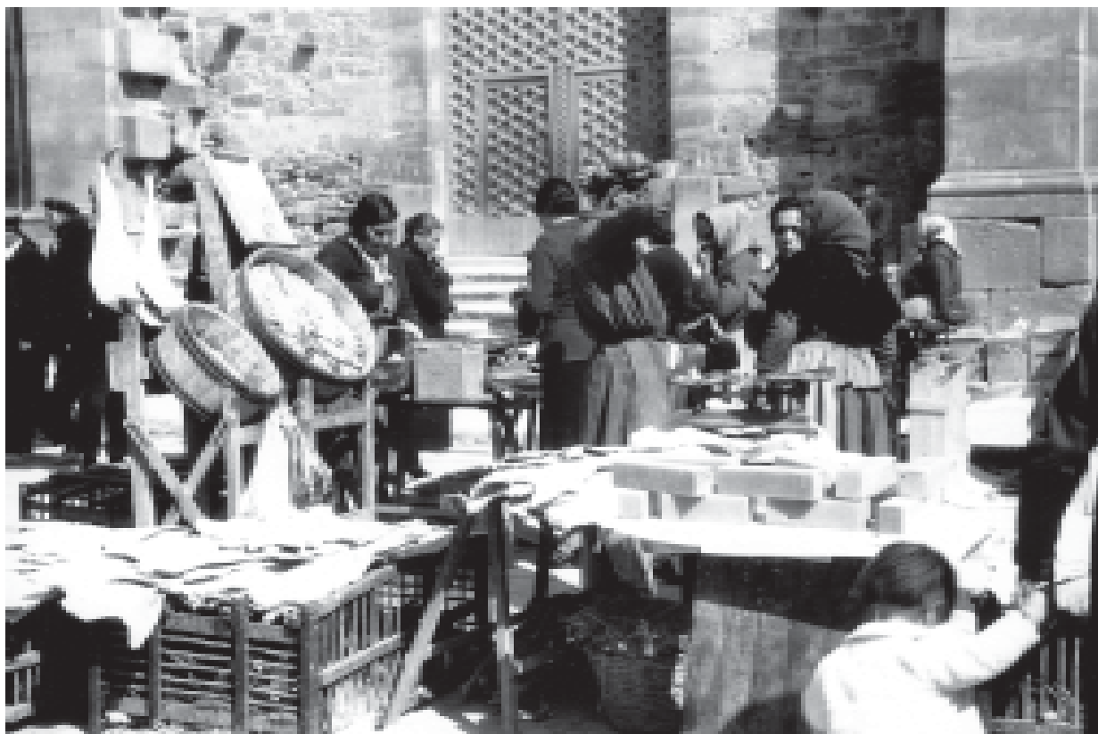
30- El mercat del dilluns a la plaça Major. (ACTA)