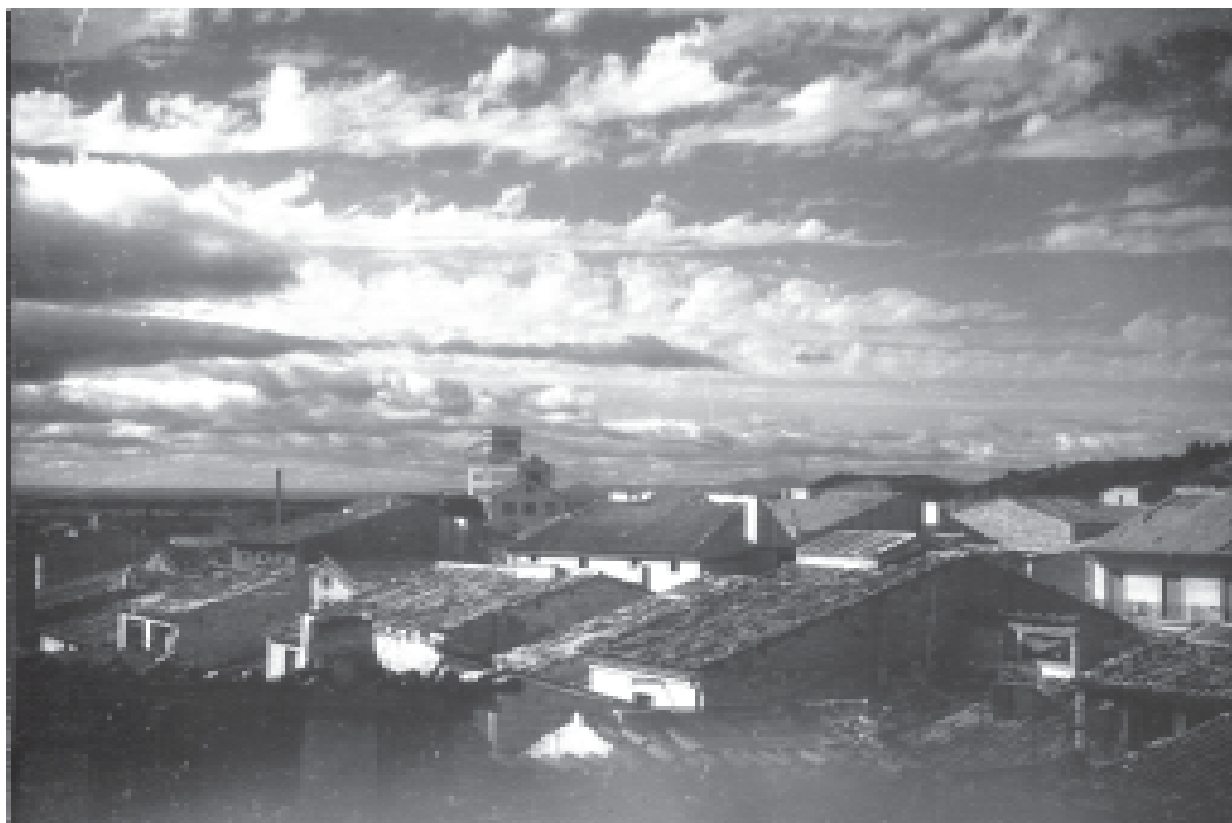
3- Vista de teulades i al fons la farinera Balcells. (ACTA)