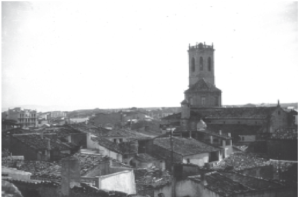
18- Per damunt de les teulades, destaquen el campanar i el cimbori parroquials. (ACTA)