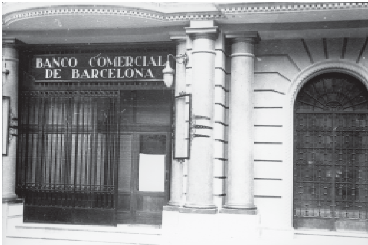
33- Vista parcial de la façana del Banc Comercial de Barcelona, a l'avinguda de Catalunya. Instal·lat a Tàrraga l'any 1931. (ACTA)