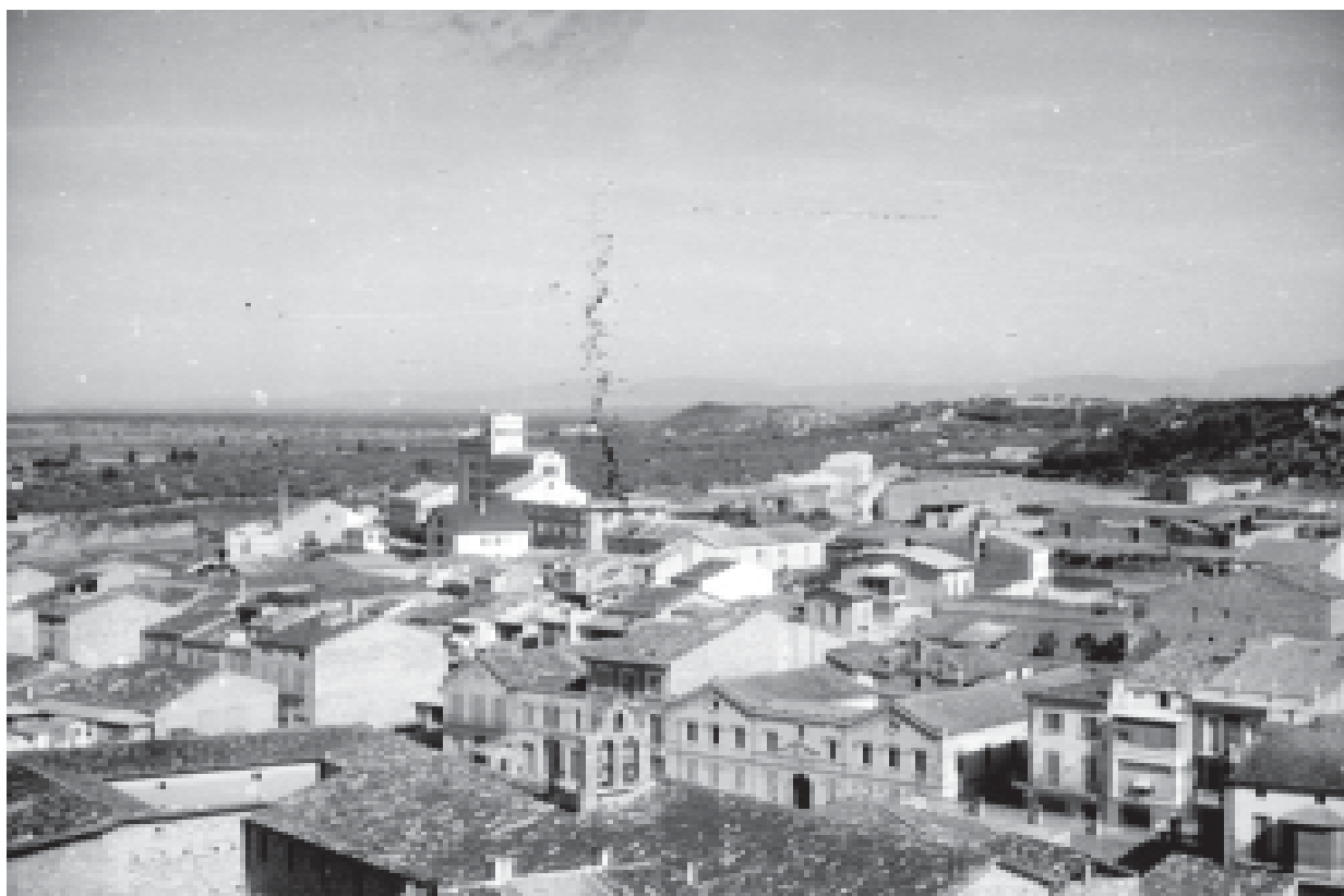
6- Vista del campanar d'espadanya de l'església de la Mercè i l'antic col·legi Sant Josep. (ACTA)