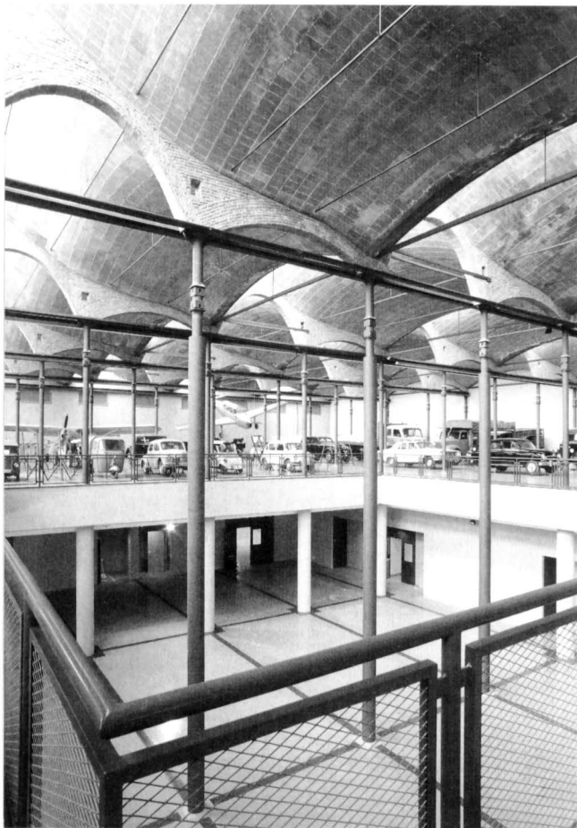
Vista parcial de la gran nau central amb coberta de dents de serra realitzada amb voltes catalanes de forma campaniforme. Aquestes descansen sobre un bosc de columnes de ferro colat. (Fotografia: Arxiu fotogràfic del MNACTEC).