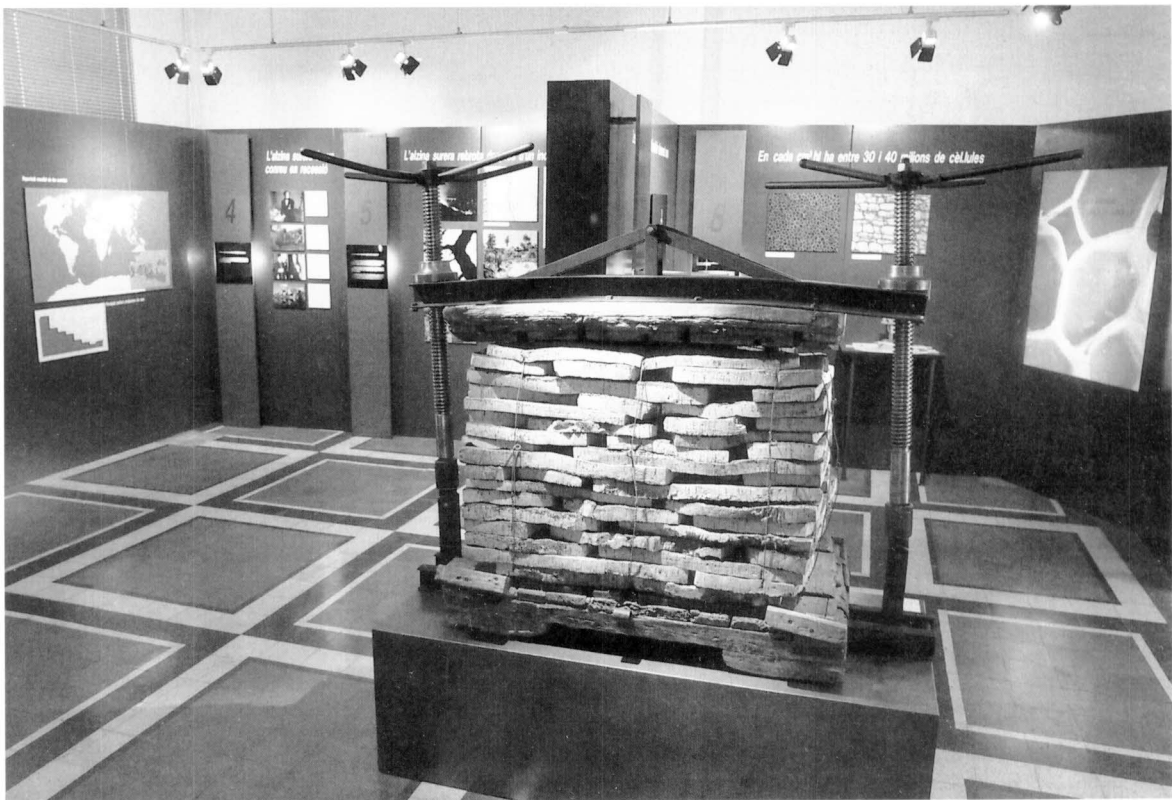
Museu del Suro de Palafrugell. Sala d'exposició permanent de bioecologia. El Museu del Suro és una Secció del Museu Nacional de la Ciència i la Tècnica de Catalunya.

Traducció del castellà: Roger Costa i Carles Garcia