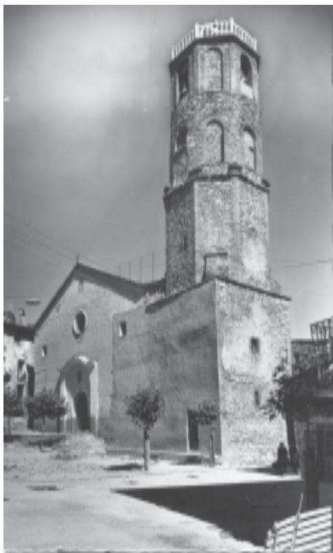
Església parroquial de Vilaller, a mitjan segle XX.

- Tost i annexes (Major). 21 òbits per a un centenar de persones. El doble que de baptismes. Gairebé un 200 per 1.000 de taxa bruta de mortalitat.