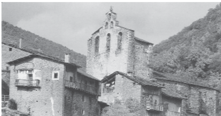
Castellbò, (Fotografia Manuel Armengol).

El 23,1 % de disminució que hi ha entre les xifres de 1719 i 1749 és totalment il·lògic i posa un cop més de manifest les ocultacions generalitzades del cens de mitjan segle. A la pràctica, aquesta disminució i aquestes ocultacions en-