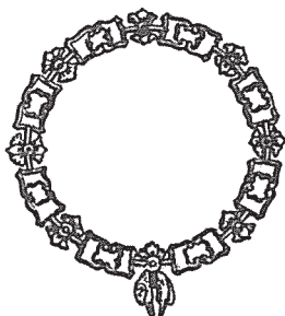
Collar de la Orden del Toison de Oro

En mi peregrinación por los Archivos Históricos, me he visto algunas veces sorprendido por los hallazgos, unas veces se ha publicado y la mayoría no, pues creo imposible me diera tiempo a terminar con tanta maravilla encontrada o simplemente con mi creencia de que no fuera visto como por mi curiosidad para ser publicado.