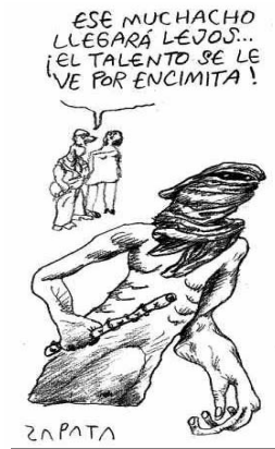
Z8: Miércoles 08 de enero de 2003