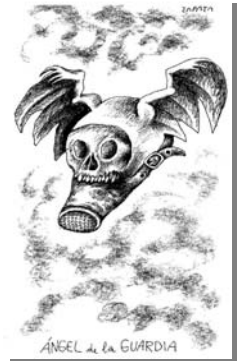
Z1: Jueves 05 de diciembre de 2002

En este nivel se inicia el proceso de transformación y codificación del hecho o evento de acuerdo con las características estructurales propias del medio impreso y con los valores, impresiones, actitudes, conocimiento y creencias que posee el caricaturista acerca del mismo. De esta