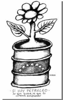
Z11: Lunes 09 de diciembre de 2002

Las personas que aparecen involucradas en los diferentes actos de habla que se presentan en las caricaturas en relación con el contexto en el cual se desenvuelven y según la intención comunicativa que manifiestan se pueden describir utilizando la fórmula expresada por Molero (1985: 52): relación YO-YO, relación YO-TÚ y relación YO-ÉL, tomando como punto de referencia el elemento icónico.