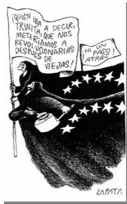
Z3: Martes 10 de diciembre de 2002

La suma de los porcentajes de los actantes opcionales presentes (pertenecientes a la zona de la anterioridad y la posterioridad) fue poco significativa (11%) respecto de los actantes 1, 2 y 3. Por otra parte, los actantes locativos obtuvieron una representación porcentual importante: