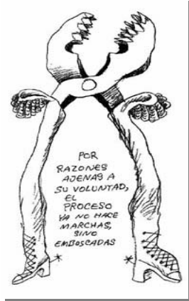
Z10: Jueves 16 de enero de 2003

Desde la perspectiva del “Otro/gobierno” el autor concibe el evento “paro cívico” como un proceso de degradación; se muestran las acciones negativas del gobierno: violencia, ataques, represión, etc. Los eventos del gobierno son semantizados de forma negativa empleando de igual forma los recursos léxicos e icónicos; estos últimos con una notable carga connotativa. Encapuchados, tirapiedras, rompeshuecos, ... son sólo algunas de las lexías asociadas al gobierno, así como los alicates con dientes de tiburón como símbolo represivo y el aspecto lúgubre con el que se ilustra a los representantes del gobierno.