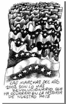
Z5: Viernes 27 de diciembre de 2002