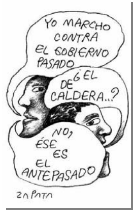
Z6: Lunes 30 de diciembre de 2002

De esta forma, las manifestaciones se fueron apoderando de la cotidianidad venezolana, pero sin alcanzar los objetivos trazados por la oposición. Durante el paro cívico nacional las marchas, los cacerolazos, el paro de la industria petrolera (PDVSA) y los diferentes pronunciamientos militares activaron acontecimientos sin precedentes en la historia de Venezuela.