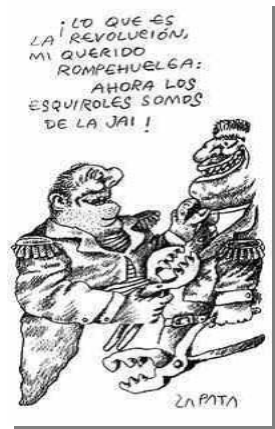
Z19: Miércoles 22 de enero de 2003

Otro de los puntos focales del paro cívico y quizás el que dejó una huella más profunda en la sociedad venezolana fue el paro del sector petrolero. La suspensión de las actividades de este sector surgió como un desafío y como una medida de presión extrema por parte de la oposición para lograr un consenso con el gobierno. Este paro trajo consecuencias desastrosas para el país entre las cuales destacan: la paralización de la exportación del crudo, el desabastecimiento de gasolina, la escasez de alimentos, el despido de miles de trabajadores petroleros, numerosos accidentes ambientales, profundas heridas y divisiones en la sociedad.