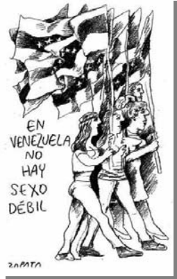
Z4: Viernes 13 de diciembre de 2002

De los diferentes tipos de diátesis utilizados para marcar el sentido en la predicación: voz activa, voz pasiva y la nominalización, en las caricaturas se emplea como esquema predicativo predominante la voz activa