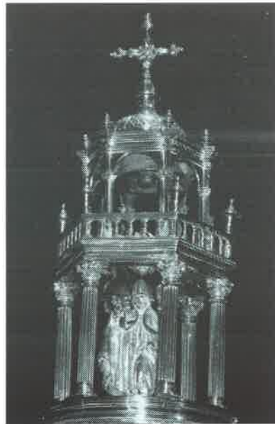
17.- Remate de la Custodia