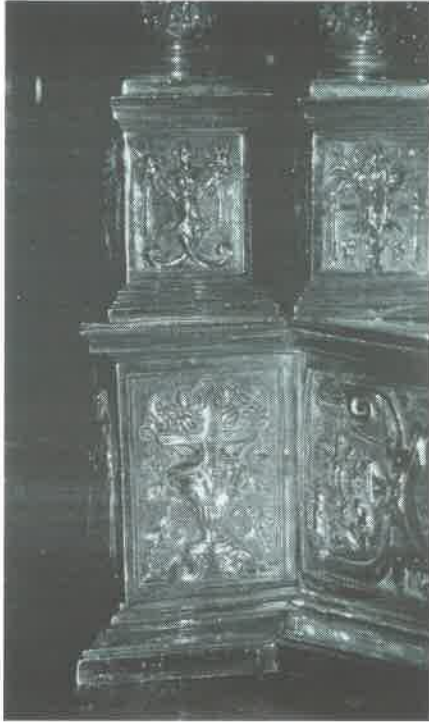
5.- Detalle basamento