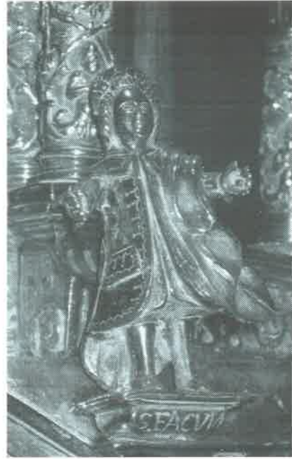
16.- San Facundo