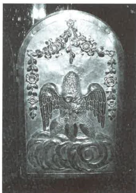
25.- Sagrario de Pecul