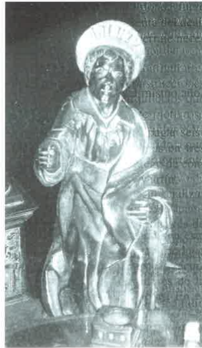
12.- San Felipe Apostol