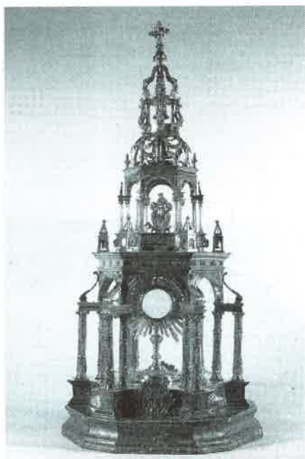
2.- Custodia del Tui