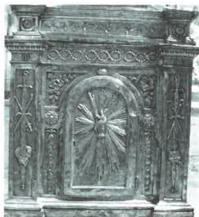
26.- Sagrario de Pecul