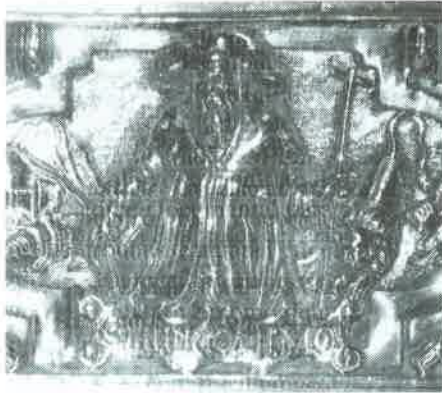
7.- San Jerónimo