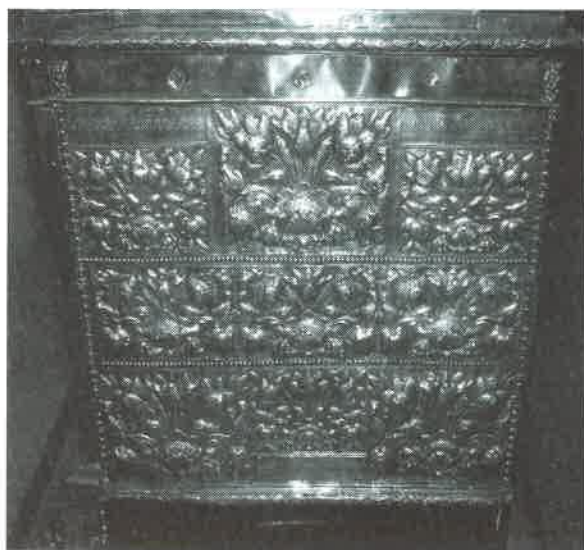
24.- Gradas de Pedro Garrido