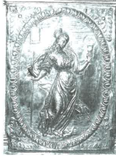
21.- Sagrario de I. de Montanos La Fe