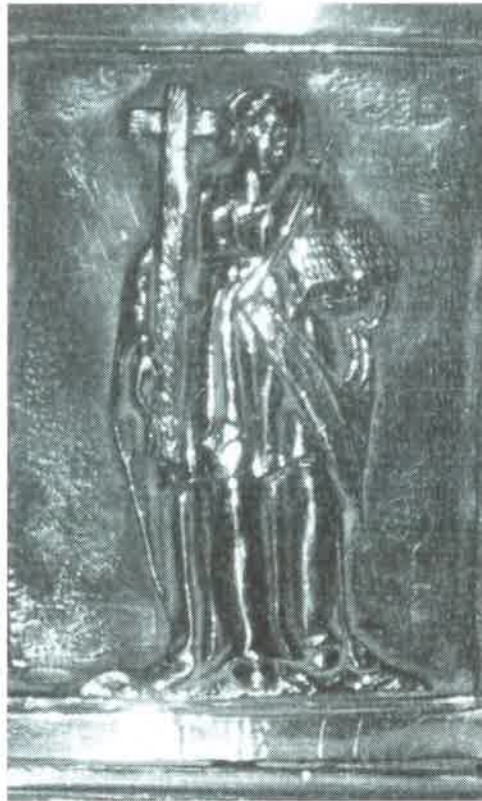
10.- La Fe