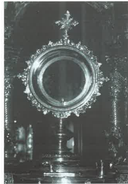
18.- Viril de San Juan