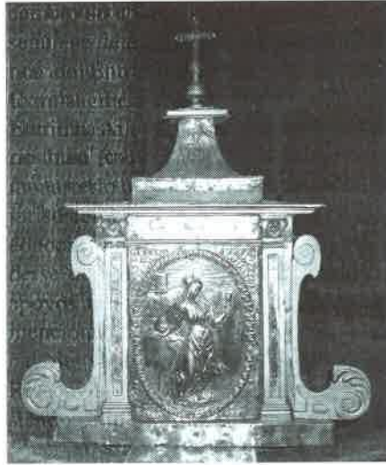
20.- Sagrario de Isidro de Montanos