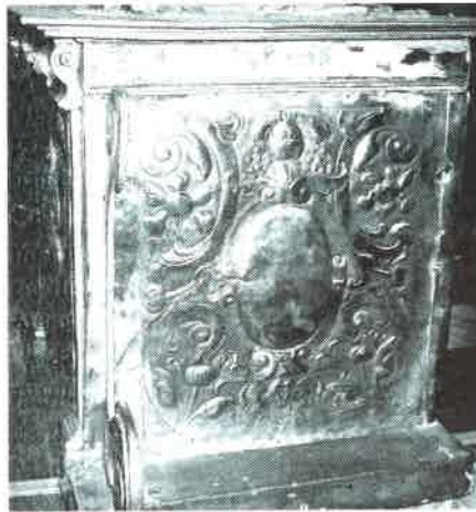
22.- Sagrario de I. de Montanos. Lateral