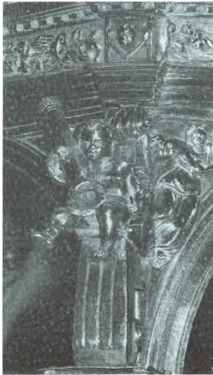
13.- Angel Pasionario