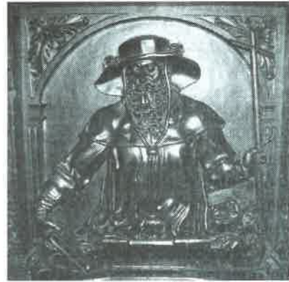
8.- San Jerónimo