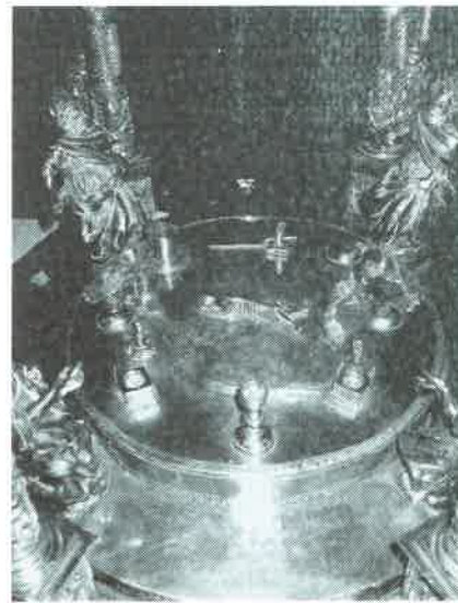
14.- La Santa Cena