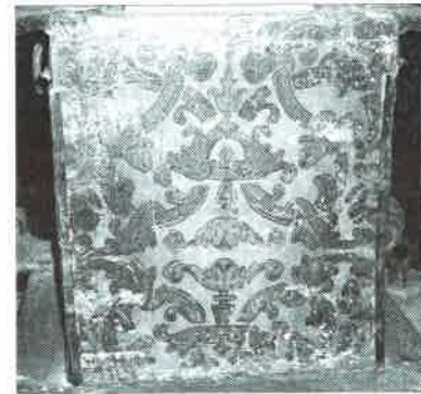
23.- Sagrario de I. de Montanos Parte posterior