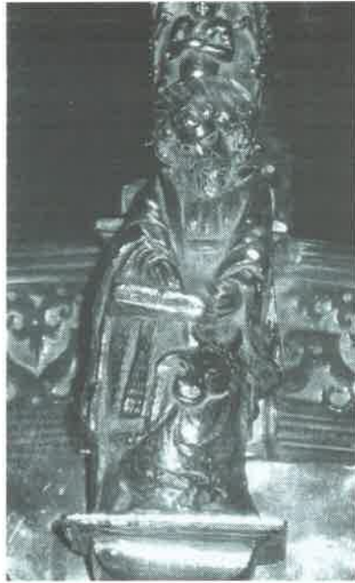
15.- San Lucas Evangelista