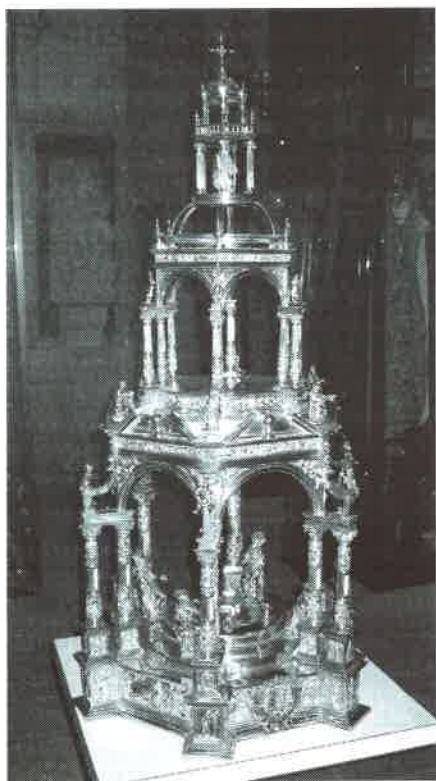
1.- Custodia del Corpus