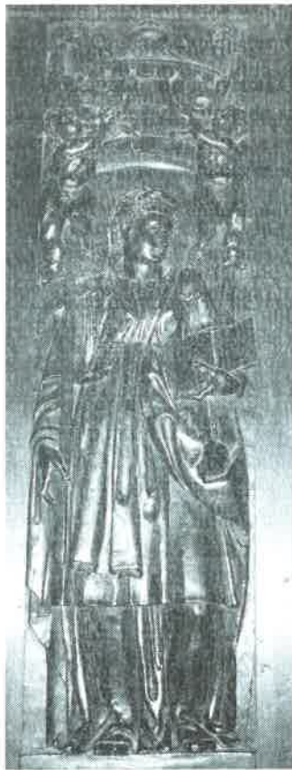
9.- La Fe