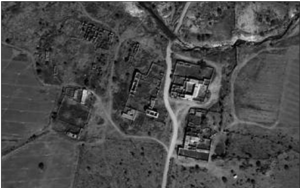
Calahorra (Estado de Zacateca, México)