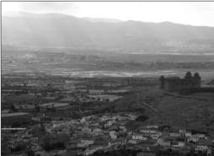
La Calahorra (Granada).