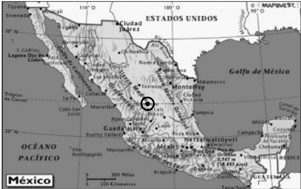
Plano de México con la ubicación de Calahorra.