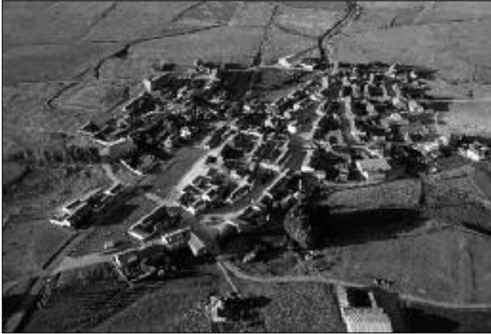
Calahorra de Boedo (Palencia).

Jim Rice, miembro del equipo de científicos de la Agencia Aeroespacial Norteamericana (NASA), registró en la Universidad Astronómica Internacional el cráter que había descubierto con el nombre de Calahorra , en homenaje a la ciudad desde la que su bisabuelo Felipe Jiménez Obanos emigró a Estados Unidos a finales del siglo XIX 56 .