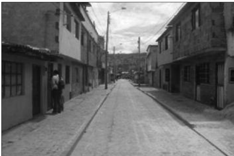
Calle del barrio Mercedes de Calahorra (Chía, Colombia)