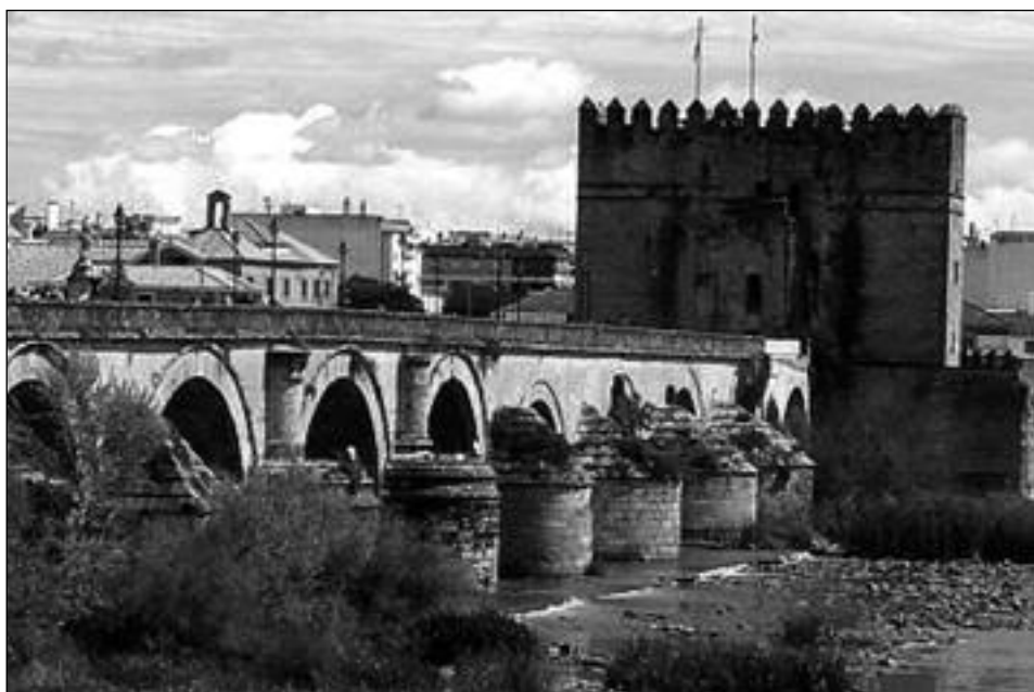
Torre fortaleza de La Calahorra, Córdoba.