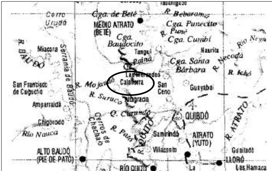
Mapa de la región del Chocó con la ubicación de Calahorra.