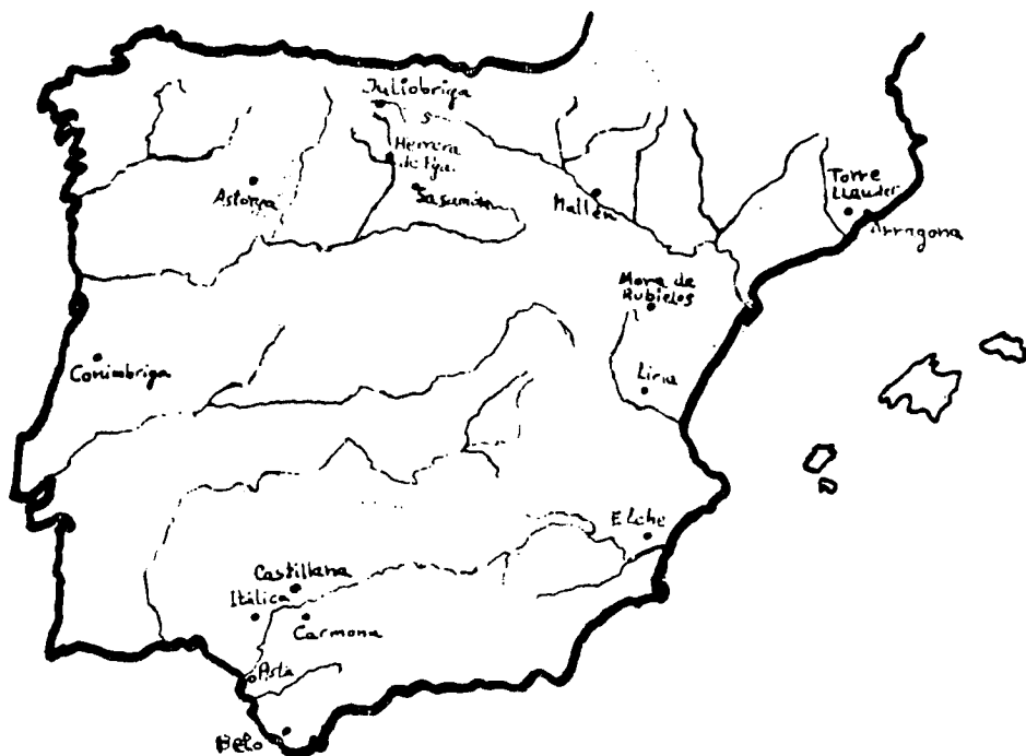
Algunos yacimientos donde se localiza cerámica "marmorata".