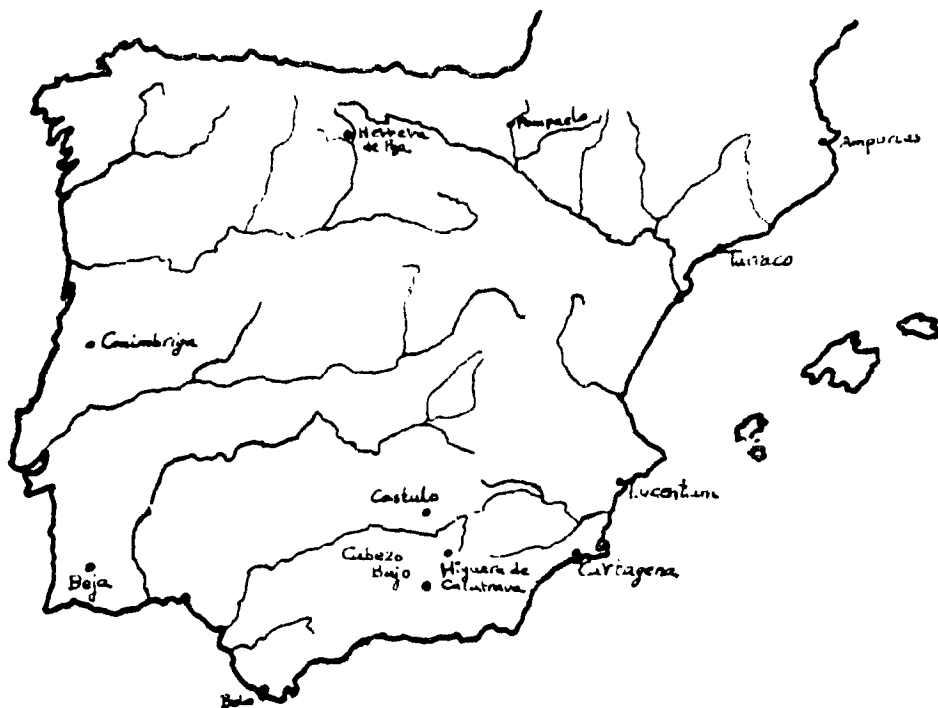
Distribución de la cerámica con sello del alfarero gálico Calvo.