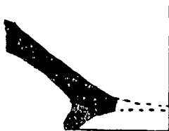
Cuenco de cerámica "marmorata" procedente de Sasamón (Burgos).