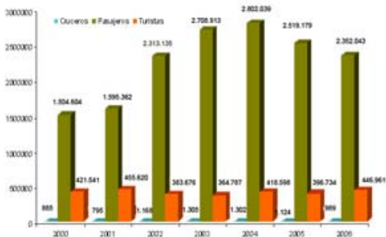
Grafico N° 1 Cruceros, pasajeros y turistas en Cozumel 2000 – 2006

Elaborado con información de SEDETUR, 2007