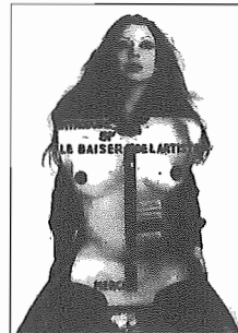
ORLAN, EL BESO DE LA ARTISTA, Imagen de la performance realizada en la FIAC de 1977, París

Como pone de manifiesto este último ejemplo, las múltiples soluciones con que se resuelve un montaje expositivo corresponden a sus variados contextos espaciales. Con todo ello, lle-