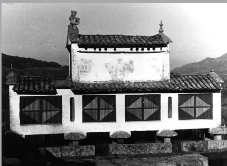
Hórreo de Vilariño, na actualidade en estado ruinoso.