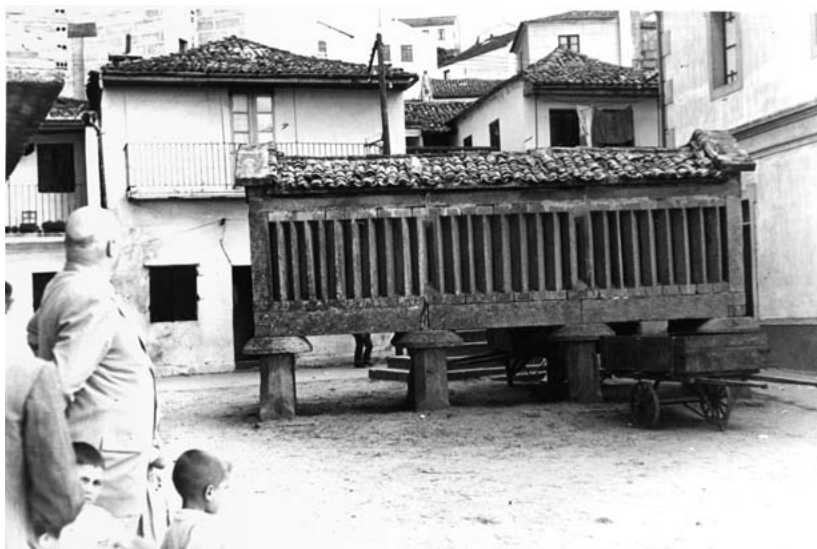
Hórreo nas rías baixas.

O seu labor foi realizado no momento xusto, Hoxe resultaría imposible pois aínda tendo moitos máis medios técnicos faltaría o fundamental, que é o material sobre o que realizar a investigación. As causas da desaparición son varias. A primeira e fundamental é a evolución dos sistemas e modo