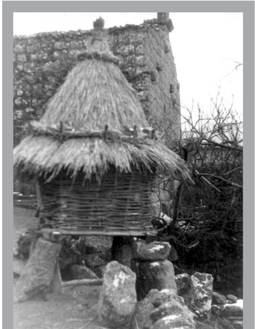
Canastro de varas, na actualidade en vías de extinción.

As administracións das que depende a cultura deberían lembrarse todos os días do ano de cal era o desexo de persoeiros que dedicaron a súa vida a estudar a nosa cultura e que hoxe xa non están entre nós, pois lembrarse só deles de vez en cando para cubrir o expediente ou facer a foto correspondente non é un modo