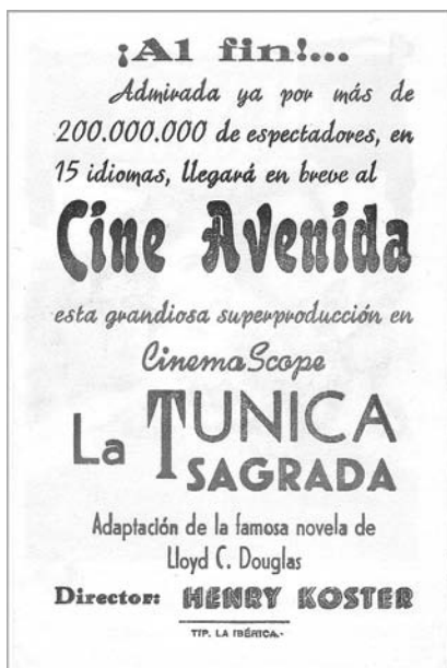
Cartel de La túnica sagrada , primera película en Cinemascope, estrenada en el Cine Avenida (anverso y reverso).

de San Juan 31 , el filmado en 1955 con motivo de la inauguración del «campo de aviación» o «aeródromo» de Buenavista, y el realizado en 1958 con el título de La isla verde que ensalzaba las bellezas naturales de la Caldera de Taburiente, pocos años después de su declaración como Parque Nacional.