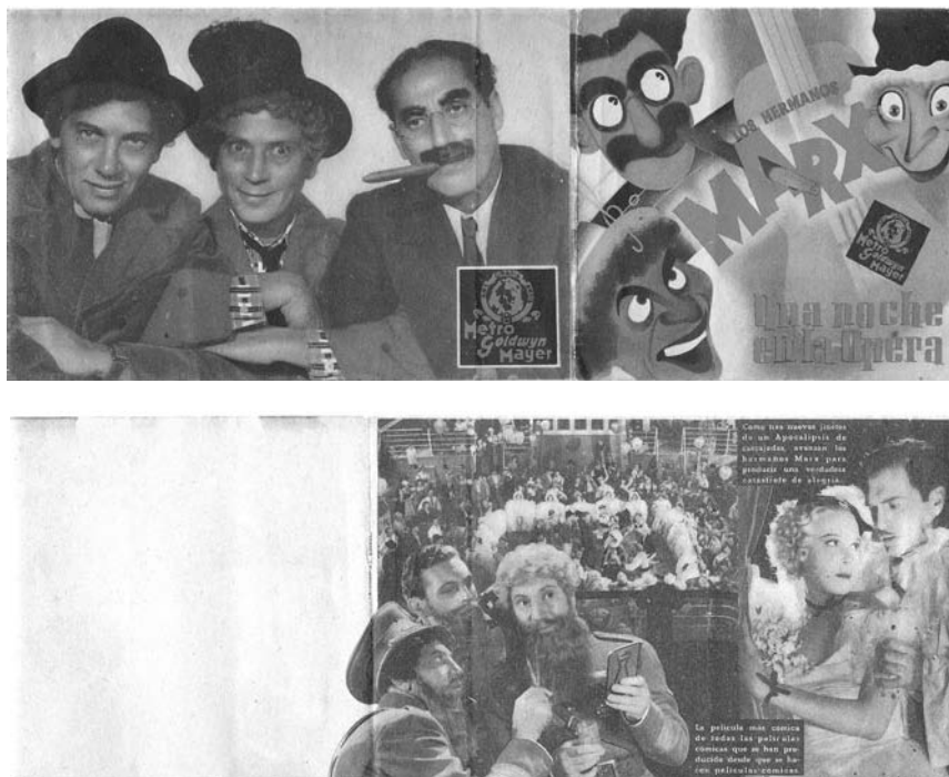
Hermanos Marx, actores de la Paramount (anverso y reverso).

turas. Todavía funcionaba el blanco y negro, pero comenzaban los primeros escauceos con el color ( Blancanieves y los siete enanitos de Walt Disney). También abrieron sus puertas el renovado Parque de Recreo, en abril de 1940, techado desde finales de 1948 29 , siendo su propietario don Manuel Fernández de las Casas; y el Imperial Cinema de Los Llanos de Aridane, en 1941.