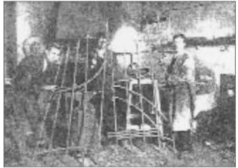
Alumnos da Escola de Artes o Oficios no taller de forxa (ca. 1900). Estas escolas creáronse para darlles ós obreiros e mestres unha formación xeral que non tiñan, e tamén para instruílos nos adiantos que se presentaban nos seus oficios. Aínda non existían as equivalencias de títulos.

En segundo lugar, tal como expresa a lei no seu preámbulo, a vertixinosa rapidez dos cambios cultural, tecnolóxico e productivo sitúanos nun horizonte de frecuentes readaptacións, actualizacións e novas cualificacións e, xa que logo, "la educación y la formación trascenderán el período vital al que hasta ahora han estado circunscritas y se extenderán a sectores con experiencia activa previa, se alternarán con la actividad laboral" 1 . Mozos e adultos deben partir desta formación básica e