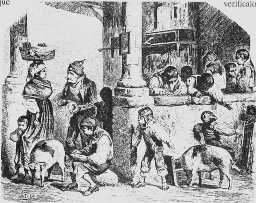
Escola no adro dunha igrexa. Grabado de "La Ilustración Gallega y

Asturiana", t. II, Madrid, 28-VIII-1880, n.º 24.