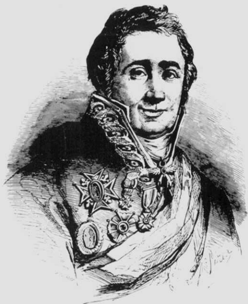
Don Francisco Tadeo Calomarde (1773-1842), Ministro de Gracia e Xusticia de Fernando VII desde 1824 (xa o fora desde 1815 ...) a 1833 e xefe do partido Ultrarrealista nese tempo. Foi responsable do axusticiamento de moitos e notorios liberais, polo que o tempo da súa xestión se coñece como a "ominosa década de Calomarde". Pechou as universidades para abrir escolas públicas de tauromaquia e a el se lle adxudica o "Plan y Reglamento General de Escuelas de Primeras Letras" de 1825. Litografía da Biblioteca Nacional.

"No el principio de la escuela obligatoria, sino el principio de la Iglesia obligatoria: este último es el que preside el campo educativo dentro de la sociedad española de esta larga época ... concibe la escuela