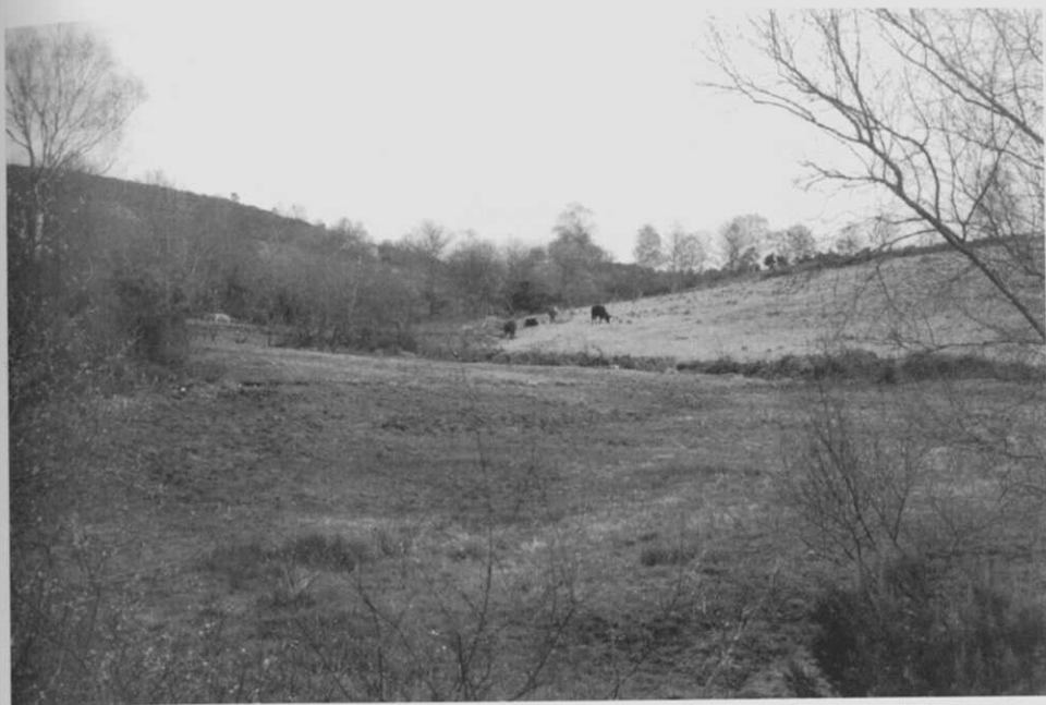
Fig. 2.- Lugar del nacimiento del río Mandeo, en donde confluyen varios manantiales, en la Sierra do Corno do Boi, en el límite de las provincias de A Coruña y Lugo.

/ con permission suia dada a instancia de los propios vezinos, por / privilegio expedido cerca de Valencia en la era 1257 atrahi / dos de la conveniencia de los dos rios que la bañan y circuien, / el Meno, (sic) u Meano, y el Mandeo, este que nace a 7 leguas / de Betanzos en la Sierra de cambaos, una legua distante de el ca / mino de Lugo en la Montaña de Mesía, o Mexía, y unidos / ambos a poco trecho entre Norte y tramontana descenden a / la Ria de el Pedrido, donde los recibe el Oceano, y forman / de el lado derecho, e izquierdo las dos Rias de Betanzos, hasta / la entrada, o seno de Marola, a la vista de la Coruña./