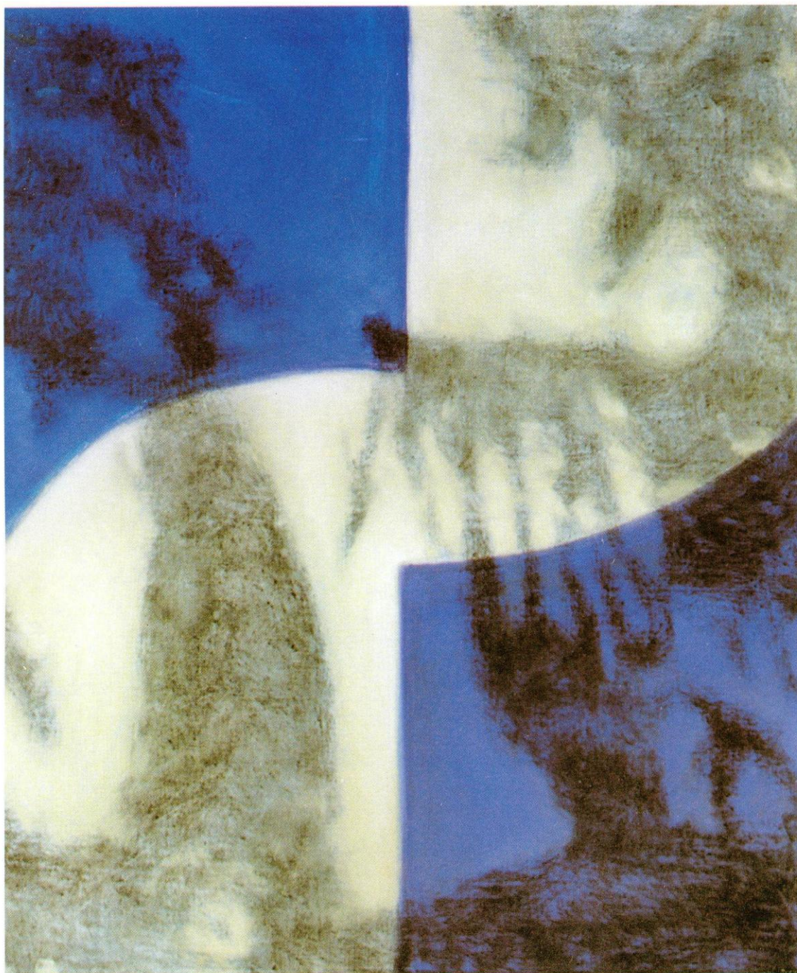
"Preparando el deseo". 73 X60 cm. 15:11 p.m, Otoño 98

que la geometría se diluye frente al delimitado dibujo de la figura (Serie " Más que nubes, cielos "). Es el momento en el que rompe con lo anterior y empieza a trabajar las sombras, como el camino escogido para desarrollar su creación artística. En este proceso creativo Tomaso ha ido abandonando el realismo figurativo, que él domina como gran dibujante, para ir formando su propia figuración, en un proceso de abstracción, cada vez mayor, de las formas.