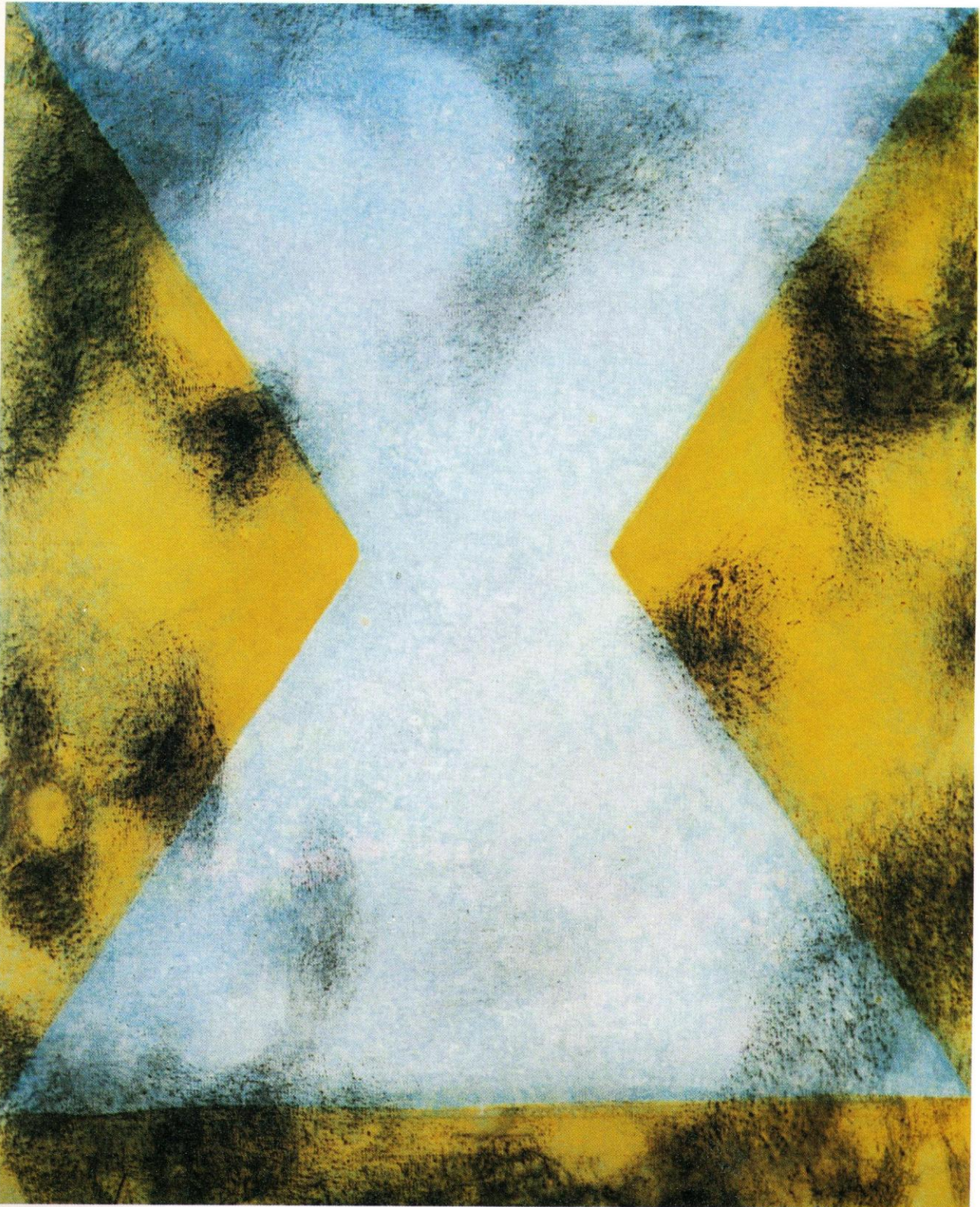
"Sombra de ideas". 73X54 cm. 17:43 p.m. Verano del 98

Página siguiente: "El punto del límite". 230X195 cm. 14:10 p.m. Verano del 98