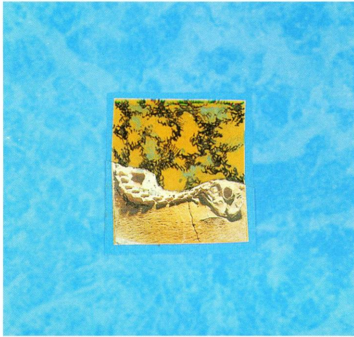
Collage sucesivo . 9X9 cm.97-98

realizando sus pinturas de manera cada vez más libre, lo que le permite conseguir y plasmar esa búsqueda y hacerla llegar hasta nosotros.