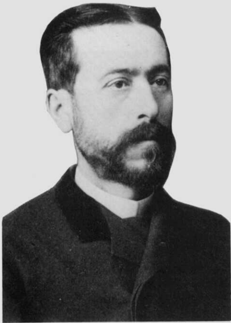
Fig. 2.- Dr. Ramón Juega Charlin (1887).

(pai), se pode ver na figura número 1 (2). Edifício no que rompe a funcionar La Primitiva en 1877.