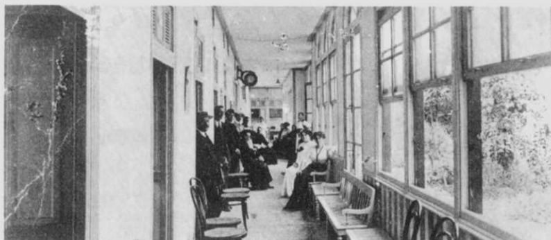
Galería de Baños