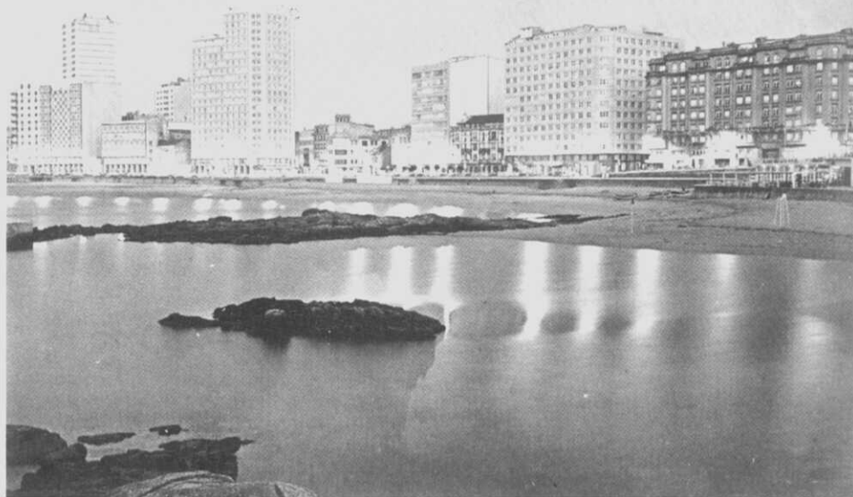
Fig. 7.- Nesta vista de 1992 poden-se apreciar as fincas números 5/6 e 7/9 da Av. de Buenos Aires, cos edificios que substituíron à Casa Ares e a La Primitiva.