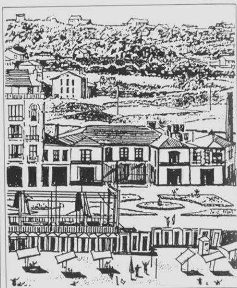
Fig. 5b. Así plasma a Historia da cidade da Coruña en cómic ( Equipa Nono Art, Barcelona/Zaragoza, 1985, pág. 52 ) tamén sen nomeá-la, a foto da fig. 5a, relacionando, no pé, a La Primitiva co primeiro vó que, en 1911, sulcou o céu coruñés: craso erro, pois, aínda que esta vista é aérea, corresponde p. 1927, cando se edifica o engadido da esquerda (e a Casa Ares se construiu nos anos 20). Aquí se pode apreciar, mellor do que na foto, a edificazon, a dúas áugas, do fondo esquerda, única sobrevivente — abandonada — hoxe en día, sita na confluencia da rua Rei Abdullah coa de Pérez Cepeda , que fora antano fábrica de gaseosas.

Deses anos (de antes e despois) son (lembrete e postal que reproducimos por ambas as caras, figs. 3, 4a e 4b) as tarifas de prezos que