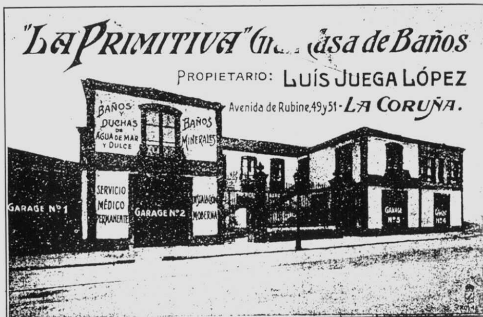
Fig. 5.- De La Coruña, Guía consultorio, Imp. Moret, 1926. Na Bibl. Mpal. de Estudos Locais.

de armas, esgrima e ginásia, audizos fonográficas, etc., sumado ao instrumental necesario para o cumprimento da súa funzon: aparellos hidroterápicos de massage, duchas de vapor, mecano e electroterápia.