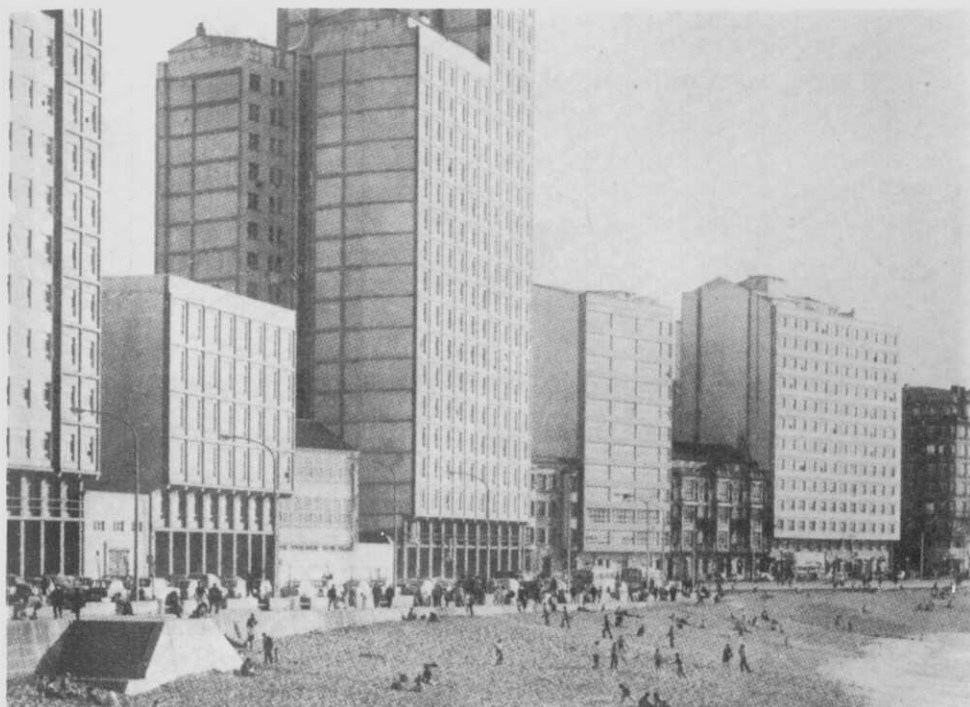
Fig. 6.- Nesta vista dos anos 1960 aínda está a Casa Ares acaron da que substituíu a La Primitiva.

do nacemento ao cumprido andén de Riazor, con xardinciño incluído, e no que se montava, cada temporada, a artística e moi fotografada marquesina; gañando-o todo a Casa de baños; se ben fotograficamente seguiu oculta como sempre: se antes as citadas casas, interpondo-se, non nos permiten vé-la en tantas vistas como de Riazor hai, a marquesina, agora, cubría boa parte da súa fachada vista desde o mar. Así e todo, seguiron algun tempo máis os chamados ranchos de Riazor, no andén do tramo seguinte, entre as actuais Pondal e Calvo Sotelo, tradicional morada dos pescadores da zona, contra os que tanto clamava a prensa da época. E é entón cando o tramo marítimo de Rubine volta a cobrar autonomía, para ficar La Primitiva (ampliada no ínterin a fachada por ambos lados, figs. 5, 5a e 5b) situada na avenida de Buenos Aires, número 49; autonomía que se converte en independencia total