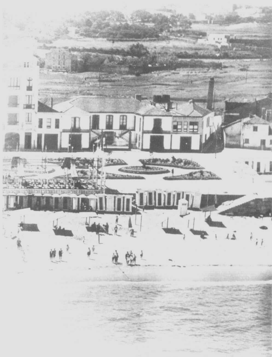
Fig. 5a. Tan esquencida está La Primitiva das últimas gerazons, que esta fotografía, frecuentemente exposta en mostras sobre o pasado coruñés, jamás leva un pé que a identifique. Aquí figura a Casa Ares, recién construída à sua esquerda (post. ano 1927).