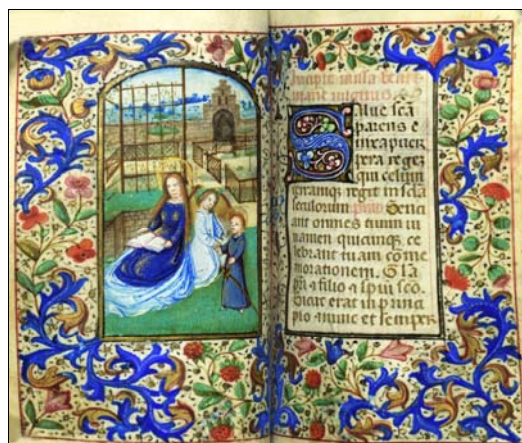
■ Lám. 14. Hortus conclusus. Libro de Horas, Flandes (Barcelona, Biblioteca de Catalunya, ms. 1856, fol. 30v) (finales del siglo XV).