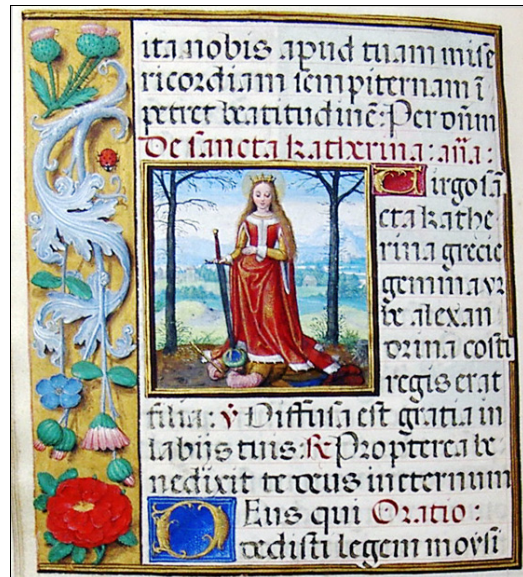
■ Lám. 21. Simon Bening. Santa Catalina. Libro de Horas, Flandes (Biblioteca de la abadía de Montserrat, ms. 53, p. 350) (c. 1535-1540).