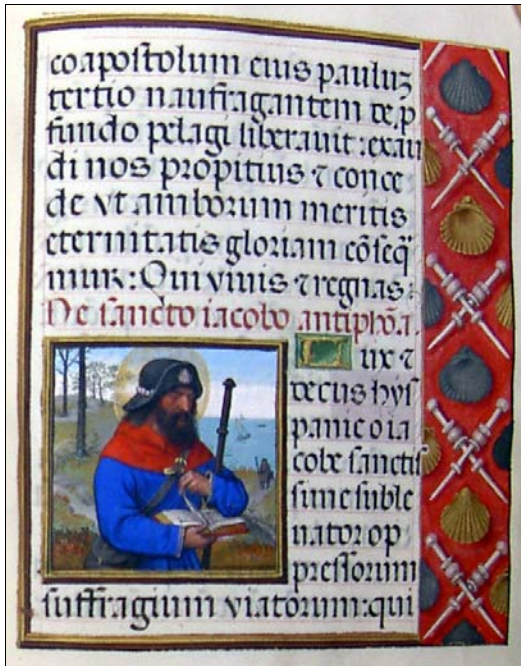
■ Lám. 20. Simon Bening. Santiago el Mayor. Libro de Horas, Flandes (Biblioteca de la abadía de Montserrat, ms. 53, p. 323) (c. 1535-1540).