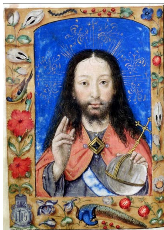
■ Lám. 17. Santa Faz. Libro de Horas, Flandes (Barcelona, Biblioteca de Catalunya, ms. 1852, fol. 14) (c. 1500).