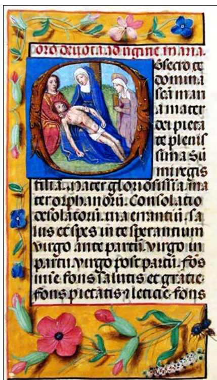
■ Lám. 16. Piedad. Libro de Horas, Flandes (Biblioteca de la Universidad de Barcelona, ms. 1859, fol. 166) (finales del siglo XV, inicios del XVI).