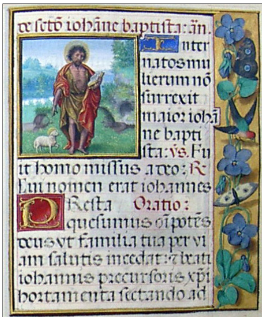
■ Lám. 22. Simon Bening. San Juan Bautista. Libro de Horas, Flandes (Biblioteca de la abadía de Montserrat, ms. 53, p. 319) (c. 1535-1540).