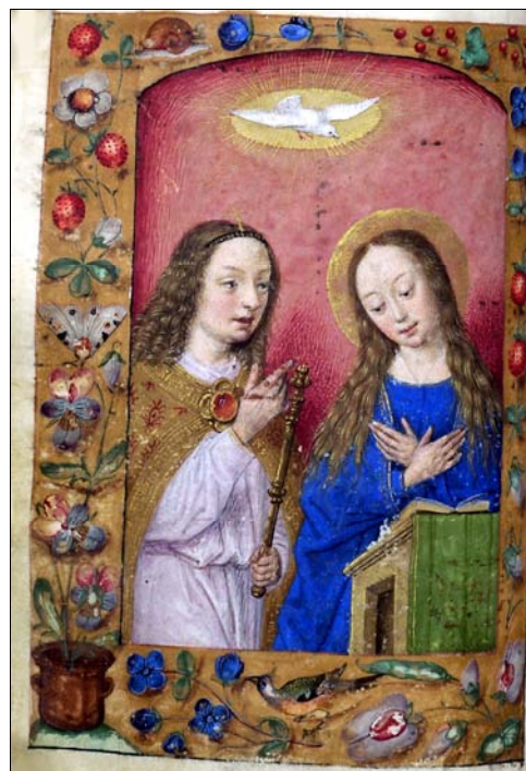
■ Lám. 19. Anunciación. Libro de Horas, Flandes (Barcelona, Biblioteca de Catalunya, ms. 1852, fol. 88v) (c. 1500)