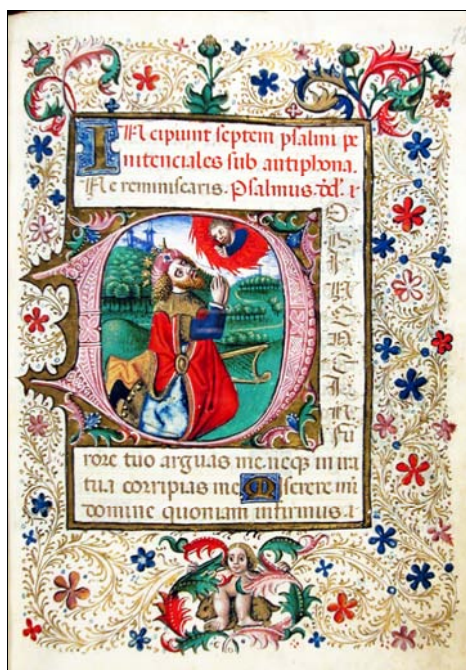
■ Lám. 3. Juan de Carrión. Rey David. Libro de Horas (Barcelona, Biblioteca de la Universidad, ms. 1841, fol. 184 (tercer cuarto del siglo XV).