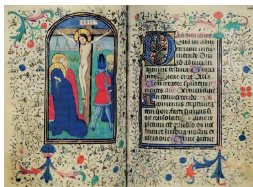
■ Lám. 12. Calvario. Libro de Horas, Inglaterra (Barcelona, Biblioteca de Catalunya, ms. 1855, fol. 109v) (2ª mitad del siglo XV).