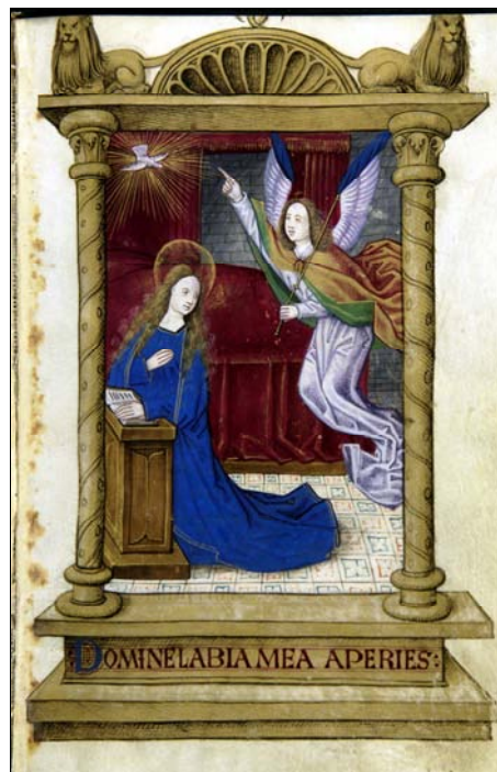
■ Lám. 6. Anunciación. Libro de Horas, norte de Francia (Barcelona, Biblioteca de Catalunya, ms. 853, fol. 24) (finales del siglo XV).