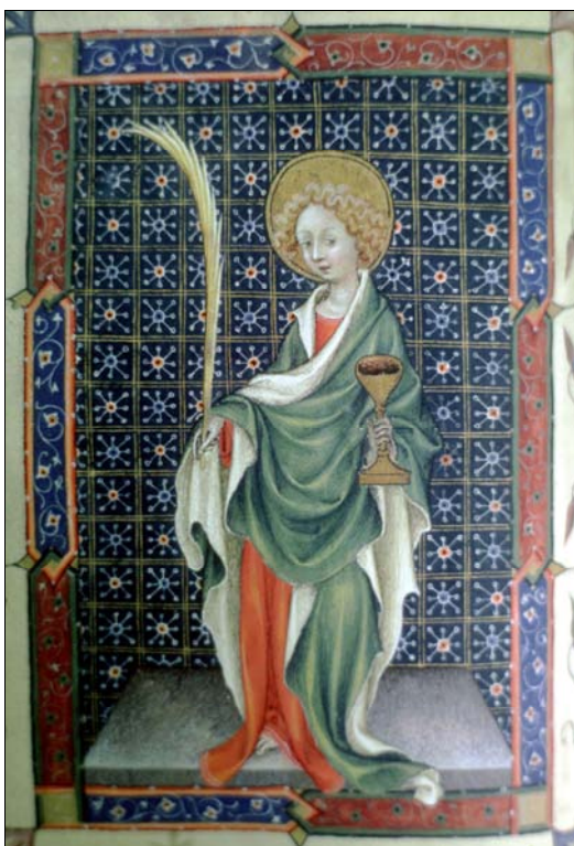
■ Lám. 1. Rafael Destorrents. San Juan Evangelista. Libro de Horas (Museo Episcopal de Vic, ms. 88, fol. 33v) (primer decenio del siglo XV).

La aproximación a los libros de horas se ha realizado desde varios puntos de vista que parten de la denominada "arqueología del libro" para estudiar el contenido espiritual, verificado a través de las conmemoraciones del calendario, la organización de las oraciones y los ciclos de imágenes que las ilustran, con el objetivo de facilitar una comprensión multidisciplinar del libro de horas, alejada de planteamientos puramente bidimensionales. No obstante, nuestro estudio es una primera toma de contacto con este tema y en definitiva, esperamos la aparición de publicaciones monográficas que perfilen y amplíen este fértil panorama.