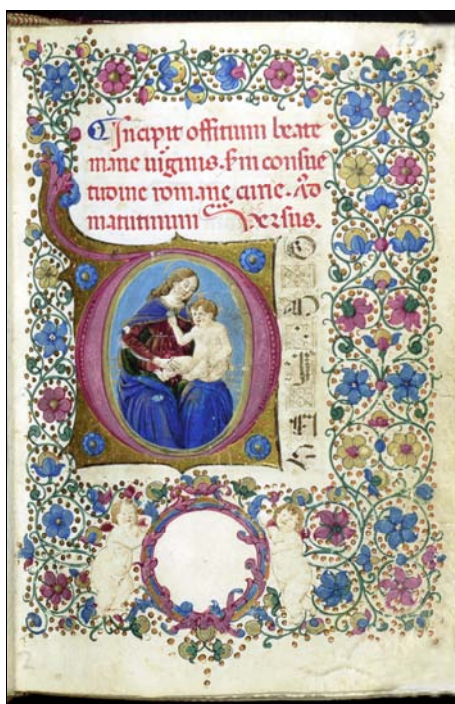
■ Lám. 11. Virgen con el Niño. Libro de Horas florentino (Barcelona, Biblioteca de Catalunya, ms. 1853, fol. 13) (finales del siglo XV).