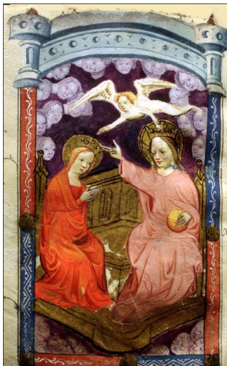
■ Lám. 13. Coronación de la Virgen. Libro de Horas, Flandes (Museo Episcopal de Vic, ms. 88, fol. 35v) (c. 1400).