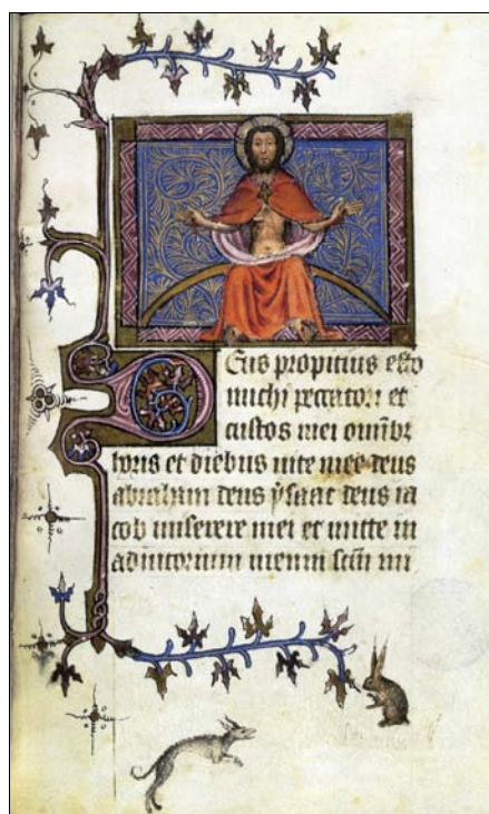
■ Lám. 5. Taller de Jean de Toulouse. Cristo en majestad. Libro de Horas (Barcelona, Biblioteca de Catalunya, ms. 1851, fol. 115 (c. 1400).