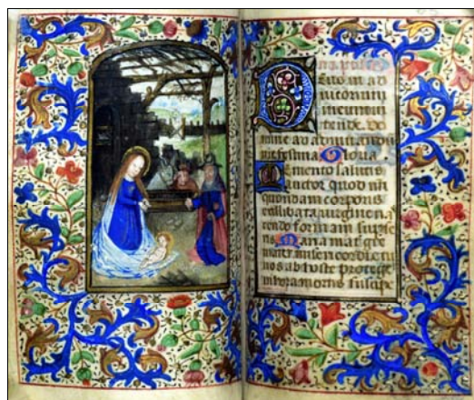
■ Lám. 15. Adoración del Niño Jesús. Libro de Horas, Flandes (Barcelona, Biblioteca de Catalunya, ms. 1856, fol. 85v) (finales del siglo XV).