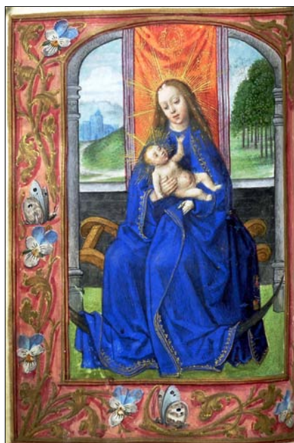
■ Lám. 18. Virgen con el Niño. Libro de Horas, Flandes (Barcelona, Biblioteca de Catalunya, ms. 1852, fol. 78) (c. 1500).