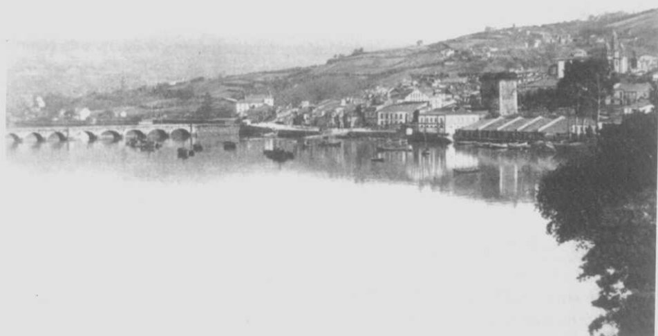
Pontedeume a principios del s. XX.