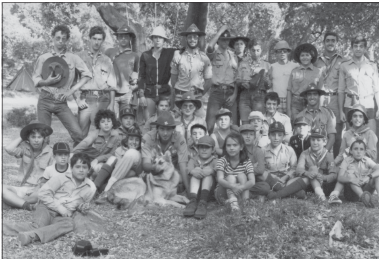
Imagen 6.- El campamento al completo.

1978, en que España reingresa en la Organización Mundial del Movimiento Scout (OMMS) al reconocer ésta a la Federación de Escultismo en España (FEE) como representante del escultismo español.