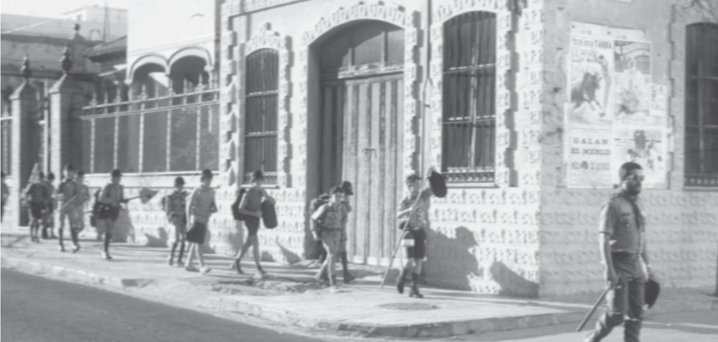
Imagen 1.- La patrulla scout se dispone a salir del pueblo.