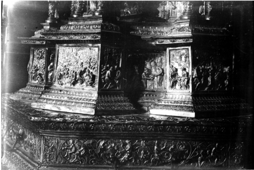
Antigua Custodia del Corpus. Catedral de Jaén. Basamento. Fondo fotográfico Instituto Gómez-Moreno (Granada).

truxere por parte de la dicha yglesia de la çibdad de Sevilla de çiençia suficiẽta y conçiẽcia a costa del dicho Françisco Merino para que la tase...».