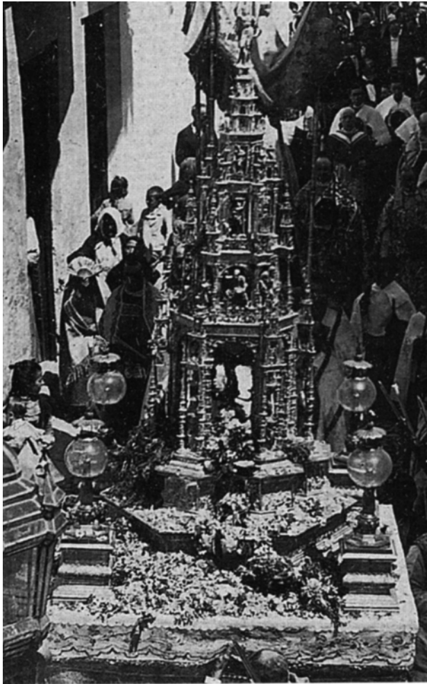
Antigua Custodia del Corpus. Catedral de Jaén. Procesión de 1910