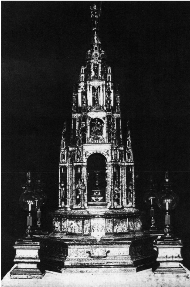
Antigua Custodia del Corpus. Catedral de Jaén.

tas de fábrica de la Catedral que Merino recibió un pago por valor de 700 ducados «...para en quenta de la plata y hechura...» 3 .