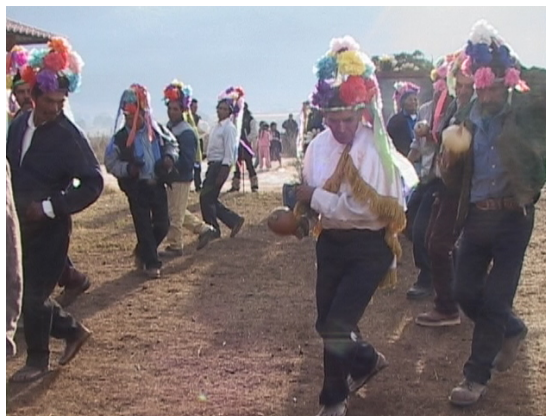
Matachín de Cerocahui (Baja Tarahumara)