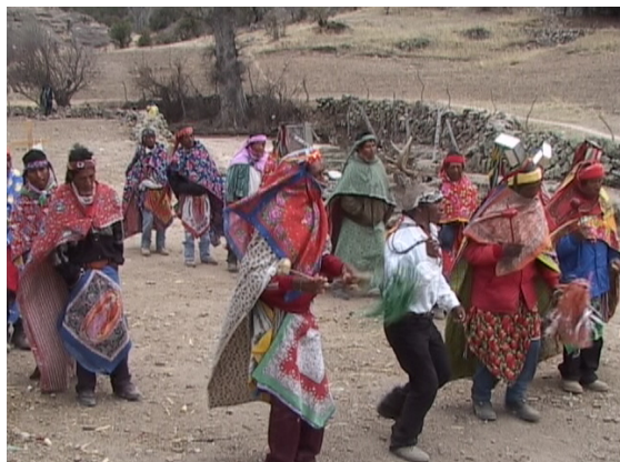
Matachín de Choquita (Alta Tarahumara)