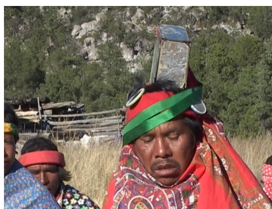
Monarco de Norogachi (A. T.)