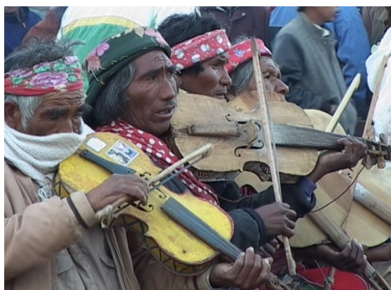
Músicos con violines en Sisoguichi (A. T.)