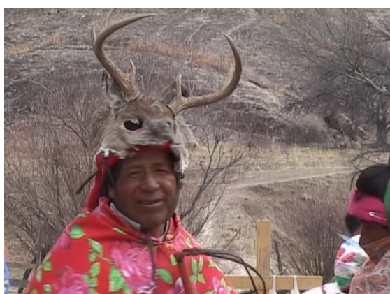
Chapeyoco de Choquita (A. T.)