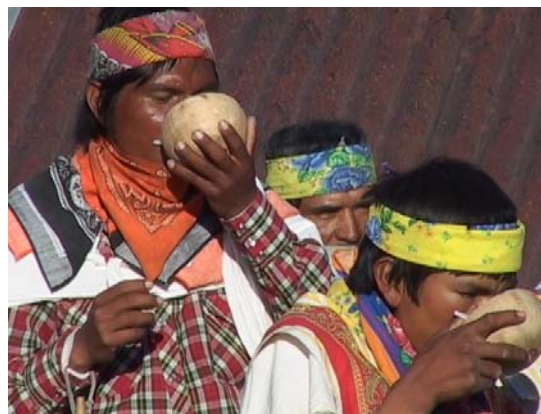
Matachines toman tesguino en Sisoguichi