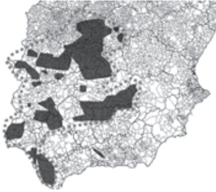
Plano 1: Ámbito de actuación

A contribución á recuperación da aguiña imperial ibérica desde o programa "Alzando o voo" formúlase coa incorporación de medidas de xestión para a mellora do seu hábitat, medidas de xestión que fomenten as poboacións da súa principal presa, o coello, a loita contra as principais ameazas que afectan a especie, e, por suposto, coa participación e sensibilización de todos os sectores e actores sociais que conviven coa especie e que dun xeito ou outra están implicados na súa conservación. Para levar a cabo este traballo e alcanzar estes obxectivos é indispensable recorrer aos instrumentos sociais obxecto deste seminario: a comunicación, a educación, a participación e a sensibilización, que serán utilizados para desenvolver as tres liñas principais de actuación nas que se estrutura o Programa "Alzando o voo": Xestión de hábitat, conservación e participación, e sensibilización e difusión.