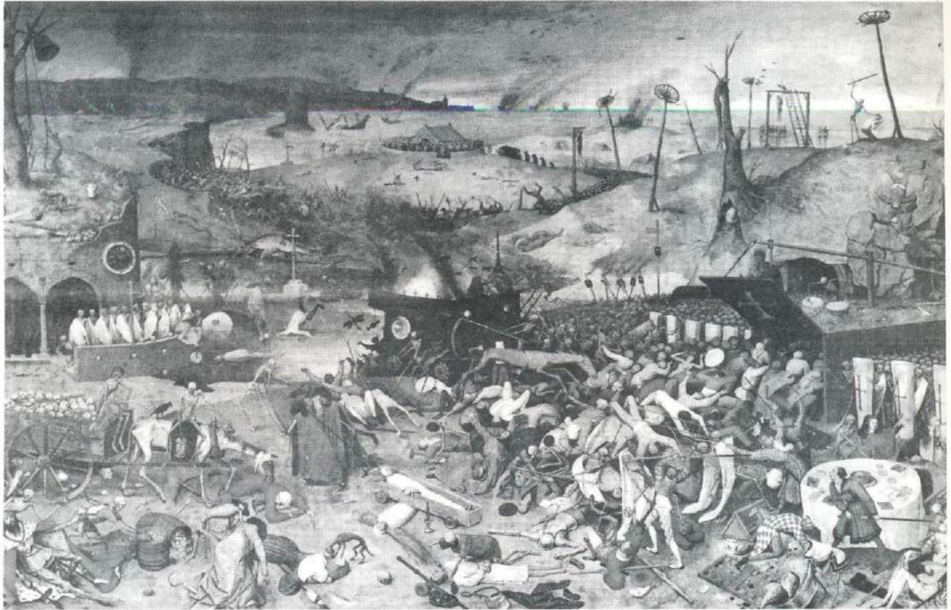
Triunfo de la muerte . Pieter Bruegel el viejo

tra interlocutora y se ofrece ella misma. La Muerte se queda enternecida pero no puede devolver a su amado. Es entonces cuando la joven decide apostar por el amor a cualquier precio y se une con él en un abrazo macabro que los reúne bajo la negra capa de quien no sólo no logró separarlos sino que acabó uniéndolos del modo más definitivo. Volvemos a encontrarnos, así, con el argumento que vimos en Quevedo y en Cadalso: el amor triunfante erigiéndose sobre unas cenizas que son autoaniquilamiento pero también pasión.