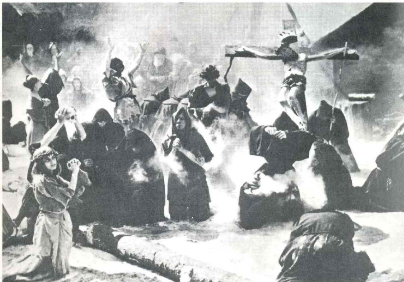
"El séptimo sello" Ingmar Bergman

iconografía fúnebre, desarrollando mórbidos amores en lechos de tumbas con fondo de cipreses. En España uno de los autores que se ha hecho eco de esta estética no es precisamente del siglo diecinueve, pero sí ha sido, al menos en la obra a la que vamos a referirnos ahora, calificado como prerromántico . Se trata de José de Cadalso y sus agrídulces Noches lúgubres , a medio camino entre el género dramático y el novelesco y uno de los primeros experimentos de la llamada prosa poética . En esta obra, un pintoresco personaje que tiene el llamativo nombre de Tediato —una irónica forma, por cierto, de aludir al famoso spleen romántico— ha perdido a su amada y organiza con el sepulturero una cita que le permita abrir su tumba y reunirse con ella. Nos encontramos, naturalmente, ante un evidente caso del más irracional amour fou , unido a un, en ocasiones, hilarante comportamiento misantrópico que lleva al personaje a preferir el mundo de los muertos al de los vivos, contemplado de la forma más negativa.