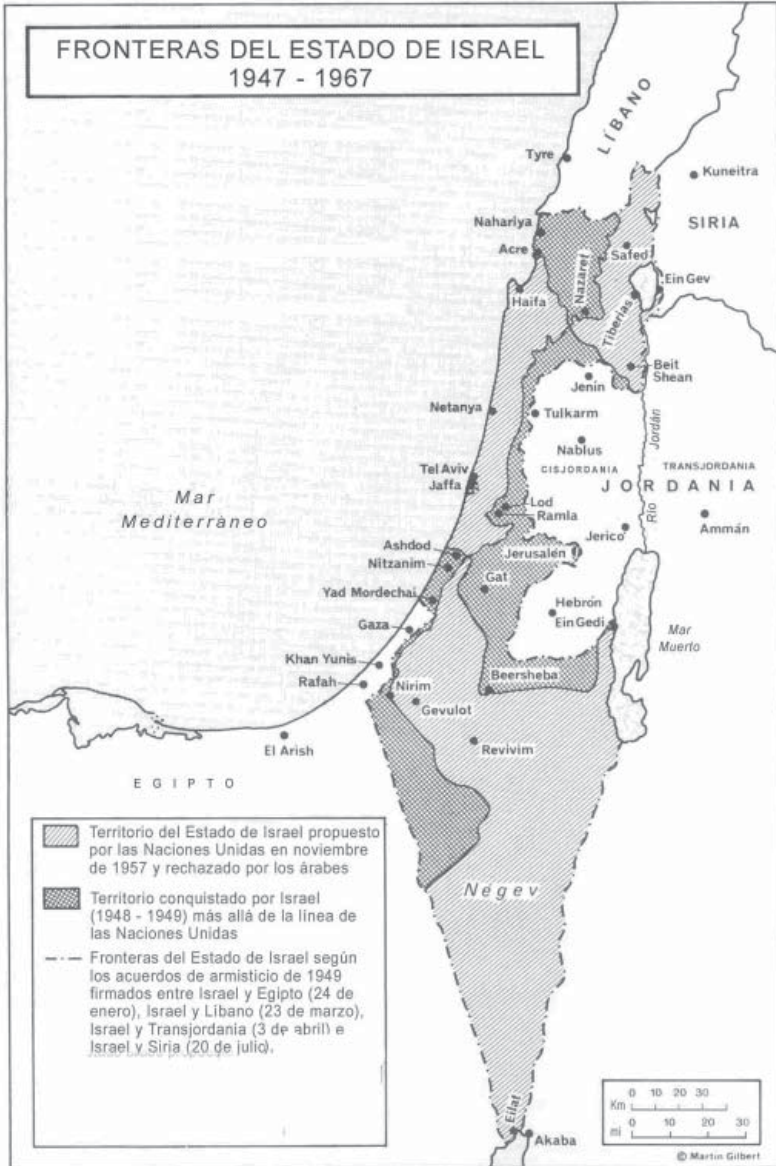
[Mapa No. 2- Las Fronteras de Israel, 1949-1967]